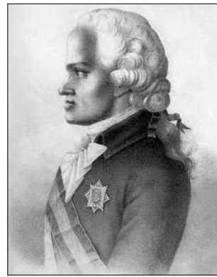
Демідов Павло Григорович (1738—1821). Вчився в Геттингенському університеті й Фрейберзькій гірничій академії, був радником Бергколегії. На створення Київського університету пожертвував велику суму грошей Demidov Pavlo G. (1738—1821)