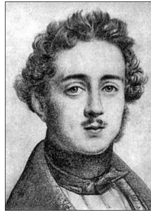
Демідов Анатолій Миколайович (1812—1879). Мав намір "учредити в Новоросійском крає каменноугольное и железное производство". А.М. Демідов — президент мінералогічного товариства Росії (1844—1865) — прямий нащадок Микити Демідова Demidov Anatoliy M. (1812—1879)