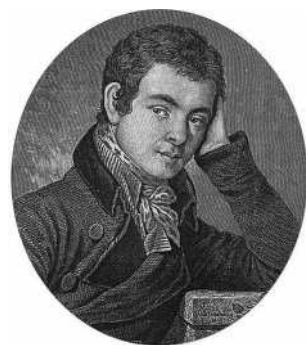
Каразін Василь Назарович (1773—1842). Український вчений, винахідник, освітній й громадський діяч. Несподіваний спільник А. Чарторійського в його протидії відкриттю в Києві університету Karazin Vasily N. (1773—1842)