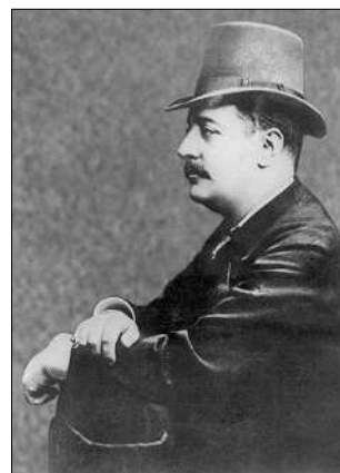
Демідов Павло Павлович (1839—1885). Закінчив Петербурзький університет, був Київським міським головою Demidov Pavlo P. (1839—1885)