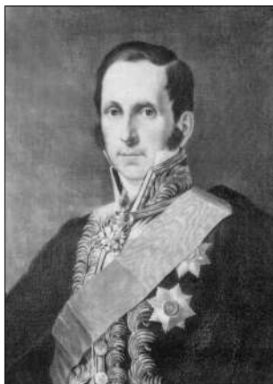
Граф Уваров Сергій Семенович (1786—1855). Державний діяч, дійсний таємний радник (1838), член Державної Ради (1834), міністр освіти Росії (1834—1849) Count Uvarov Sergiy S. (1786—1855)

Більш-менш системного характеру набувають геологічні дослідження надр України лише в петровську епоху. Чутки про мінеральні багатства південних околиць Росії ініціювали проведення на цій території експедицій, спочатку рудознавців Наказу рудних справ, Бергколегії, згодом — науковців Петербурзької академії наук для вивчення природних ресурсів. Результати їхньої діяльності не забарились,