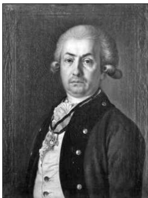
Янкович де Мірієво Ф.І. (1741—1814). Видатний діяч в галузі народної освіти, педагог, серб за походженням. У 1782 р. був запрошений для роботи в Росії. 1802 р. представив проект "заснування в Росії шести Університетів, або додання до існуючих уже в Москві, Вільно та Дерпті ще трьох: у Петербурзі, Казані і Києві". Yankovych de Miriyevo F.I. (1741—1814)