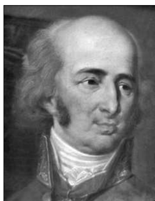
Чацький Тадеуш (1765—1813). Польський вчений і діяч у галузі освіти й культури. Категорично був проти створення в Києві університету Chatsky Tadeush (1765—1813)