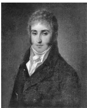
Князь Чарторійський Адам Єжи (Адам Юрій) (1770—1861). Польський політичний діяч. Виступив проти заснування в Києві університету. Prince Chartorysky Adam E. (Adam Yuriy) (1770—1861)