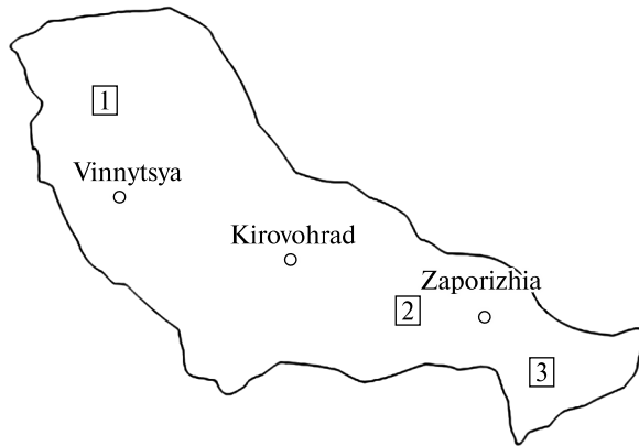
Рис. 2. Схема розташування рудопроаяв міді на території УЩ: 1 — Прутівський, 2 — Родіонівський, 3 — Крутобалкінський