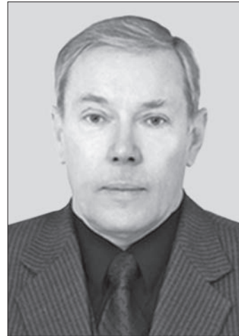
Ігор Євгенович Палкін Ihor Yevgenovych Palkin

Наприкінці 1999 року ІМР, який уже перейменували на Український державний інститут мінеральних ресурсів (УкрДІМР), отримав дуже сумнівний новорічний подарунок. Директора Ю.М. Брагіна викликали до Комітету з питань геології та використання надр, який був на той час черговим правонаступником Мінгео УРСР, і повідомили про наміри щодо оптимізації та покращення структури галузевих науково-дослідних установ, а саме, що з наступного року в Україні буде існувати тільки один галузевий науково-дослідний інститут — Український державний геологорозвідувальний (УкрДГРІ). Потужний і багатопрофільний,