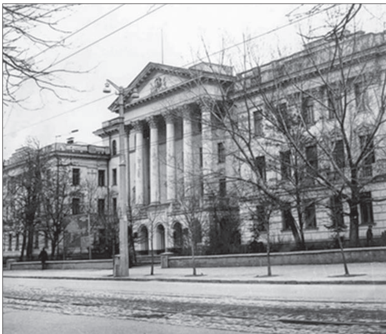
Головний корпус Інституту мінеральних ресурсів наприкінці 1950-х років (м. Сімферополь, АР Крим, Україна)