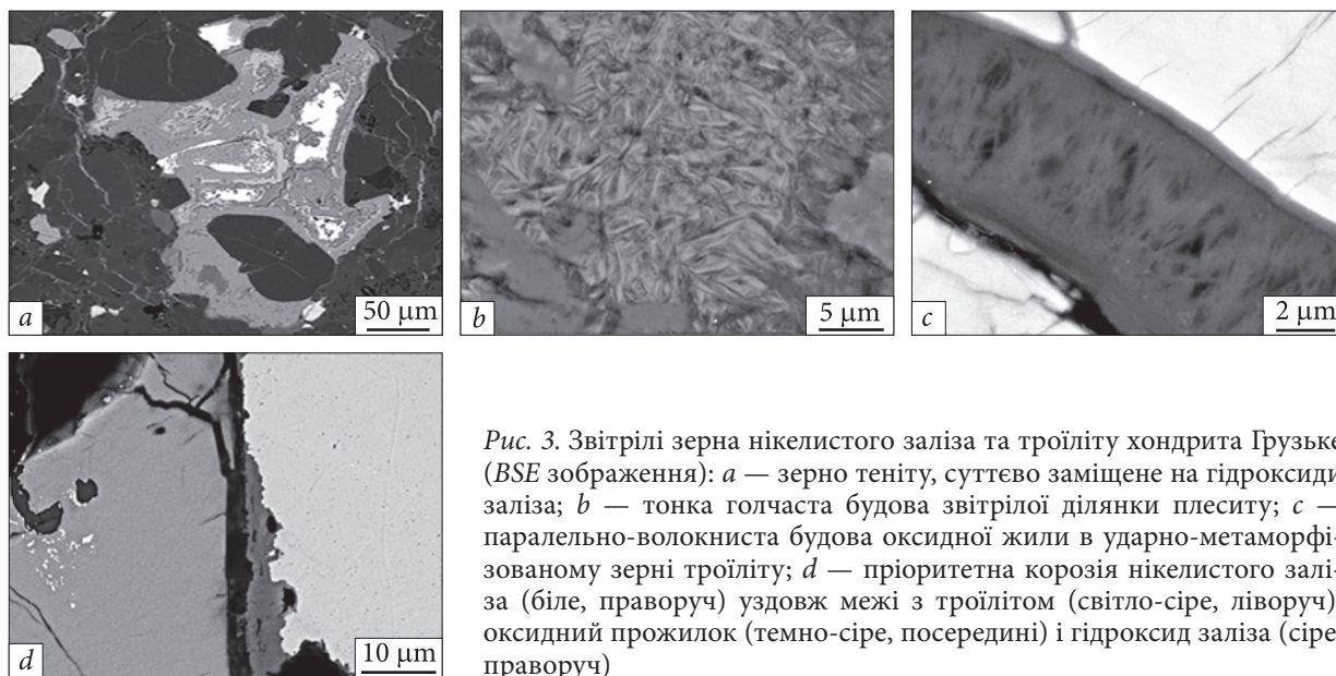
Рис. 3. Звітрілі зерна нікелістого заліза та троїліту хондрита Грузьке (BSE зображення): a — зерно теніту, суттєво заміщене на гідроксида заліза; b — тонка голчаста будова звітрілої ділянки плеситу; c — паралельно-волокниста будова оксидної жили в ударно-метаморфизованому зерні троїліту; d — пріоритетна корозія нікелістого заліза (біле, праворуч) уздовж межі з троїлітом (світло-сіре, ліворуч), оксидний прожилок (темно-сіре, посередині) і гідроксид заліза (сіре, праворуч)

Fig. 3. Weathered grains of nickel iron and troilite of the Gruz'ke chondrite (BSE images): a — taenite grain is significantly replaced by iron hydroxides; b — thin needle structure of the weathered plessite field; c — fibrous structure of the oxide vein in the shock-metamorphosed troilite grain; d — selective corrosion of Fe-Ni (white, on the right) along the grain boundary with troilite (light grey, on the left), an oxide veinlet (dark grey, in the middle) and iron hydroxide area (grey, right) are between minerals