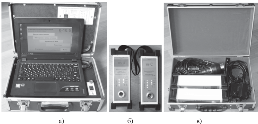
Рис.1. Корреляционный течеискатель К-10.5м2

режима работы зарядного устройства. Характеристики ноутбука СБ: операционная система – Windows 10, ОЗУ 2 Гбайт, объем SSD 64 Гбайт, цветной ЖКИ дисплей 11,6".