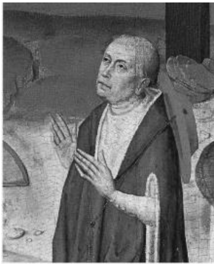
М. Кузанський (1401–1464)

зробимо зауваження. «Пантеїзм» – це поняття, що відображає єдність фізично-духовного, де завуальовує присутність трансцендентного, універсального в межах безпосереднього. Згідно з ним природа є не тому, що її створив Бог, а тому, що вона відтворює на всіх рівнях організації надчуттєвий принцип багатоманітності, невпорядкованості і унікальності. Бути існуючим означає містити у собі віддзеркалення незнищених смислів, закладених у кожній частині світобудови над раціональним – вічністю (eternitatis).