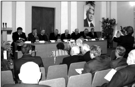
Президиум Общего собрания НАН Украины, посвященного 100-летию со дня рождения М.В.Келдыша

М.В. Келдыш родился 10 февраля 1911 г. в г. Риге и был пятым ребенком из семи детей в семье. С 1915 г. жил в Москве. На физико-математическом факультете Московского университета его учителями были великие