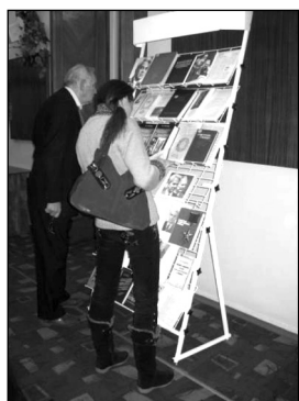
Неподдельный интерес у стенов с трудами М.В.Келдыша

математики РАН, член-корреспондент РАН Б.Н. Четверушкин рассказал о работе Мстислава Всеволодовича в институте, который носит теперь его имя. Институт был создан для выполнения правительственных заданий, распоряжение об этом подписано И.В. Сталиным в январе 1953 г. Как правило, расчеты были секретными и задачи разбивались на части, причем расчеты выполняли на счетных электрических машинах «Мерседес». Эти результаты собирались Келдышем и анализировались. С появлением ЭВМ БЭСМ-6 расчеты проводились на более высоком уровне для авиации, ракетостроения и космонавтики. В декабре 2010 г. Институт прикладной математики запустил новую супер-ЭВМ, назвали ее К-100, что расшифровывается как Келдышу — 100 лет.