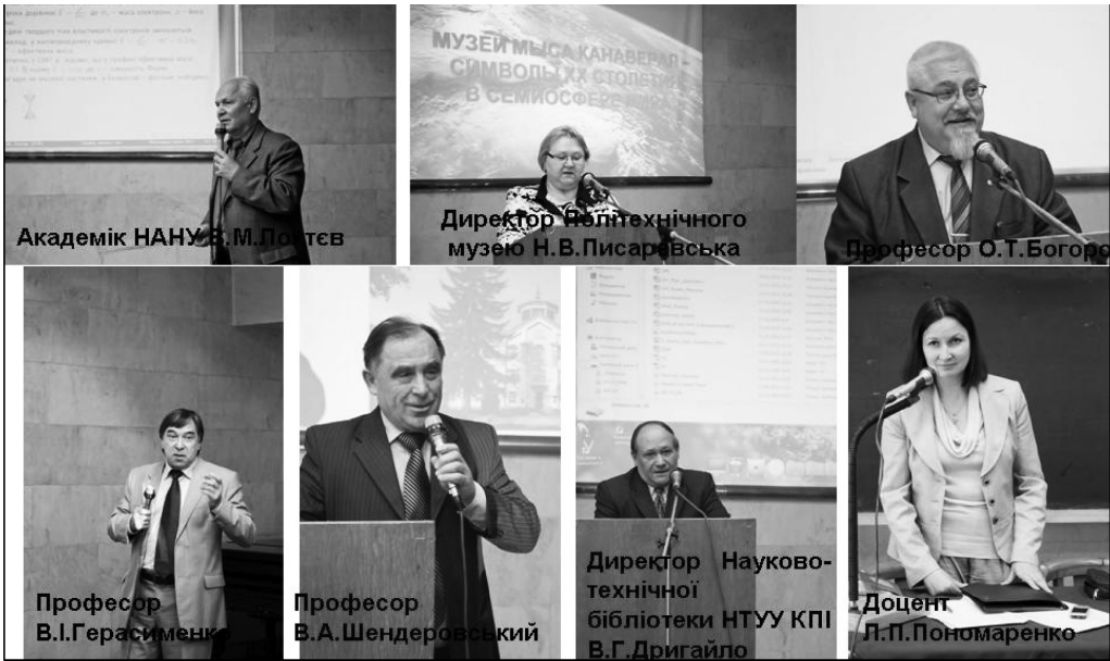
Академік НАНУ В.М.Портєв