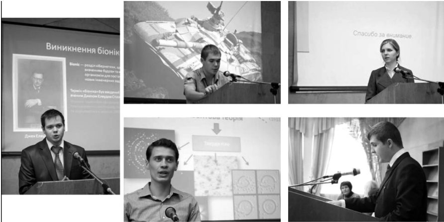
Виступи учасників конференції

ференцію, доповіді та заявки надсилаються учасникам електронною поштою, після публікації збірника бажаючим розсилається його електронний варіант, обов'язковим є використання ілюстративного матеріалу, оформленого у вигляді комп'ютерної презентації. Створено електронний ящик конференції та розробляється її веб-сайт.