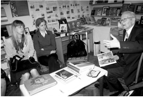
Експерсія до Музею інформатики, проведена його організатором - членом-кореспондентом НАН України Б.М. Малиновським.

нальний технічний університет України «Київський політехнічний інститут» та Центр досліджень науково-технічного потенціалу та історії науки ім. Г.М. Доброва проводять разом, підкреслюючи нерозривний зв'язок науки та освіти, академічної та університетської науки. Такі конференції є підготовчим майданчиком для майбутніх аспірантів, які потім залишаються в історії науки і техніки і приходять в аспірантуру академічних і освітніх установ з історії науки і техніки, в тому числі і в Центр ім. Г.М. Доброва.