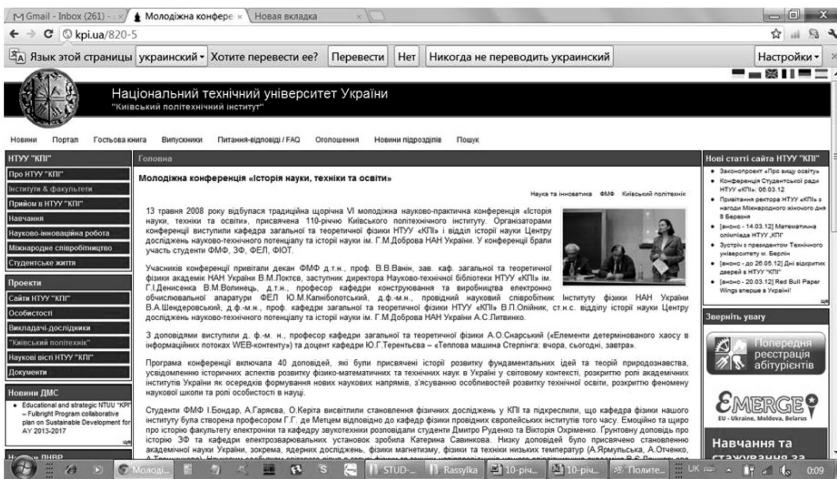
Висвітлення роботи конференцій у газеті "Київський політехнік"

З минулого 2011 р. було прийнято рішення об'єднати роботу Конференції в рамках Молодіжного симпозиуму з історії науки і техніки з Всеукраїнською конференцією молодих учених-істориків науки, техніки та освіти і спеціалістів, яку вже 17 років поспіль проводить Українське товариство історії науки, відділ історії науки і техніки та Центр досліджень з історії науки і техніки ім. О.П. Бородіна. Така спроба виявилася