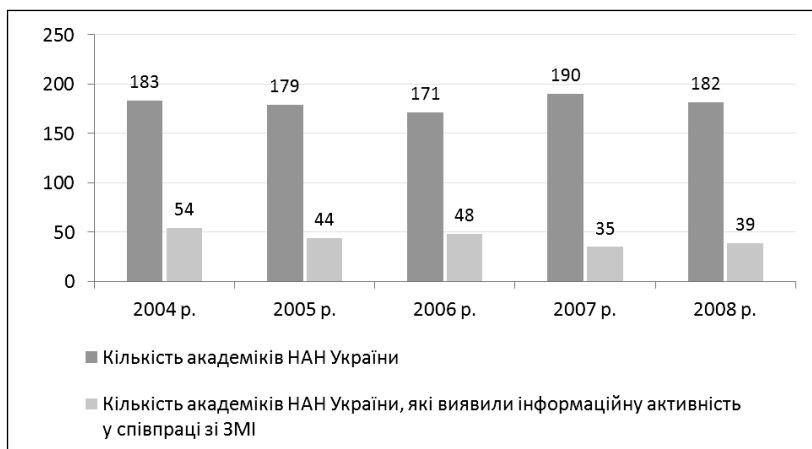
Рис. 1. Показники публікаційної активності академіків НАН України у вітчизняних ЗМІ

Показники публікаційної активності академіків та членів-кореспондентів НАН України у вітчизняних ЗМІ представлено на рис. 1, 2.