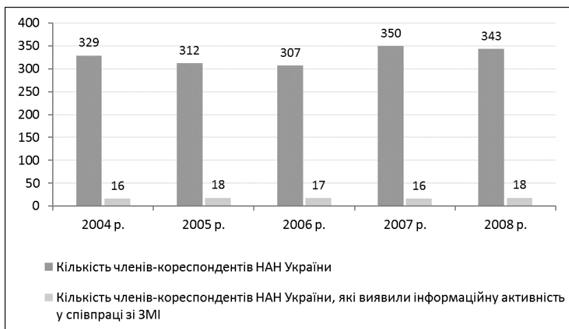
Рис. 2. Показники інформаційної активності членів-кореспондентів НАН України у вітчизняних ЗМІ