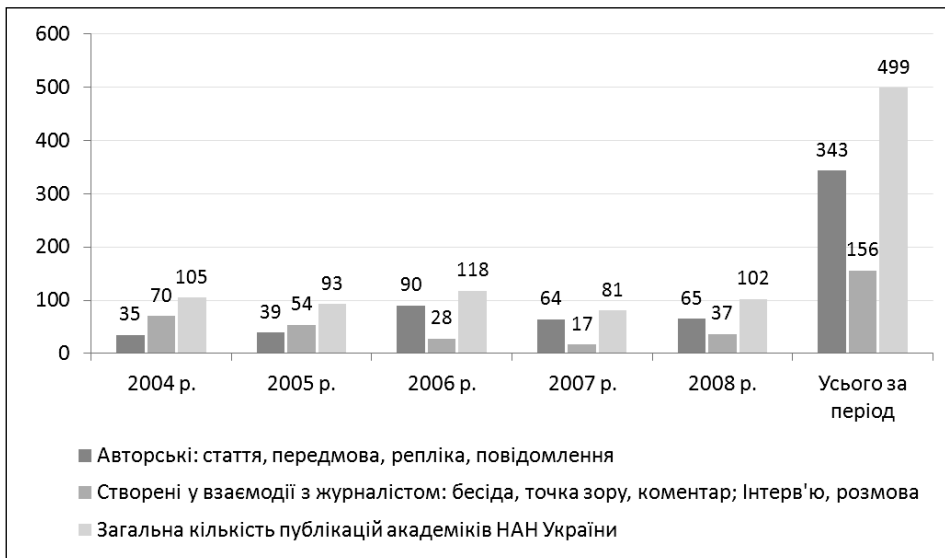
Рис. 3. Змістові характеристики інформаційної активності академіків НАН України у вітчизняних ЗМІ

Інформаційна активність членів-кореспондентів НАН України у вітчизняних ЗМІ виглядає значно скромнішою. Так, річна кількість авторських публікацій у звітному періоді не перевищує 10 протягом 2004–2006 років і дещо зростає у 2007–2008 роках. Доволі показовим є відставання членів-кореспондентів від академіків в абсолютних показниках, а якщо врахувати чисельну більшість членів-кореспондентів у складі академічної корпорації, то це відставання зростає ще у кілька разів (рис. 3, 4).