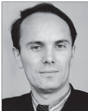
Президент АН Украины академик Б.Е. Патон

Разнообразие методологического воздействия кибернетики и информатики на науку в целом значительно повлияло на цели, задачи и методологию науковедения. Здесь можно увидеть и историческую составляющую такого влияния, но особенно оно значимо в актуальном плане. Информационно-коммуникационные технологии и сама методология информатики создают для науковедения перманентную проблемную ситуацию, формируют новые вызовы науковедческим исследованиям, требуют постоянной коррекции методологических оснований науковедения.