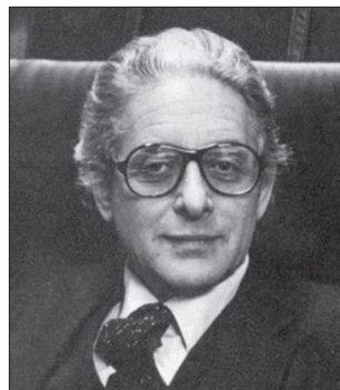
Д.Д. де Солла Прайс

«Большая наука» породила колоссальные проблемы с научной информацией: из-за роста объемов научных исследований и коллективов возник информационный кризис, ставший особо ощутимым с появлением мультидисциплинарных проектов. Традиционные предметные указатели и реферативные службы, построенные по отдельным направлениям знания, не спасали, когда требовалось подобрать научную литературу по атомному проекту, исследованию космоса или интенсивно развивающимся масштабным работам по генетике. Для решения таких задач научное сообщество нуждалось в новом подходе с использованием зарождающейся вычислительной техники. Инновационное значение в этой области имели идеи и разработки американского ученого Юджина Гарфилда (1925—2017), химика по образованию. Заинтересовавшись машинными методами индексирования информации, он начал выпускать с 1958 г. первое в мире сигнальное издание «Current Contents», содержащее оглавления только что вышедших научных журналов в самых различных областях знаний — от физики до