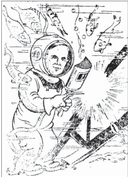
Дружній шарж «Вчений зварює під водою», газета «Известия», 1945 р.

на під флюсом і за короткий час створено проривні технології зварювання вертикальних швів, надшвидкісного зварювання труб, спорудження нафтових резервуарів, потокових ліній масових виробів. Автоматизація складально-зварювальних робіт при дуговому зварюванні під флюсом досягла максимуму. Майже несподівано було відкрито новий вид зварювання — електрошлакове зварювання, на основі якого створено електрошлаковий переплави і започатковано спеціальну електрометалургію [20].