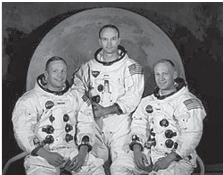
Екіпаж «Аполлона-11». Зліва направо: Н. Армстронг, М. Коллінз, Е. Олдрін

16 липня 1969 р. запуснено американський пілотований космічний корабель «Аполлон-11», який уперше доставив на поверхню Місяця астронавтів Ніла Армстронга (командир корабля), Едвіна Олдріна (пілот місячного модуля); Майкл Коллінз залишався в орбітальному блоці на навколomisячній орбіті. 20 липня 1969 р. місячний модуль здійснив м'яку посадку на поверхню Місяця в Морі Спокою. Наступного дня Н. Армстронг, а потім Е. Олдрін у спеціальних скафандрах з автономною ранцевою системою життєзабезпечення вийшли назовні й ступили на місячний ґрунт. Зробивши крок з місячного модулю на поверхню Місяця, Н. Армстронг вимовив знамениту фразу: «Це один маленький крок для людини, але гігантський стрибок для всього людства». Понад дві години астронавти провели поза місячною кабіною, віддаляючись від неї до 30 м, випро-