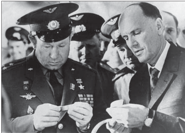
Б. Є. Патон показує космонавту О.А. Леонову зразки «космічного» зварювання

велика і обмежувалася ємністю акумуляторної батареї. Потужність зварювальних пристроїв для різних способів становила від 0,6 до 1,0 кВт. Щоправда, столик зі зразками з метою економії ваги був товщиною 3 мм. Коли столик зупинився, промінь пропалив його і зовсім тонкий корпус апарату. Але коли він подовжився і почав підплавляти внутрішню обшивку, джерело електрики вимкнулося. І, звичайно, стінку відсіку пропалити промінь не міг би. До того ж тиск у відсіку дорівнював заборотному, і розрив йому не загрожував. В космічних кораблях і станціях тиск атмосферний земний і досі жоден із них не розірвався. Проте в нагороду за «ризик» Кубасов пише: «За цей експеримент мене помістили в Зал міжнародної космічної слави — за початок проведення технологічних процесів в космосі» [15, с. 153]. (Можна доповнити: «Відтоді в СРСР без В.М. Кубасова не обходилися жодні заходи з приводу подій в історії зварювання».)