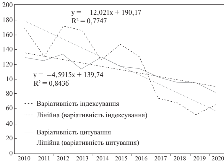
Рис. 3. Динаміка зміни коефіцієнтів варіації показників індексування та цитування праць науковців педагогічних університетів.