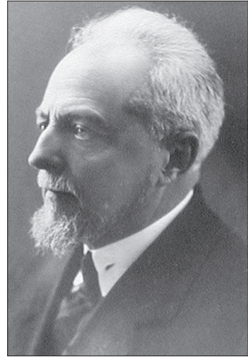
Євген Пилипович Вотчал

Наступним кроком стало обґрунтування Є.П. Вотчалом доцільності проектування при Інституті експериментальної ботаніки окремих відділів