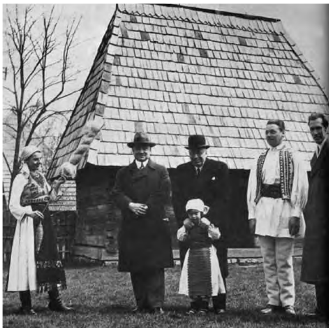
Дімітріє Густі в Музеї румунського села

З послідовників Д. Густі згадаємо також Траяна Херсеня (1907–1980), який працював в Університеті з 1932 року. Він був учасником монографічних колективів, очолюваних Д. Густі. З його праць (які стали відкриттями у своїй галузі) відзначимо такі: «Література і цивілізація. Спроби літературної антропології» (1976), «Давні форми народної культури. Палеографічне дослідження парубочих гуртів у Країні Олту» (1977), «Різдвяні колядки та обряди». Ще одним видатним учнем Д. Густі є Ернест Берня (1905–1990) – автор праць «Аспекти румунського народного мислення. Додаток до уявлень про простір, час та причинно-наслідкові зв'язки» (1985), «Румунська сільська цивілізація» (2006). У 1935–1940 роках він розробив і читав перший етнологічний курс у Бухарестському університеті.