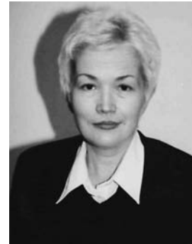
Марія Кармазіна, доктор політичних наук, професор Інституту політичних і етнологічних досліджень ім. І. Ф. Кураса НАН України, заслужений діяч науки і техніки України

ючи до порозуміння, треба впливати на сусідів фактами та аргументами, щоб зупинити цю агресію.