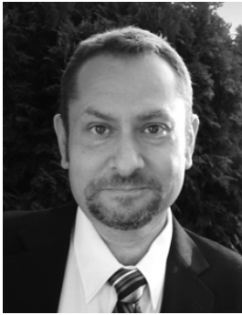
Сергій Єскельчик, голова Канадської асоціації українців, доктор філософії, канадський історик, родом з України

україністів, історика Сергія Олександровича Єскельчика.