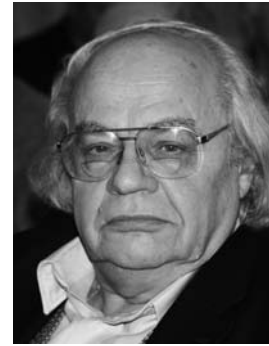
Іван Драч, український поет, перекладач, кіносценарист, драматург, державний і громадський діяч, Герой України

Дозвольте надати слово патріарху української культури Івану Драчу, який своєю поезією утверджує наш національний дух.