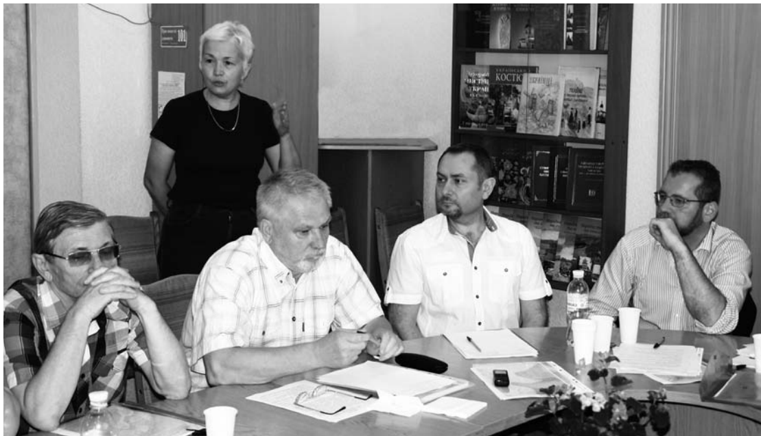
Учасники Круглого столу. Київ. 2014 р.