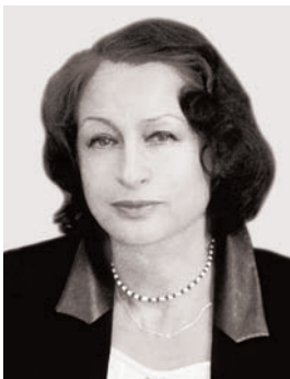
Ганна Скрипник, доктор історичних наук, академік НАН України, директор ІМФЕ ім. М. Т. Рильського НАН України

Шановне товариство! Сьогоднішній Круглий стіл ми зібрали у відповідь на ті драматичні події, що відбуваються на Сході України. Ще донедавна видавалося б абсурдним говорити про війну в Україні, а сьогодні — це страшна реальність. Для присутніх, гадаю, є очевидним, що збройне протистояння на Донбасі є наслідком як опосередкованого, так і безпосереднього військового вторгнення Росії на українську землю. Від російських «градів» і мінометів уже загинули тисячі людей. Мета вторгнення — не допустити реалізації євроінтеграційних прагнень українського народу, накинута Україні свій проект геополітичного вибору і перспективу інтеграції у так званий «русский мир».