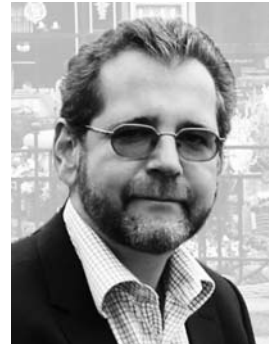
Міхаель Мозер, президент Міжнародної асоціації українців, професор Віденського університету

У процесі спілкування всі інші поважні учасники нинішнього зібрання будуть представлені аудиторії і, я гадаю, що ми належно пошануємо думку кожного. Отже, безпосередньо переходимо до обговорення заявленої проблеми — роль учених-гуманітаристів у забезпеченні стабільності та відновленні миру в державі; у пошуках шляхів, як покласти край тим згубним драматичним подіям, що точаться сьогодні на Сході України. Слово надається президенту Міжнародної асоціації українців Міхаелю Мозеру.