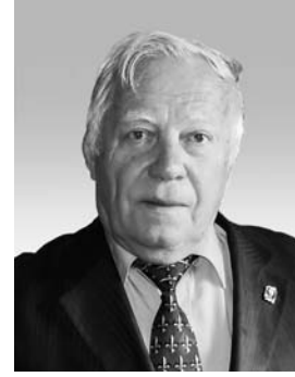
Всеволод Наулко, доктор історичних наук, професор, член-кореспондент НАН України, заслужений працівник освіти України

Винесені на обговорення питання — це питання державної ваги. Проблеми, які існують зараз в Україні, виникли не сьогодні. Дехто каже: «О, прийшов Янукович, прийшла Партія регіонів і почалося», а я скажу, що почалося значно раніше. Можу навести багато прикладів. Скажімо, коли я, керуючи експедицією, приїхав з Києва до Херсона і підійшов з папірцем, підписаним Максимом Рильським (тодішнім директором Інституту мистецтвознавства), до начальника аеропорту, він мені сказав: «Я этот собачий язык не понимаю». От вам. Це було в радянські часи, які дехто ідеалізує і каже, що тоді було все добре. Знаєте, з часом забуваєш, що була Чехословаччина, Угорщина, Польща і багато чого іншого страшного. Які конкретні пропозиції? Це передусім, щоб речі називали своїми іменами. Бо в нас пишуть, намагаючись щось прикрасити. Засоби масової інформації в нас якісь кволі, невиразні, запізнюються завжди. Пишуть «сусідня держава», північний сусід. Сусід — це звучить чудово, сусіда треба любити і поважати. Але сусід-загарбник — це щось інше. Анексують Крим, а наступного дня в нас з'являється газета, де показують, як Путін, веселий і радісний, грає в більярд.