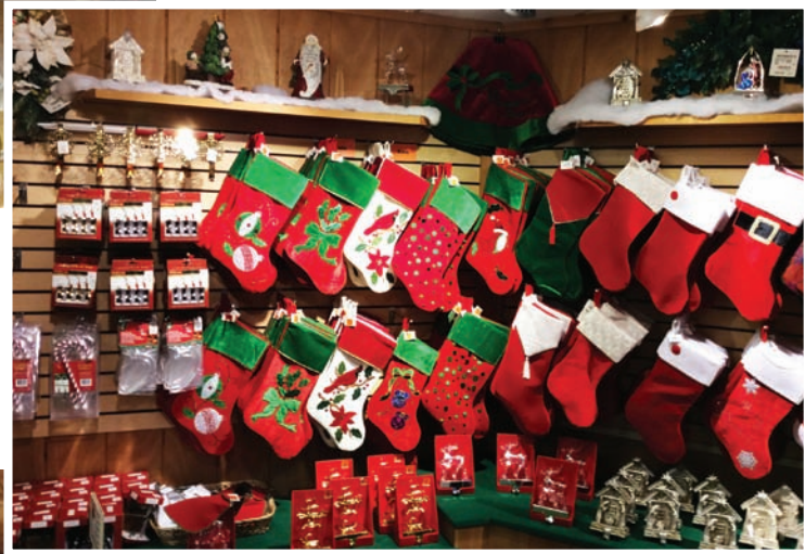
Різдвяні прикраси та аксесуари в магазині різдвяних прикрас. м. Франкенмут, США, штат Мічиган. 2014 р.