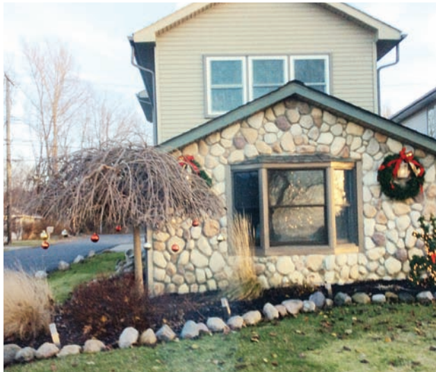
Різдвяне декорування будинків. м. Новай, США, штат Мічіган. 2014 р.