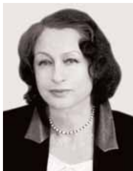
Ганна Скрипник, доктор історичних наук, академік НАН України, директор ІМФЕ ім. М. Т. Рильського НАН України

ІМФЕ ім. М. Т. Рильського НАН України Київ, 4 березня 2015 року