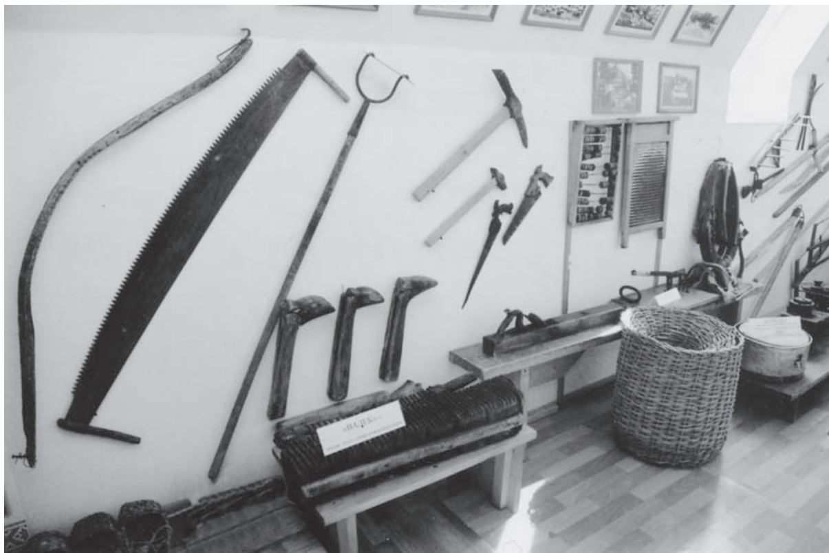
Частина експозиції в Музеї української діаспори Південного Уралу (м. Оренбург, РФ).

Після огляду цікавих експозицій у сільському краєзнавчому музеї та в школі, присвячених Кобзареві, Д. Чернієнко передав учням і вчителям нові книги й фотоальбоми від колективу Національного музею Тараса