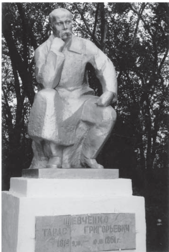
Пам'ятник українському Кобзарю в с. Карабутак Айтекебійського р-ну Актюбинської обл. (Республіка Казахстан).

До написів на портреті М. Савичева є одне суттєве зауваження: Новопетровське укріплення нову назву — Новоалександрівське укріплення — отримало 1858 року, тобто після від'їзду звідти Т. Шевченка 5 серпня 1857 року. Отже, усі написи на портреті, крім автографа Шевченка, зроблені або 1858 року, або пізніше. Тобто після перейменування військового укріплення.