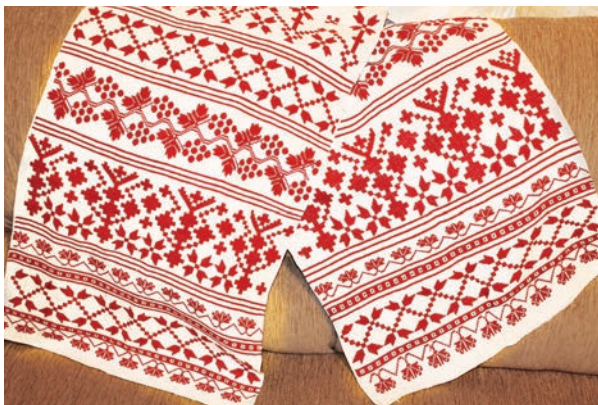
Рушник «Лубни». Домоткане полотно, гладь «качалочка», «хрестик», ретязь. 1940 р.