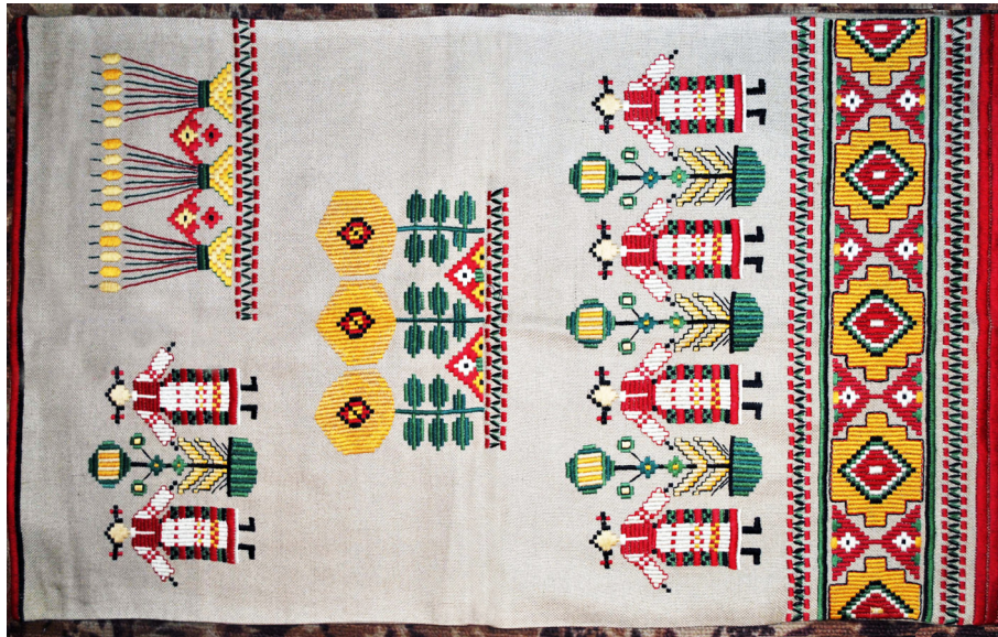
Панно «Свято врожаю». Полотно, гадь «качалочка», «лиштва». Грудень 1999 р. – січень 2000 р.