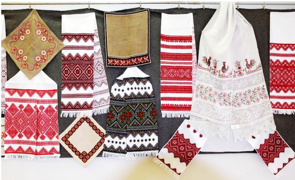
Частина експозиції з виставки робіт Віри Роїк. м. Сімферополь. Березень 2016 р.