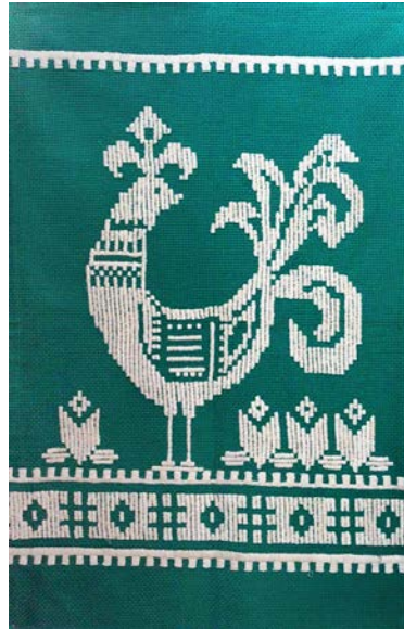
Панно «Зачарований півень». Панама, гладь «качалочка». 2000 р.