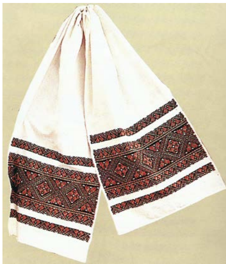
Рушник «Карпати». Домоткане полотно, «хрестик», «низь», «лиштва». 1970 р.