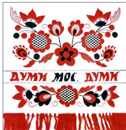
Панно «Думи мої, думи». Полотно, полтавська гладь, рушниковий шов. 1974 р.