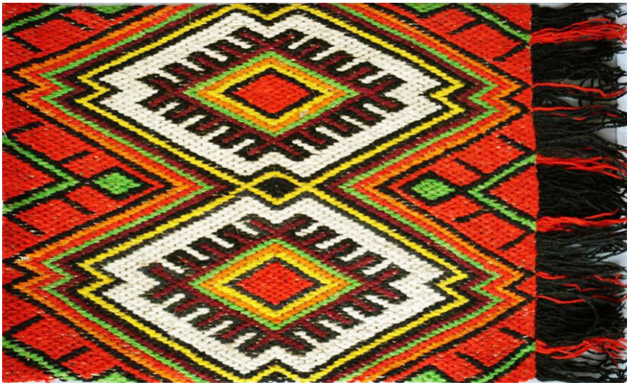
Килимок сувенірний «Верховина». Вишивальна тканина, «набирування». 1980 р.