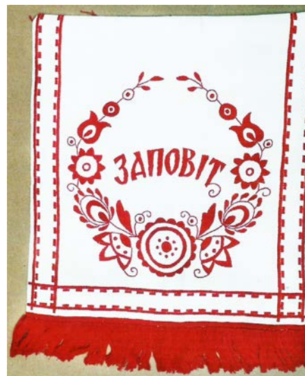
Панно «Заповіт». Панама, гладь «качалочка». 2001 р.