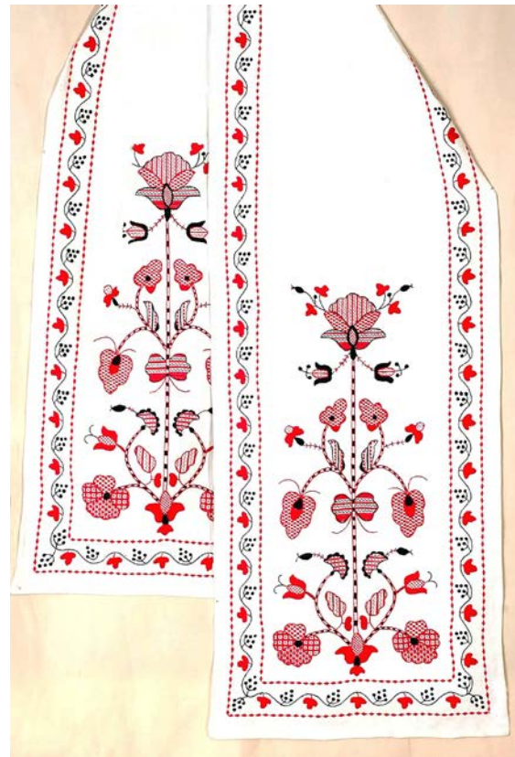
Рушник «Мрія». Домоткане полотно, полтавська гладь, рушниковий шов. 1972 р.