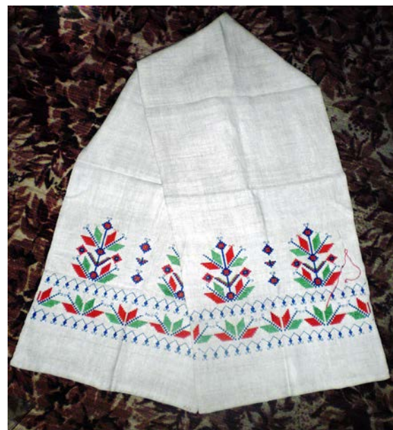
Рушник «Писанка». Домоткане полотно, гладь «качалочка», «фігурна драбинка». 1973 р.