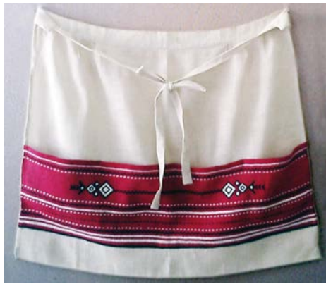
Фартух «Рівненський». Рядовина, гладь «качалочка», «насіпочка», «набирування», «верхошов», «коса гладь». 1982 р.