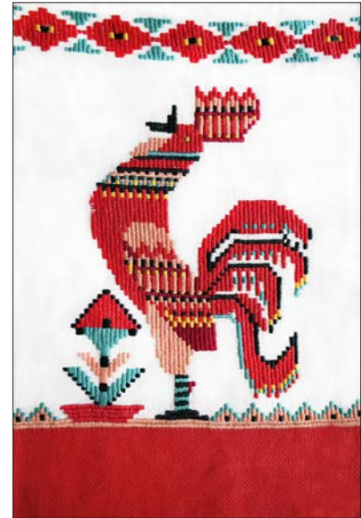
Панно «Світанок». Панама, гладь «качалочка». 2003 р.