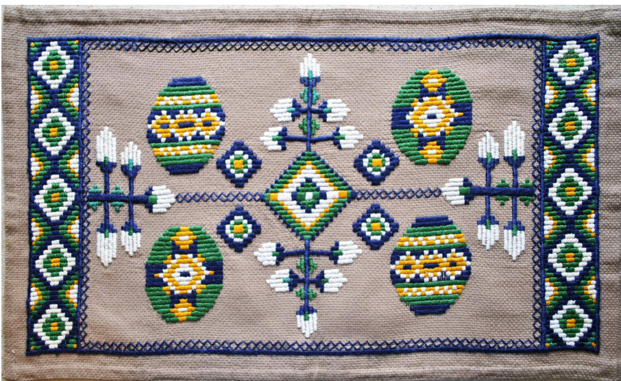
Доріжка «Великдень». Панама, гадь «качалочка». 2001 р.