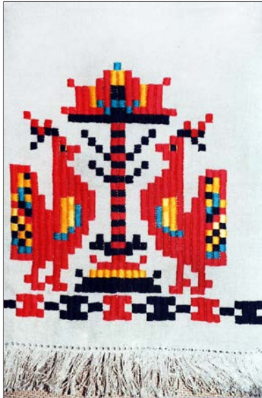
Панно «Забіяки». Рогожка, гладь «качалочка». 1996 р.