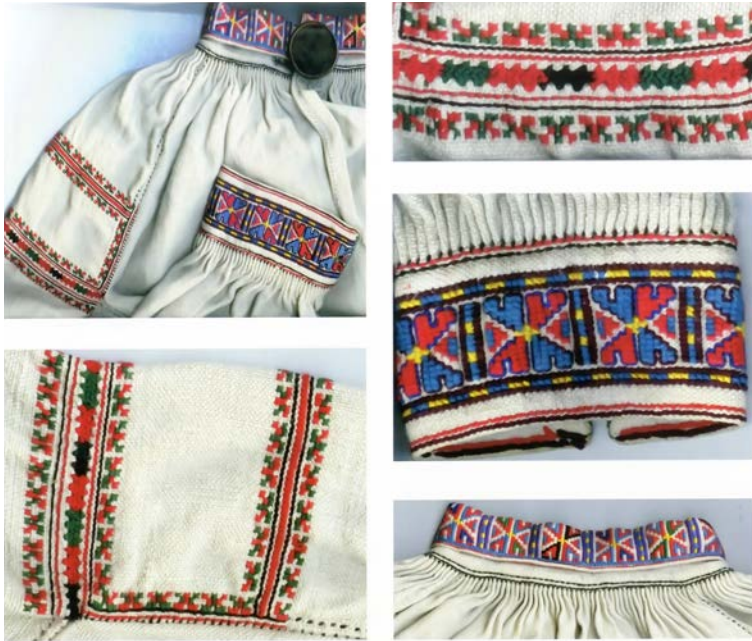
Запозичений «полуботківський» орнамент на комірі і манжеті сорочки зі Смільника кінця 20-х рр. XX ст.