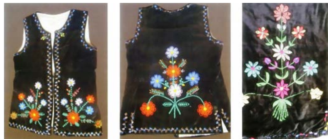
Оksamитовий сардак зі Скородного, оздоблений бісером, 40-і рр. XX ст.