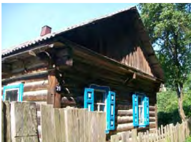
Іл. 2. Хата середини – другої половини ХХ ст. смт Любеч Ріпкинського р-ну Чернігівської обл. (2016 р.)