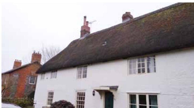
Іл. 4. Житловий будинок ХІХ ст. с-ще Евбері, Англія. (2018 р.)