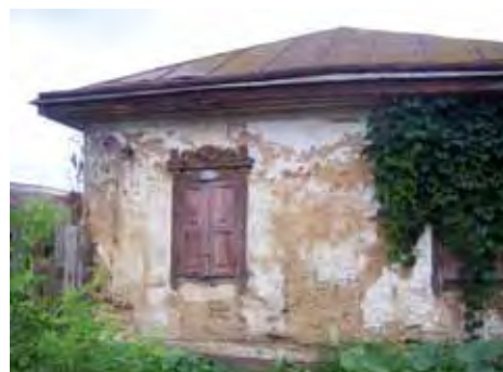
Іл. 3. Хата першої половини ХХ ст. м. Батурин Бахмацького р-ну Чернігівської обл. (2015 р.)