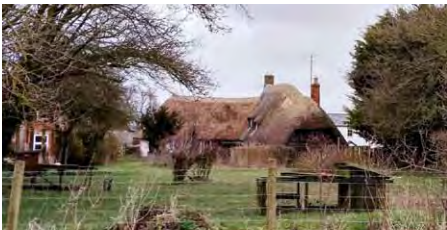
Іл. 5. Садиба ХІХ ст. с-ще Евбері, Англія. Світлина А. Ярової (2018 р.)