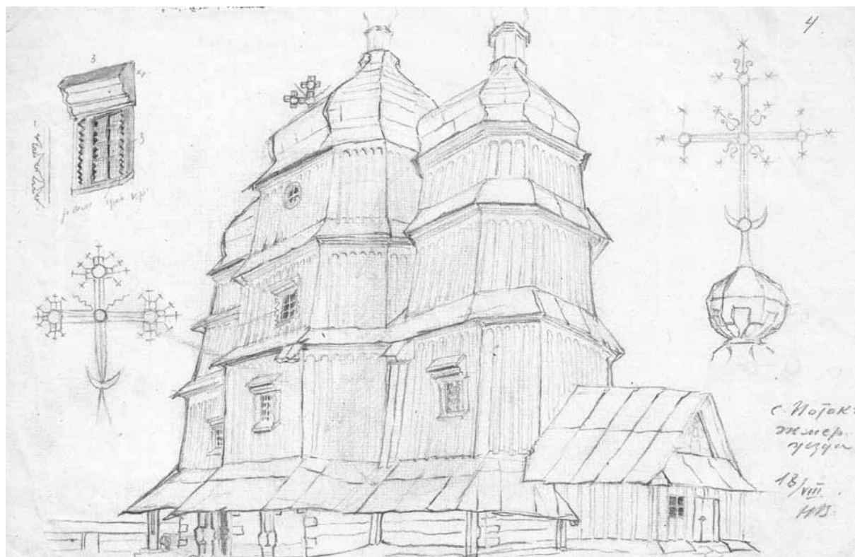
2. Микола Валукинський. Церква Святого Дмитрія Солунського в с. Потоки. 1921 рік. НА ІА НАН України