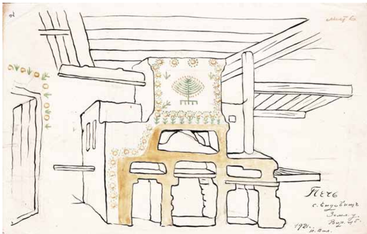
1. Микола Валукинський. Мальована печ у с. Єндовище. 1921 р.