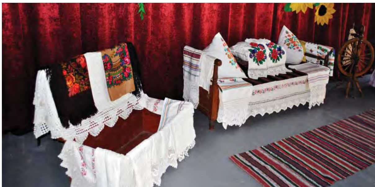
* Виставка предметів народного побуту на сцені Будинку культури с. Іванча.