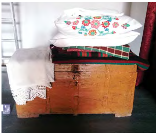
Скриня, ткані та вишиті речі