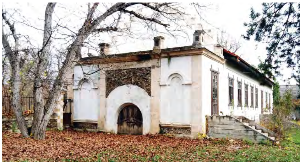
Флігель садиби К. Баліоза. Із торця будівлі – вхід у льох- пивницю