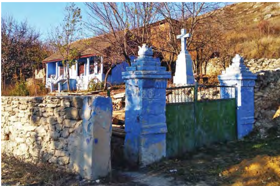
Сільська садиба (нині – приватний етнографічний музей) в історико-археологічному комплексі «Старий Орхей»