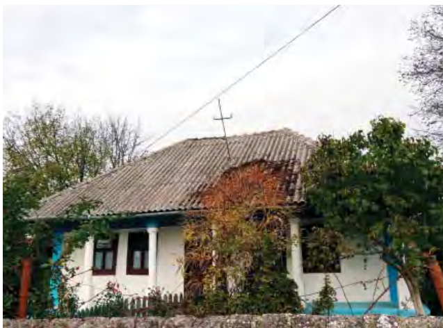
Житлові будинки першої половини ХХ ст. з білокам'яними колонками. с. Іванча Оргеївського р-ну Республіки Молдова