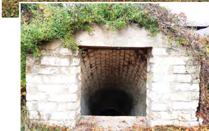
Великий винний льох-пивниця на господарському дворі