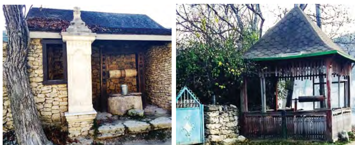
Криниці в с. Бутучень Орґеївського району Республіки Молдова