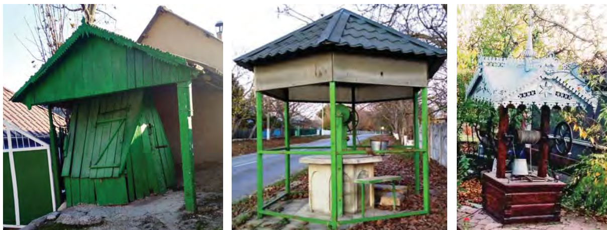
Криниці в с. Іванча Орґеївського району Республіки Молдова