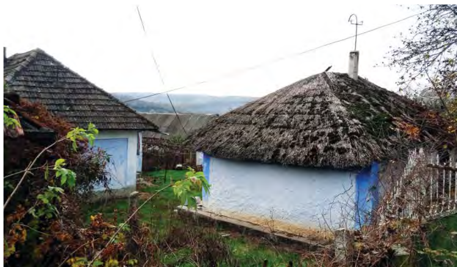
Усі світлини, окрім позначеної зірочкою (*), - Л. Босої та О. Головка. 2019 р.