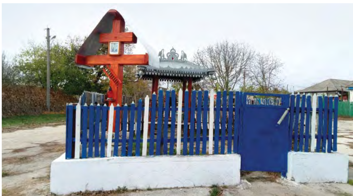
Криниця в центрі магали Пляц – головного місця зібрань громади с. Іванча