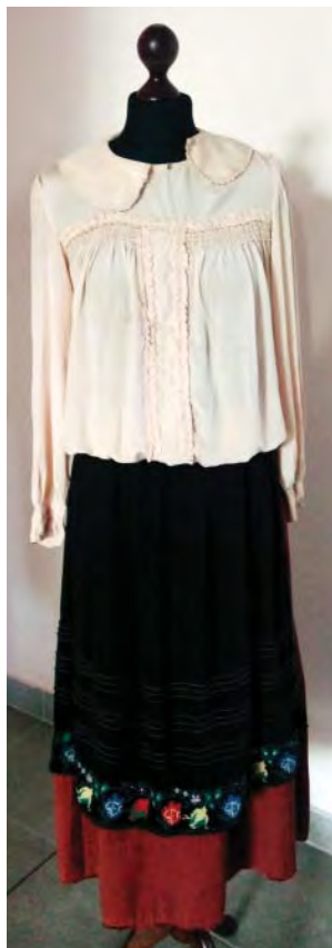
Один із перших жіночих сценічних костюмів ансамблю «Іванчанка», що раніше побував як святковий одяг сільських жінок