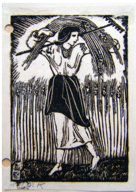
3. Олена Кульчицька. Оформлення запрошення на персональну виставку Олени Кульчицької. 1954 р. Офорт