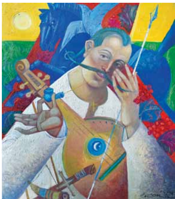
Козак Мамай. Полотно, олія. 42 × 48