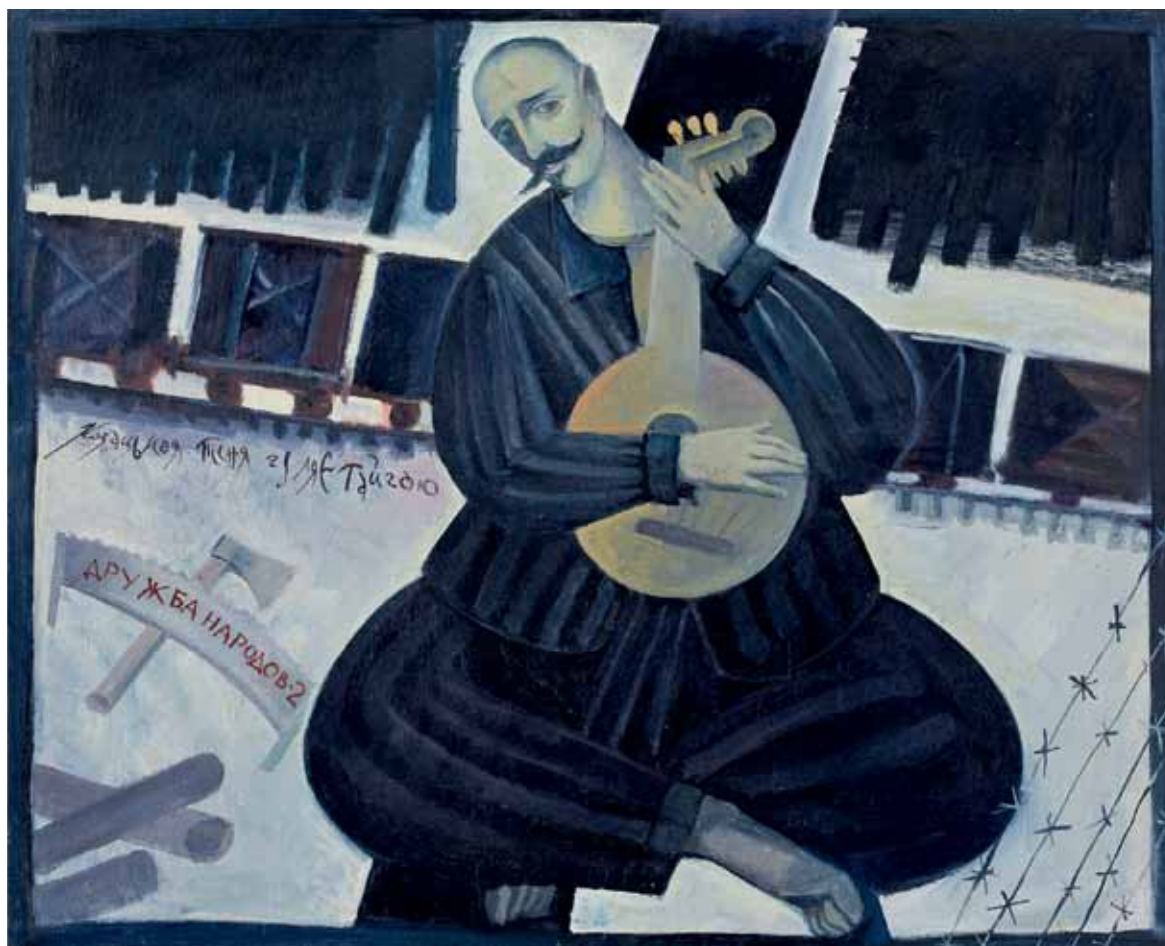
Козак Мамай. Полотно, олія. 80 × 100