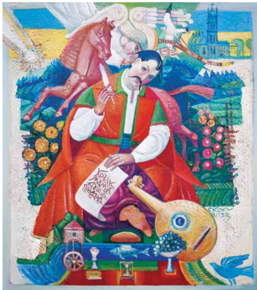
Козак Мамай. Дошка, полотно, олія. 50 × 45