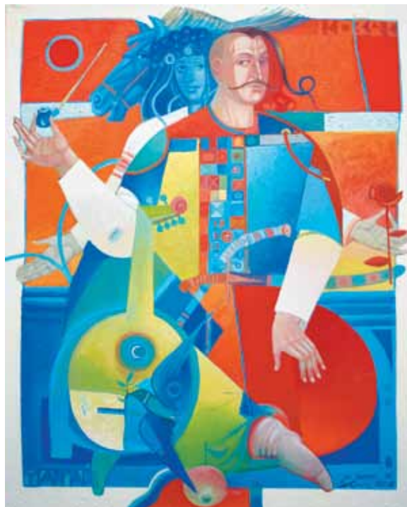
Козак Мамай. Полотно, олія. 100 × 80