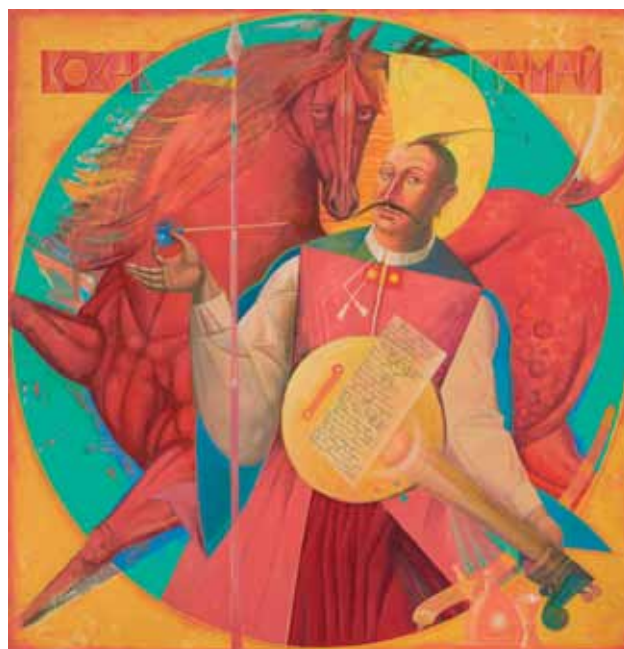
Козак Мамай. Полотно, акрил. 140 × 120