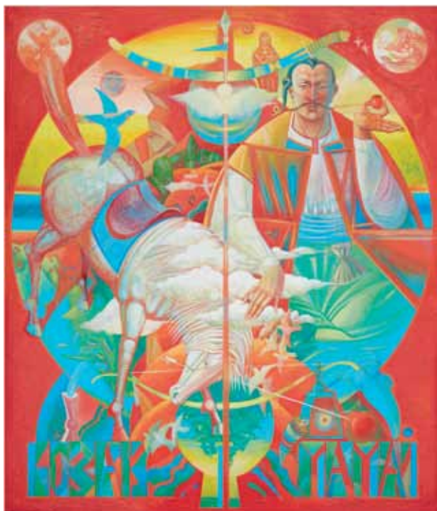
Козак Мамай. Полотно, акрил, олія. 140 × 120