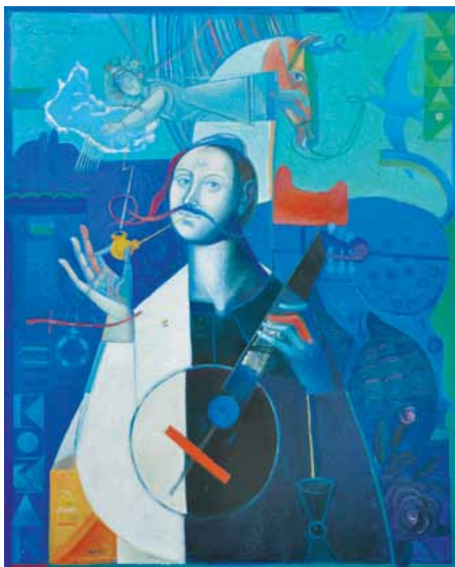
Козак Мамай. Полотно, олія. 100 × 80