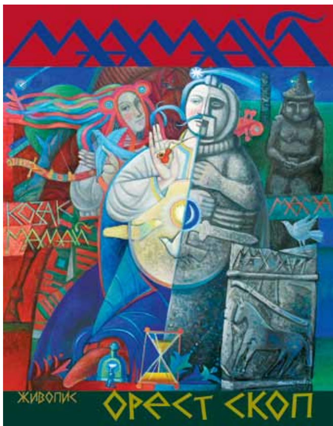
Обкладинка альбому Ореста Скопа «Козак Мамай»