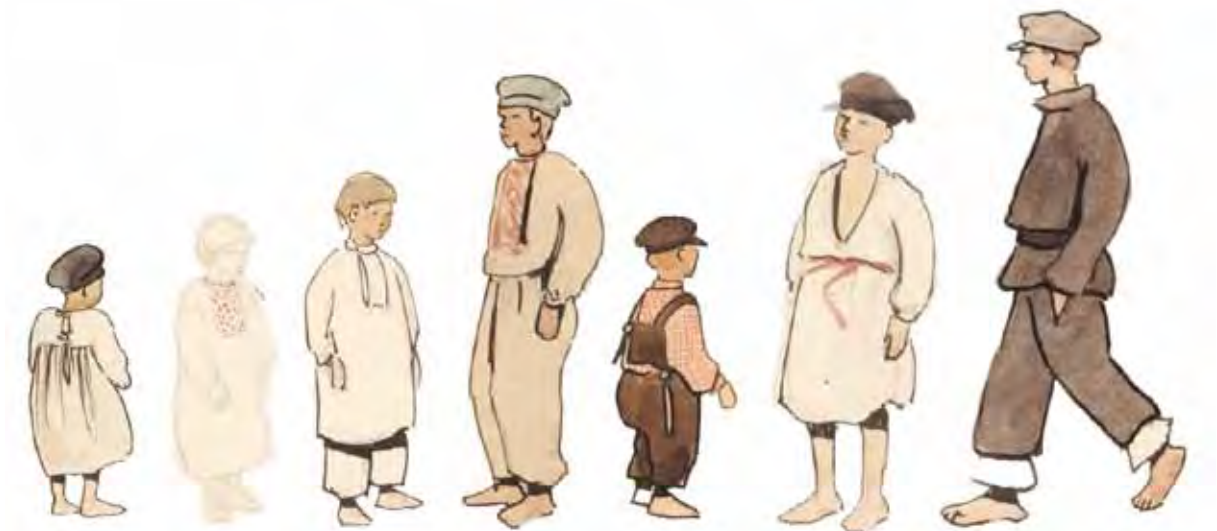
Хлопчики із с. Пост Дров'яний. 1928 р. АНФРФ ІМФЕ НАН України. Ф. 39-2. Од. зб. 24. Арк. 2, 10