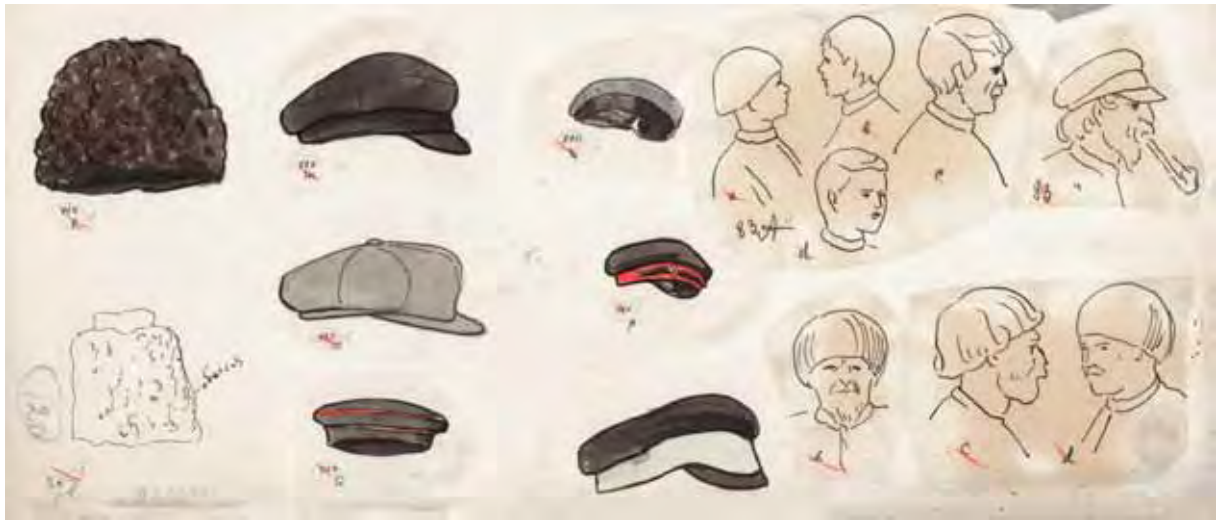
Зачіски та головні убори. с. Озеряни. 1928 р. АНФРФ ІМФЕ НАН України. Ф. 39-2. Од. зб. 25. Арк. 5