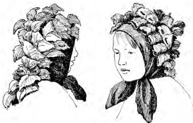
Шапка з листя. с. Старосілля. 1921–1923 рр. АНФРФ ІМФЕ НАН України. Ф. 1-8. Од. зб. 905. Арк. 33