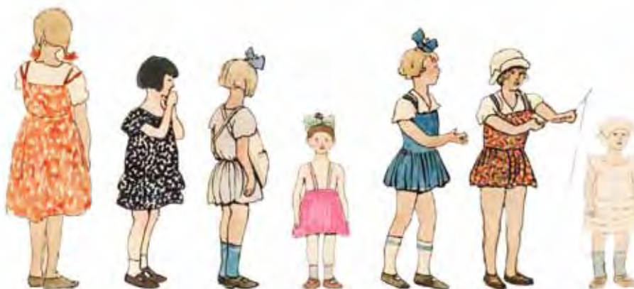
Дівчата з Києва. 1927 р. АНФРФ ІМФЕ НАН України. Ф. 39-2. Од. зб. 21. Арк. 2-3