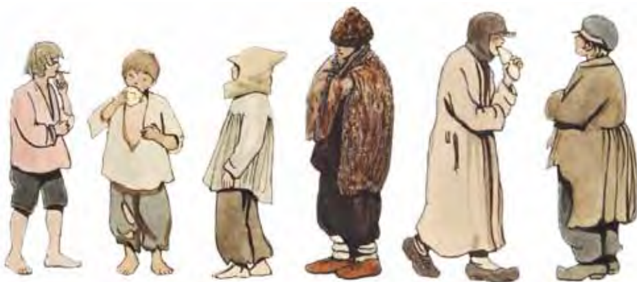
Безпритульні хлопчики з Києва. 1927 р.