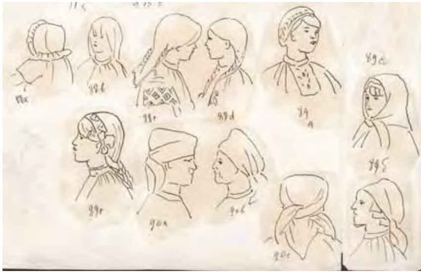
Зачіски та головні убори. с. Озеряни. 1928 р. АНФРФ ІМФЕ НАН України. Ф. 39-2. Од. зб. 25. Арк. 4