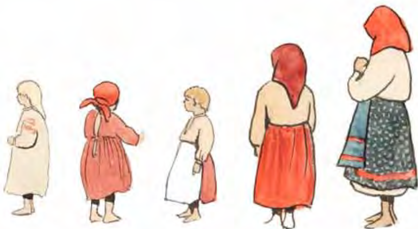
Дівчата із с. Пост Дров'яний. 1928 р. АНФРФ ІМФЕ НАН України. Ф. 39-2. Од. зб. 24. Арк. 9