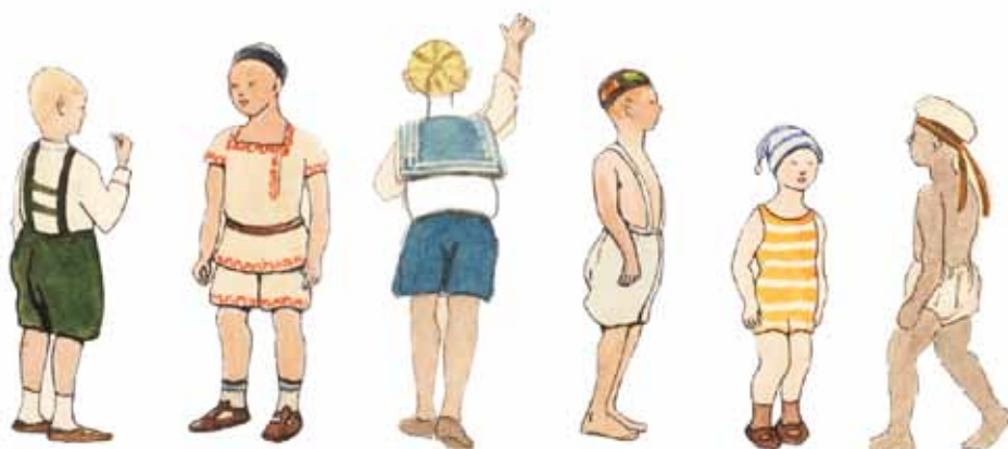
Хлопчики з Києва. 1927 р. АНФРФ ІМФЕ НАН України. Ф. 39-2. Од. зб. 21. Арк. 1, 4