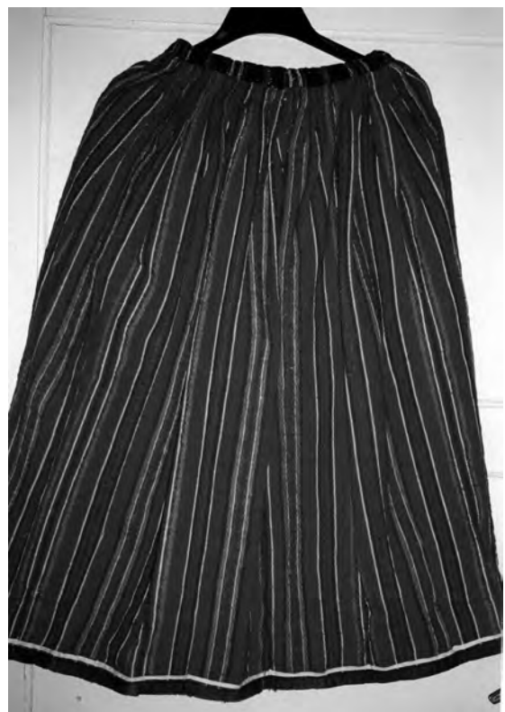
Спідниця, 1920-30-ті рр. с. Здомишель. Льон, вовна; полотняне ткання. МНАПЛ. АП-18488.