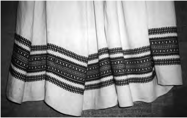
Спідниця “фартух” (фрагмент), 1930-ті рр. с. Нуйно Камінь-Каширського р-ну Волинської обл. Льон, бавовна; полотняне й перебірне тканиня “під дошку”. Волинський краєзнавчий музей (далі – ВКМ). Р2-1877.