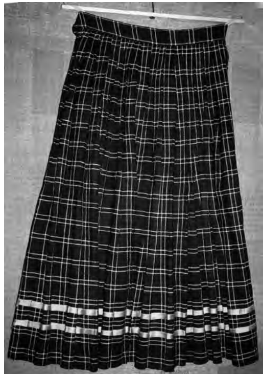
Спідниця, поч. XX ст. с. Краватка Рожищенського р-ну Волинської обл. Льон, полотняне ткання. ВКМ. Р2-148.