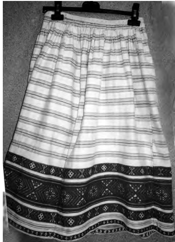
Спідниця “літник” (фрагмент), 1920-30-ті рр. с. Тур Ратнівського р-ну Волинської обл. Льон, бавовна; саржеве, перебірне ткання “під дошку”. Музей Івана Гончара (далі – МІГ). КТ-11119.