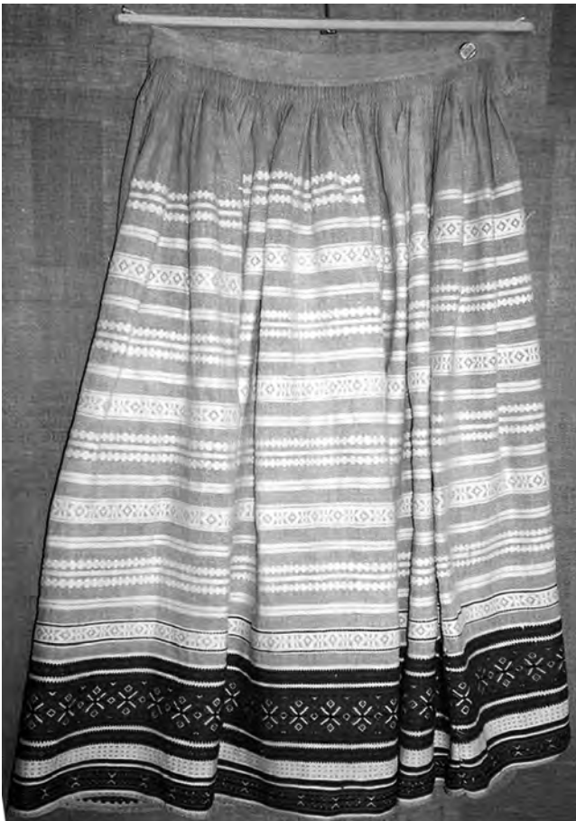
Спідниця “фартух”, 1920-30-ті рр. с. Теклине Камінь-Каширського р-ну Волинської обл. Льон, бавовна; полотняне й перебірне тканиня “під дошку”. ВКМ. Р2-212.

площин (Камінь Каширськ) 17 . Нижня, переважно вузка червона стрічка розташовувалася на відстані двох-трьох сантиметрів від краю виробу. Зовнішні краї цих двох (чи трьох) барвистих взористих площин завершені зубчастим силуетом, створеним перетиком 1/1 чи перебором – по дві нитки, позбавляли їх сухості сприйняття, вносили певний ліризм. Загалом ця орнаментальна стрічка акцентувала долішню частину виробу.