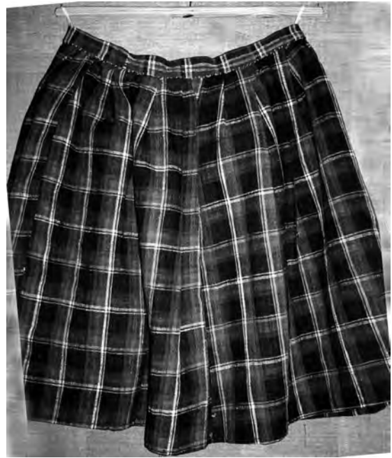
Спідниця “літник” (фрагмент), поч. ХХ ст. с. Острів Камінь-Каширського р-ну Волинської обл. Льон, полотняне тканиня. ВКМ. Д-187.

Аналогічна схема розташування кольорових смуг з “обмітками” характерна й для інших осередків ткацтва досліджуваного регіону (с. Кричинськ, Сарненського р-ну). Ширина цих різнокольорових стрічок така ж, як і проміжки синього тла між ними. Але завдяки різниці в тональних співвідношеннях й додатковому введенню тоненьких стрічок “обміток” досягнуто більшої різноманітності в ритміці їхнього чергування – послідовної зміни неоднакових за масою ширших і вузьких пасочків. Загалом найсвітліші білі смуги, розташовані симетрично з обох країв (верхнього та нижнього), вирізняються з-поміж інших і є домінантою композиції. Жовта, центральна поступається білій за тональністю, м'якше узгоджується із зеленими. Рожеві та червоні стрічки значно інтенсивніші, дзвінкіші за інші, тому вони підсилюють звучання білих.