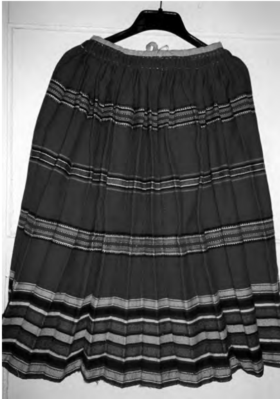
Спідниця, 1930-40-ті рр. с. Тур Рокитнівського р-ну Волинської обл. Льон, вовна; сатинове тканиня. МНАПЛ. АП-18506.