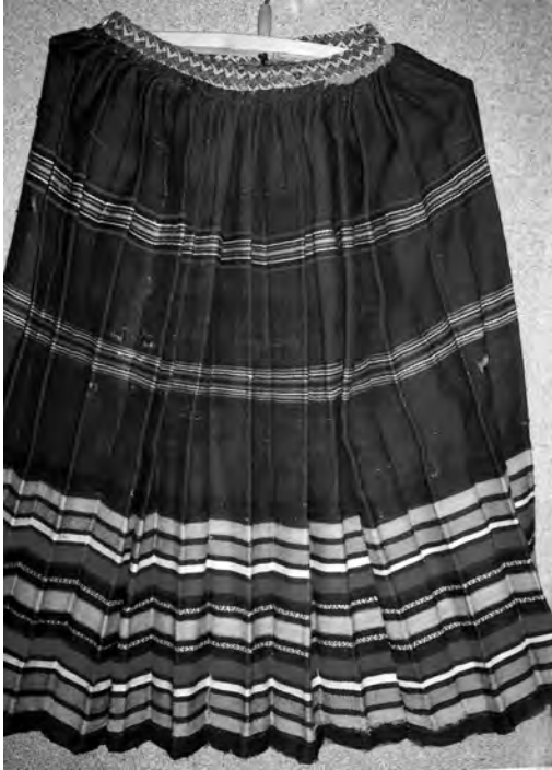
Спідниця “літник”, поч. XX ст. с. Ратне Волинської обл. Льон, вовна; сатинове ткання. МІГ. КН-622.