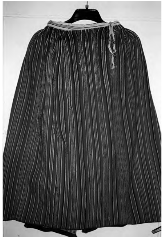
Спідниця, 1920-ті рр. с. Берестя Дубровицького району Рівненської обл. Льон, вовна; полотняне ткання. МНАПЛ. АП-15417.

Художнє вирішення тканин для спідниць тісно пов'язаний з багатьма іншими компонентами одягу (сорочками, запасками, хустками, безрукавками, крайками тощо). Місцезрештування декору, його величина, кольорові співвідношення, а також техніки виконання, структура й фактура тканин для спідниць та інших виробів взаємодоповнювалися, узгоджувалися й творили цільний художній ансамбль. У ньому не було нічого випадкового, зайвого й нераціонального, усе досконало вивірено, продумано та підпорядковано загальному комплексу традиційного вбрання.