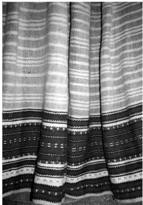
Спідниця, 1920-30-ті рр. с. Любязь Любешівського р-ну Волинської обл. Льон, бавовна; саржеве, перебірне ткання “під дошку”. МІГ. КН-1075.