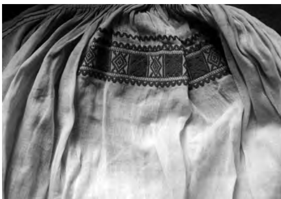
Спідниця “сукня” (фрагмент), кін. XIX – поч. XX ст. с. Крупів’є Дубровицького р-ну Рівненської обл. Льон, бавовна; полотняне й перебірне тканиня “під дошку”. Рівненський краєзнавчий музей. Т-2380.