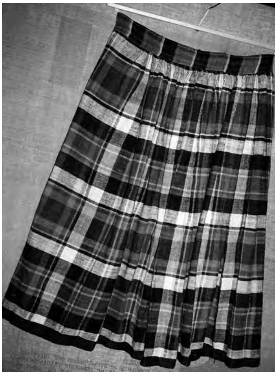
Спідниця, 1950 рр. с. Полиці Старовижівського р-ну Волинської обл. Льон, полотняне тканиня. ВКМ. Д-1115.

лексів, строга ритмічність укладу таких смуг, неоднакових за насиченістю тону. Найчастіше цю ритмічність підкреслюють світліші контрастні – як до інших суміжних стрічок, так і до тла – широкі білі та жовті смуги. Тоненькі уточні прокидки у вигляді штрих-пунктирних ліній підтримують їх, збагачують та урізноманітнюють ритміку по вертикалі. Найбільш напружені кольорові сполуки, побудовані на контрасті теплих і холодних барв, зосереджені передусім біля поділка.