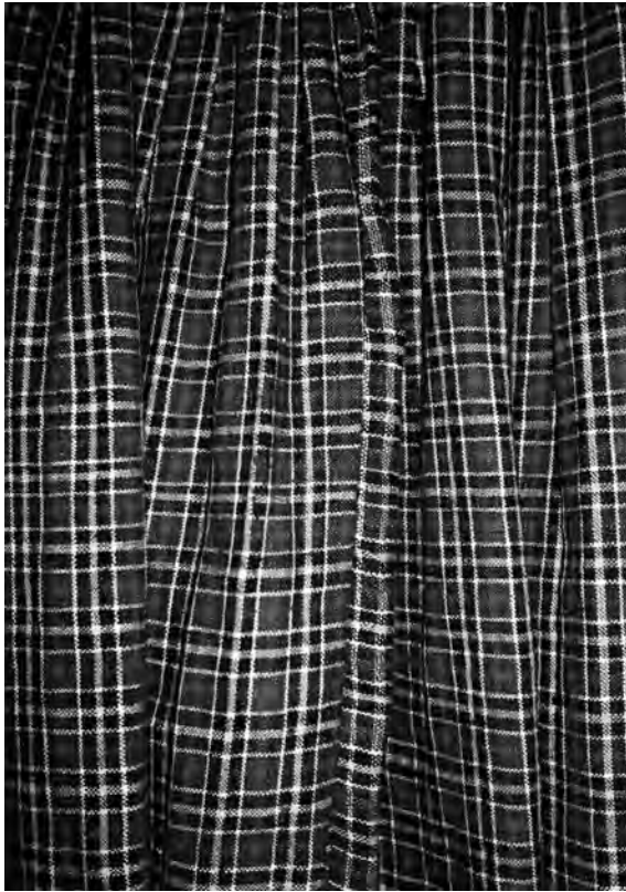
Спідниця, 1950-ті рр. с. Любохини Старовижівського р-ну Волинської обл. Льон, полотняне тканиня. ВКМ. Д-1041.