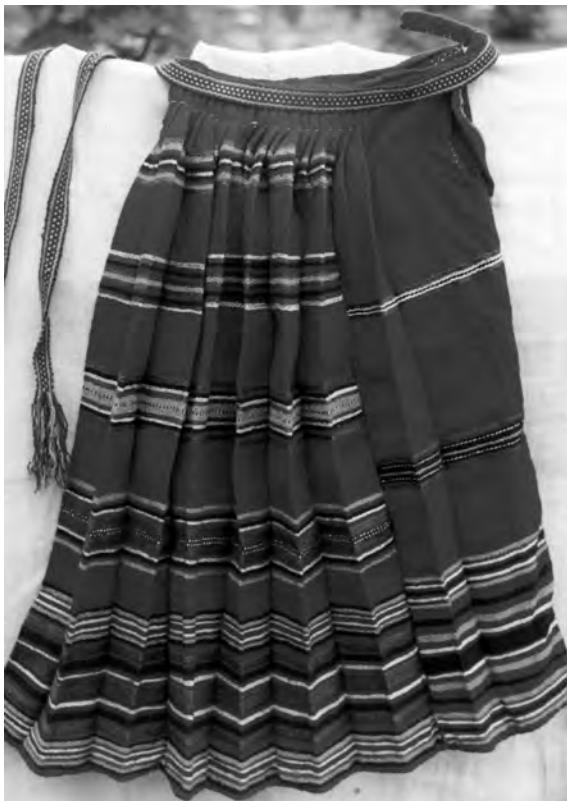
Спідниця "бурка", кін. XIX – поч. XX ст. с. Залісся Ратнівського р-ну Волинської обл. Льон, вовна; сатинове тканиня.

на відстані 8 см від подолу й акцентують доволі монотонну ритміку по вертикалі.