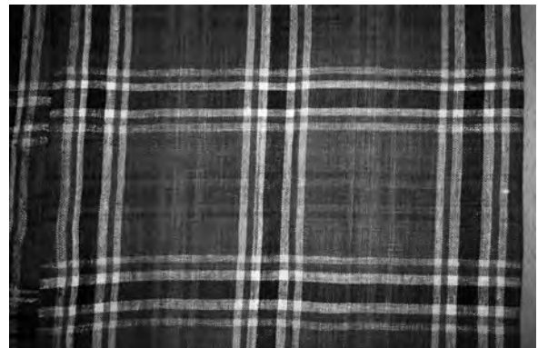
Спідниця (фрагмент), 1950-ті рр. с. Любохини Старовижівського р-ну Волинської обл. Льон, полотняне тканиня. ВКМ. Д-1040.