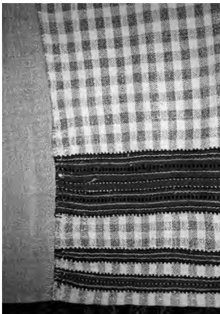
Спідниця (фрагмент), кін. XIX – поч. XX ст. с. Кримне Старовижівського р-ну Волинської обл. Льон, бавовна; полотняне, репсове й перебірне тканиня. Музей народної архітектури й побуту у Львові (далі – МНАПЛ). АП-13974.

ниці) й сприяла плавнішому переходу до нейтрального білого чи сіруватого фону.