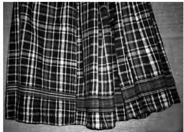
Спідниця (фрагмент). Автор Бідун Ганна Степанівна 1950-ті рр. с. Воропілля Камінь-Каширського р-ну Волинської обл. Льон, полотняне, репсове тканиня. ВКМ. Д-1087.