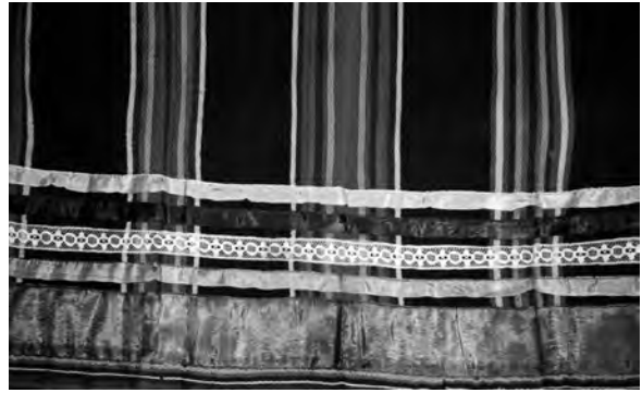
Спідниця (фрагмент), поч. ХХ ст. Автор Гоць Катерина Андріївна. с. Купичів Турійського р-ну Волинської обл. Льон, саржеве ткання. ВКМ. Д-300.

Характерною особливістю вовняних тканин полотняного переплетення, з яких шили “літники”, є рапортні композиції (величина рапортів коливається від 6-7 до 20-25 см). Типовою для них є симетричність укладу домінуючих і підпо-