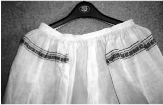
Спідниця “серпанкова” (фрагмент), кін. XIX – поч. XX ст. с. Берестя Дубровицького р-ну Рівненської обл. Льон, бавовна; полотняне й перебірне тканиня “під дошку”. МІГ. КН-6417.