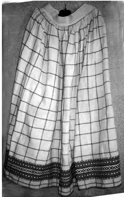
Спідниця “літник”, кін. XIX – поч. XX ст. с. Воронкомле Камінь-Каширського р-ну Волинської обл. Полотняне, репсове й перебірне ткання. МІГ. КН-1021.

Інший тип композиції щільних тканин для спідниць складають білі поперечносмугасті з домінуючою червоною площиною геометричного орнаменту, розташованого на поділці спідниці. На відміну від попередніх біле тло і тонкі сірі трип'ятидільні смужки (рапорт 4-5 см) ткали саржевим переплетенням, внаслідок чого отримували товстіше дрібновзористе полотнище у вигляді горизонтально спрямованих вправо і вліво “сосенок”, які позмінно чергуються. Виразності форм геометричних мотивів та активності звучання