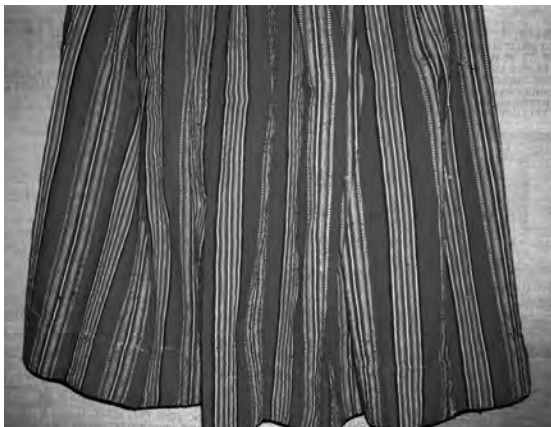
Спідниця “літник”, 1920-ті рр. с. Кухли Меневицького р-ну. Льон, вовна; полотняне ткання. ВКМ. Д-930.