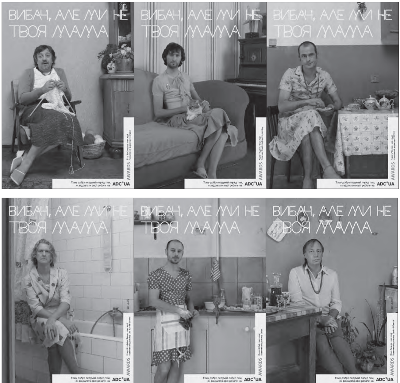
Рекламна кампанія для підтримки конкурсу «Art Directors Club Awards» в Україні.

існувати як самостійна одиниця композиції без підтримки текстової, яка повинна була пояснити присутність образу акторки. Тому поставлене завдання не виконано.