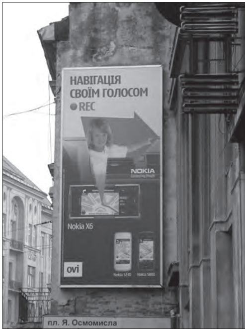
Фотографічне зображення у рекламі мобільного телефону «Nokia»

ним є візуальне розуміння, як специфічний вид мисленнєвої діяльності. Зміст такої діяльності полягає у маніпулюванні зоровими образами і створення нової реальності [18, с. 391—433].