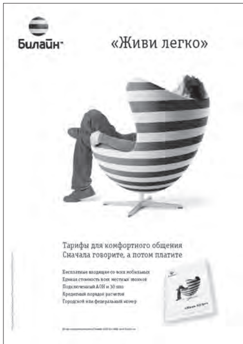
Реклама мобільного оператора «Beeline»