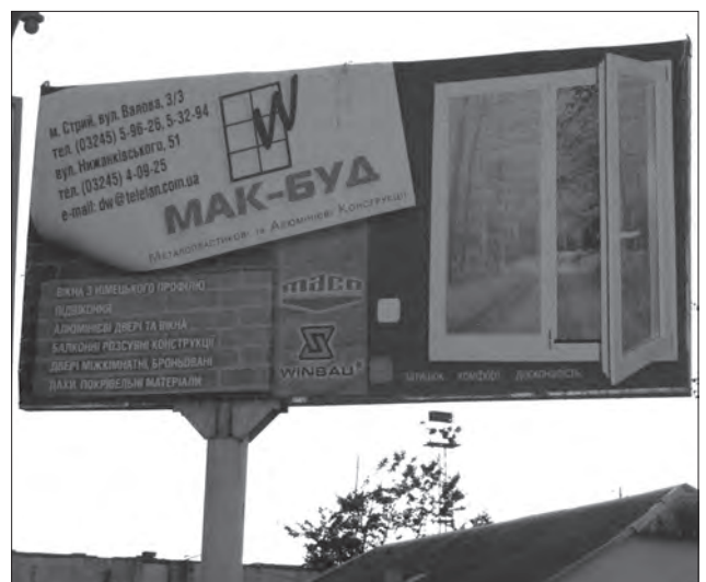
Рекламна компанія «Макбуд»