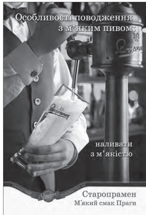
Рекламна компанія пива «Staropramen»

правило «лівої руки», за умовами якого представники західних країн розглядають зображення з лівого верхнього кута, натомість, жителі Близького Сходу — із права на ліво [24].