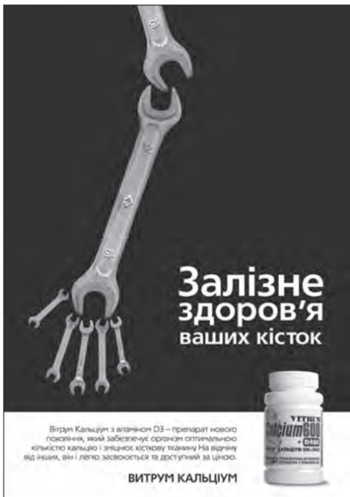
Рекламне повідомлення ліків «Вітрум кальціум»