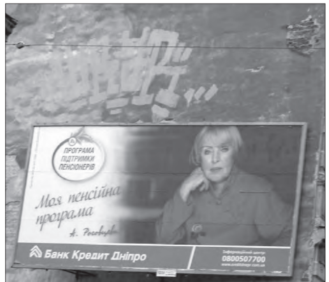
Рекламне повідомлення для банку «Кредит Дніпро»