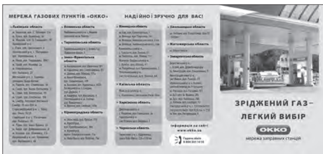
Буклет з рекламою зрідженого газу від мережі автозаправних комплексів «ОККО»

тецтві реклами. Значення зображення у рекламному повідомленні відіграє важливу роль. На думку О. Назайкіна, реакція людини на візуальний компонент є сильнішою, ніж на слово. Людина влаштована таким чином, що швидше реагує на зображення предмета, ніж на текст, який використовують для його позначення [15]. Автор книг про фотографію В. Шнейдеров підкреслює, що використання зображення полегшує процедуру переходу символу у образ. На думку науковців перегляди рекламних повідомлень викликають емоції, переживання, які спонукають споживача шукати рекламований товар. Отже, мета візуальних засо-