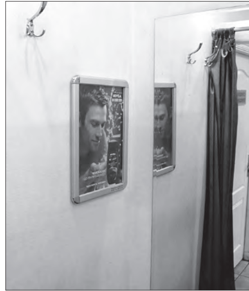
Реклама бальзаму після гоління і гелю для душу із серії косметики «Nivea for Men»

міщено текст. Проблема полягає у неправильній організації елементів, відсутність акценту у композиції, зв'язку між візуальною і текстовою частинами.