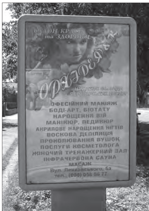
Реклама салону краси та здоров'я «Орхідея & К»