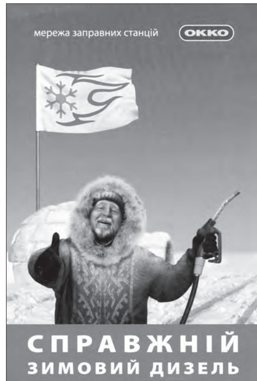
Фотографічний образ для реклами зимового пального А-95 від мережі автозаправних комплексів «ОККО»

тецтві реклами. Значення зображення у рекламному повідомленні відіграє важливу роль. На думку О. Назайкіна, реакція людини на візуальний компонент є сильнішою, ніж на слово. Людина влаштована таким чином, що швидше реагує на зображення предмета, ніж на текст, який використовують для його позначення [15]. Автор книг про фотографію В. Шнейдеров підкреслює, що використання зображення полегшує процедуру переходу символу у образ. На думку науковців перегляди рекламних повідомлень викликають емоції, переживання, які спонукають споживача шукати рекламований товар. Отже, мета візуальних засо-