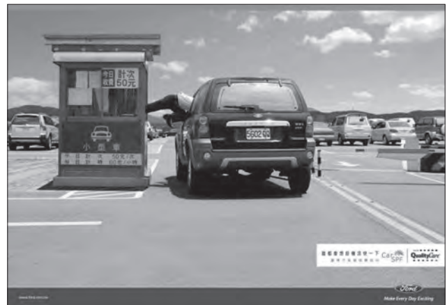
Рекламні компанії від «Volkswagen Caddy» і «Ford»

фічні програми для фотографа є корисні, однак не основні. Він підкреслює, що ретушування існувало у минулому і принцип роботи не відрізняється від сучасного редагування [11, 4]. Насправді жодному фотографу не буде складно створювати шедеври за допомогою будь-яких засобів. Рікардо Бусі вважає, що справжнє мистецтво не залежить від технічних можливостей. Розвиток інформаційних і цифрових технологій у ХХ столітті вплинув на появу нового розуміння і підходу до сучасного мистецтва фотографії. Він спонукає фотографів до експериментів з комп'ютерними технологіями.