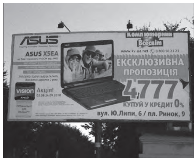
Реклама мережі магазинів комп'ютерної та цифрової техніки «Комп'ютерний Всесвіт»

Photo Studio», та багато інших. Окрім галузі реклами їхні технічні можливості активно використовуються у наукових дослідженнях, у медицині. Сьогодні фотографи завдяки можливостям таких програмних редакторів створюють цілі композиції, колажі, які вражають професійністю, особливо у ре- ISSN 1028-5091. Народознавчі зошити. № 5 (101), 2011