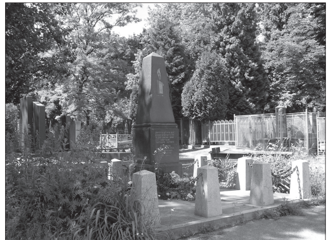
Гранітний обеліск біля входу від вул. Єрошенка

верт Глятстайн виконав проект обгородження цього кладовища [7, арк. 118; 8, арк. 8].