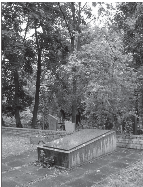
Пам'ятник жертвам Голокосту

В 1960—1970-х рр. було знищено переважну більшість вцілілих надгробків довоєнних єврейських поховань. Найстарший надгробок, який уцілів до наших днів, датується 1914 р.