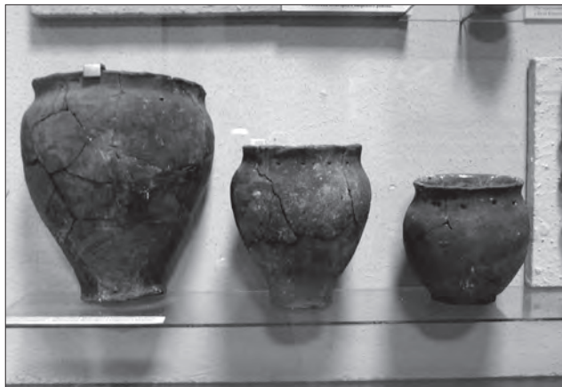
Посудини епохи бронзи. Глина, ліплення, теракота. с. Кудлаївка Новгород-Сіверського р-ну Чернігівської обл. Друга пол. III — поч. I тис. до н. е. Чернігівський обласний історичний музей ім. В. Тарновського. Експозиція

вишуканістю форм. Їх оздоблювали рельєфом і штампованими візерунками у вигляді кружалець, трикутників, ромбів тощо. Це, в основному, кухонний і столовий посуд (горщики, глечики з однією чи двома ручками, миски з ребром, баньки і баклажки), а також ритуальні посудини, які виготовляли з особливою ретельністю та оздоблювали загадковими мотивами-символами. На думку дослідника Б.О. Рибаківа таємничі знаки на чаші з Лепесівки та глечики з Ромашівки є не просто прикрасами, а найдавнішим східнослов'янським календарем, що містить основні місяці хліборобського циклу [23, с. 77—80].