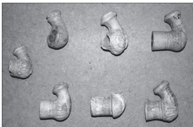
Люльки. Глина, відтискання у формі, теракота, с. Струсів Тербовлянського р-ну Тернопільської обл. XVIII ст. Тернопільський обласний краєзнавчий музей

чарні осередки Василькова, Дибинців, Білої Церкви, Чернігова, Батурина, Переяслава та ін. задовольняли посудом бідних ремісників та селян. Їх вироби були простішими й дешевшими, розписані кольоровими ангобами.