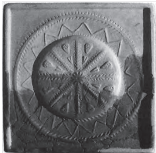
Кахля. Глина, відтискання у формі, теракота, с. Підгороддя Івано-Франківської обл. XVI ст. МЕХП. ЕП 83871