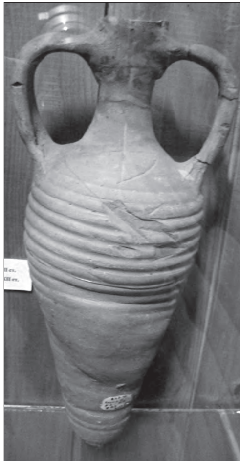
Візантійська амфора. Глина, гончарний круг, теракота. Із розкопок Новгород-Сіверського городища Чернігівської обл. XI—XII ст. Чернігівський обласний історичний музей ім. В. Тарновського. Експозиція

У XVIII ст. у зв'язку із поширенням фаянсових мануфактур в Україні простий неполив'яний посуд вживали переважно селяни і малозаможні прошарки міського населення. Більшим попитом нерідко користувалися привозні вироби, що відрізнялися від місцевих кращою якістю і багатством розписів. Ці умови примушували гончарів вдосконалювати ремісничу майстерність, так як від цього залежав їх добробут. Можливо, саме тому у XVIII ст. починають застосовувати веретенний ножний гончарний круг з рухомою віссю без шпидь, який протягом XIX ст. повністю витіснив так званий шленський (шпицевий). Асортимент виробів розширюється — з'являються вазони та носатки — посуд, який крім отвору для наливання рідини має ще додатковий для виливання.