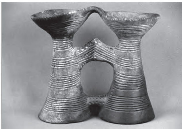
Біноклеподібна посудина. Глина, ліплення, ритування, теракота. Трипільська культура. IV—III тис. до н. е. Археологічний музей Інституту археології НАН України