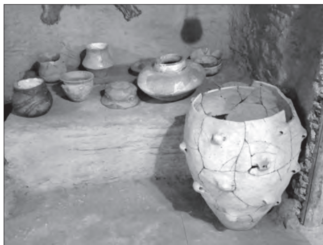
Глиняний посуд трипільців. Глина, ліплення, теракота. Трипільська культура. IV—III тис. до н. е. Тернопільський обласний краєзнавчий музей. Експозиція