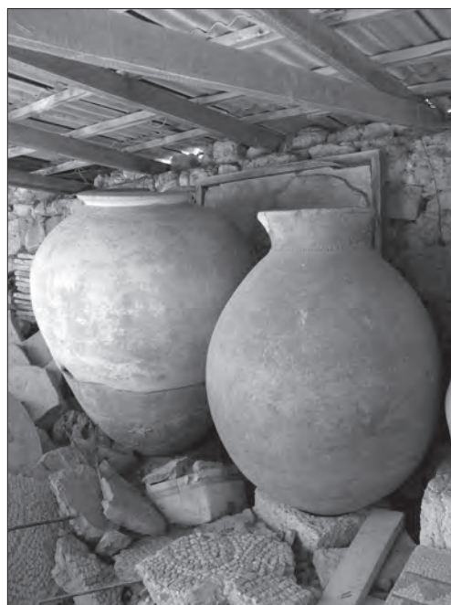
Античні амфори. Глина, гончарний круг, теракота. Друга пол. I тис. до н. е. Національний заповідник «Херсонес Таврійський», м. Севастополь.

же зникають вертикальні елементи. Нова технологія виробництва стала передумовою нової техніки оздоблення, що передбачала швидкий розпис сирого, ще не зрізаного з круга предмета. Податливі стінки горщика вкривали витискуванням за допомогою штампика-кілочка, орнаментального валика чи зубчатого коліщатка простих мотивів: смужок, зірочок, кружалець з промінчиками, зубчиками, кривульками, листочками тощо.