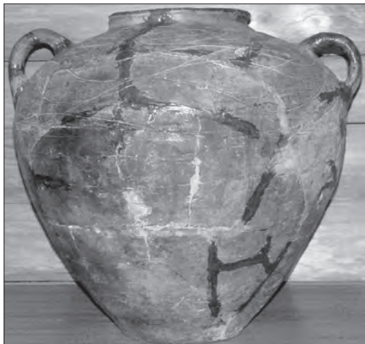
Корчага. Глина, гончарний круг, теракота. Із розкопок в м. Любечі Чернігівської обл. XI—XII ст. Чернігівський обласний історичний музей ім. В. Тарновського. Експозиція