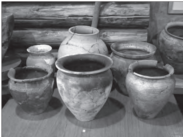
Посуд давньоруського періоду. Глина, гончарний круг, теракота. X—XIII ст. Тернопільський обласний краєзнавчий музей. Експозиція