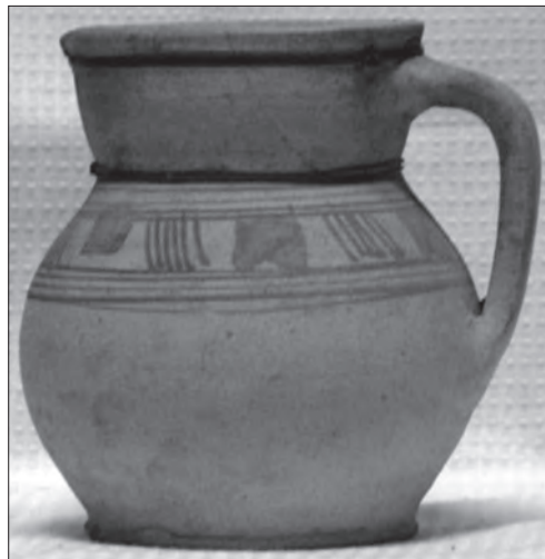
Дзбанок. Глина, гончарний круг, «описка», теракота, с. Рахманів Шумського р-ну Тернопільської обл. Кін. XIX ст. Тернопільський обласний краєзнавчий музей. СКФ-346 КН 19275

У XIX ст. в Україні кожен район гончарного промислу мав власні художні особливості виробів, які залежали від природних якостей матеріалів, технологічного рівня виробництва, локальних традицій тощо. Майже кожен осередок представлений провідними майстрами з яскравою творчою індивідуальністю. Було багато центрів, у яких поруч з полив'яними виробами виготовляли і неполив'яний керамічний посуд: Канів на Черкащині, Миколаїв на Львівщині, Микулинці на Тернопільщині, Бар на Вінничині, але були й такі, що спеціалізувались лише на виготовленні теракотової кераміки, наприклад, Кульчин на Волині, Шпиколоси, на Львівщині, Гуда та Драгове на Закарпатті, Плахтянка на Київщині, Городище й Хомуць на Полтавщині, та інші [27, с. 199]. Занепад гончарного ремесла спостерігається на межі XIX—XX ст., коли глиняні вироби все більше витісняє фаянсовий, порцеляновий та металевий посуд. Прагнучи витримати цю конкуренцію, деякі ремісники зі старих гончарних центрів досягли високого рівня майстерності.