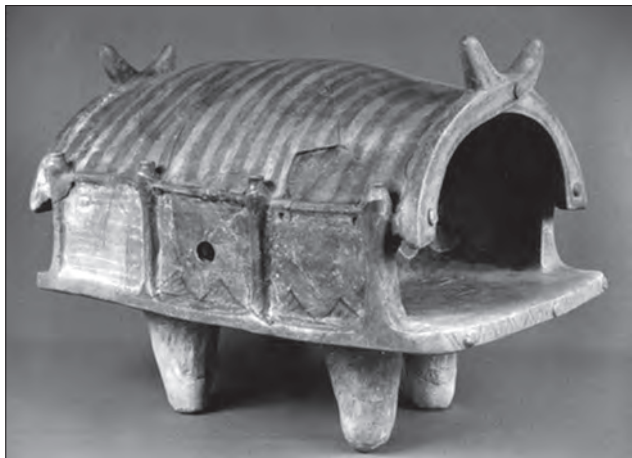
Модель глиняної будівлі. Глина, ліплення, мінеральні фарби, розпис, теракота. Трипільська культура. IV—III тис. до н. е. Археологічний музей Інституту археології НАН України

рігання харчових припасів, води, молока тощо. Окремо був посуд для культових церемоній: зооморфні та антропоморфні посудини, «моноклі» й «біноклі» тощо [4, с. 51].