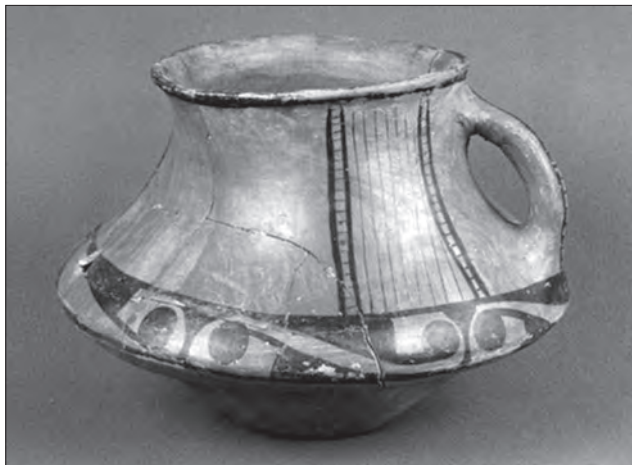
Кубок. Глина, ліплення, мінеральні фарби, розпис, теракота. Трипільська культура. IV—III тис. до н. е. Археологічний музей Інституту археології НАН України