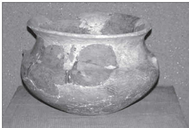
Горщик ранньозалізного часу. Глина, ліплення, теракота. Тернопільщина. VII—VI ст. до н. е. Тернопільський обласний краєзнавчий музей. А 3319