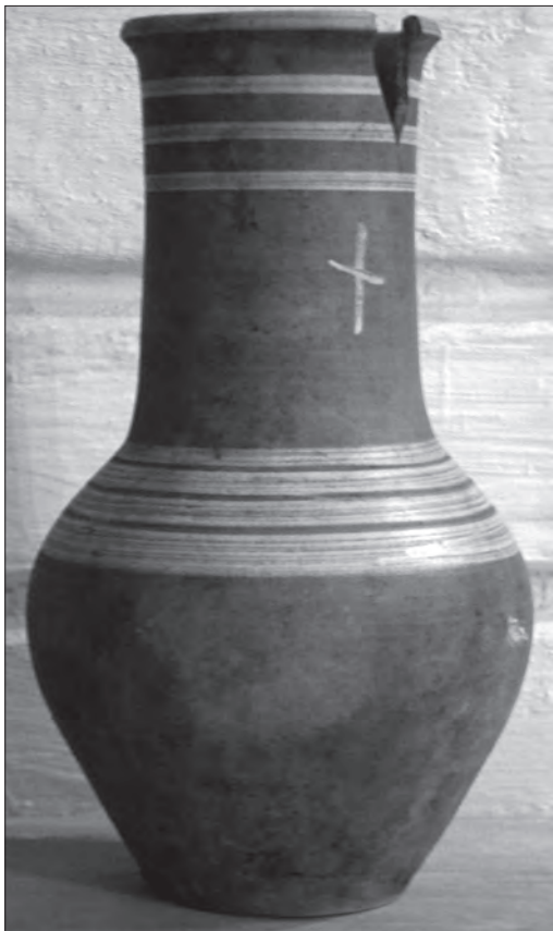
Глечик з хрестиком. Глина, гончарний круг, «описка», теракота. Чернігівщина. Поч. XX ст. Чернігівський обласний історичний музей ім. В. Тарновського. ЧІМ-И-6060