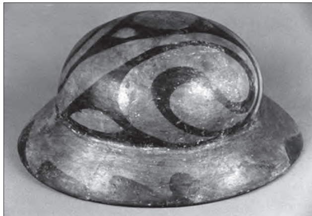
Шоломоподібна накривка. Глина, ліплення, мінеральні фарби, розпис, теракота. Трипільська культура. IV—III тис. до н. е. Археологічний музей Інституту археології НАН України

Серед культур пізньоримського часу особливо високим художнім рівнем відзначається поруч із димленою і теракотова кераміка Черняхівської культури (II—V ст. н. е.). Прогресивний вплив на розвиток гончарства здійснила поява ручного гончарного круга. Посудини, створені на гончарному крузі, відзначалися тонким черепком, а також багатством і ISSN 1028-5091. Народознавчі зошити. № 3 (105), 2012