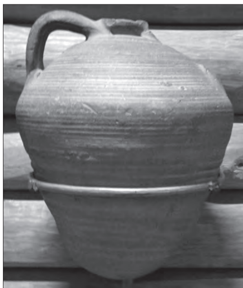
Давньоруська посудина. Глина, гончарний круг, теракота. XI ст. Чернігівський обласний історичний музей ім. В. Тарновського. Експозиція

XVI ст.), мископодібні — на галицько-волинських землях (друга пол. XV—XVI ст.), на київських, чернігово-сіверських (початок XVI—XVII ст.) [11, с. 76]. На зламі XV—XVI ст. в Україні з'являються ранні плиткові кахлі — рельєфні, теракотові [11, с. 94]. Декор ранніх плиткових кахель — рельєф, що є завершеною композицією, замкненою у межах однієї плитки. Природна шорстка фактура неполив'яного черепка м'яко підкреслює гру світла й тіні рельєфних орнаментів. Усі кахлі XV — початку XVI ст. — теракотові, а вкриті зеленою поливою переважно відносять до привізної кераміки [11, с. 89].