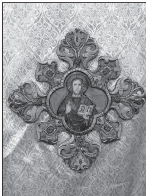
Хрест з фелону, кін. ХІХ — поч. ХХ ст. зі с. Терло (Старосамбірський р-н Львівська обл.)

Складніша композиційна структура «розквітлого» хреста — з клиновидними раменами (в завитках аканту), потрійними променями в кутах та восьмипелюстковою розеткою на середохресті, позначена стилістикою бароко. Її помічаємо на продукції спілки «Достави» — однотонних оксамитових облаченнях 1910-х рр., наприклад, з львівських сіл — Кизлів, Красів, Надиби 19 . Іншу, сецесійну стилістику демонструє хрест з променями поховального фелону з Кутища 20 на По-