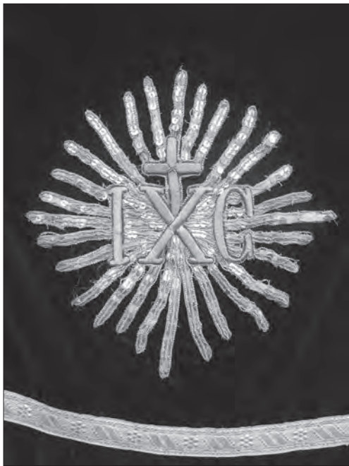
Хрест-звіздиця з фелону т-ва «Ризниця», поч. ХХ ст. зі с. Терло (Старосамбірський р-н, Львівська обл.)

ні промислових тканин впливають тогочасні західно-європейські художні течії. В означений період у тканинах домінує рослинний орнамент, який у сецесії активно стилізується. Дещо особіно в масиві візерункових тканин розвивається тип матерій з сакральною символікою і християнською тематикою, які хоч і виготовлялися на замовлення галицьких клієнтів у західноєвропейських центрах літургійного ткацтва, все ж перебували під впливом католицької іконографії.