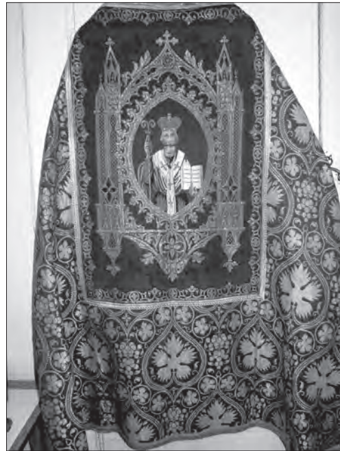
Фелон 1880-1890-х рр., с. Нагірці (Кам'янка-Буський р-н, Львівська обл.), фонди ЛМІР, ТК-929/1

Унікальним випадком серед виявлених пам'яток галицької параментики є використання тканин з візерунком гротесків — дивовижне поєднання рослинних мотивів, фантастичних птахів та архітектурних деталей. На вертикальну вісь нанизані більші-менші букети (вниз голівками) з півоній, квітучих гілок і округлих плодів, півсферична люстра з підвісними еле-