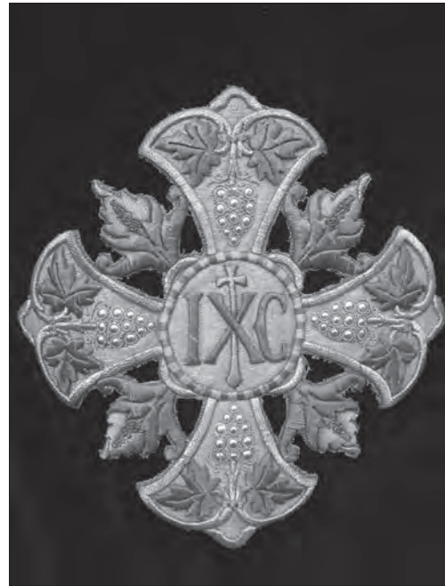
Хрест з фелону т-ва «Ризниця», поч. ХХ ст. зі с. Трушевичі (Старосамбірський р-н, Львівська обл.)

Візуально відмінний, але створений подібними композиційними прийомами і манерою орнаменталізації іконографічний сюжет «Добрий Пастир» з білого фелона с. Раковець [14]. Зображення фігури не розходиться з прийнятою іконографією: Христос-Пастир представлений у повний зріст, з посохом у