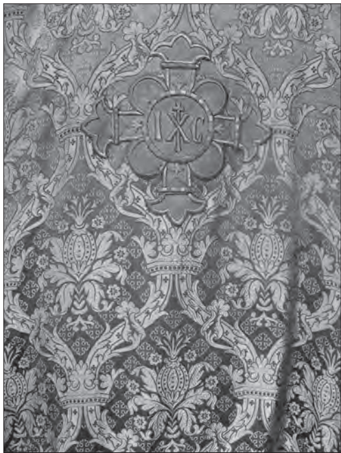
Фелон т-ва «Достава», поч. ХХ ст. зі с. Старява (Старо-самбірський р-н, Львівська обл.)

турного життя північно-східних провінцій імперії, якими були галицькі землі, нові естетичні пріоритети не встигали виробитися у рамках однієї стилістики. Тому кожен з означених періодів мав певну тяглість: при домінуванні генеральної мистецької ідеї одночасно існували протилежні тенденції, породжені індивідуальним почерком окремої майстерні та кон'юктурою ринку.