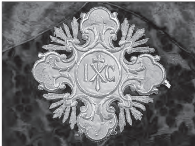
Хрест з фелону т-ва «Ризниця», поч. ХХ ст., с. Бистриця (Дрогобицький р-н, Львівська обл.), фонди ЛМІР, ТК-1019/1

тиці (надбанні і напестольні хрести, літургійний посуд). Розвиток стилю проходить в кожному виді церковного мистецтва майже синхронно: «розквітлі» барокові хрестові форми, з'явившись в дереві та металопластиці отримують вторинну інтерпретацію у літургійному шитві. Згодом стилістика модерну, проникнувши з гравюри у текстильний візерунок, починає визначати художню мову гаптованих оздоб.