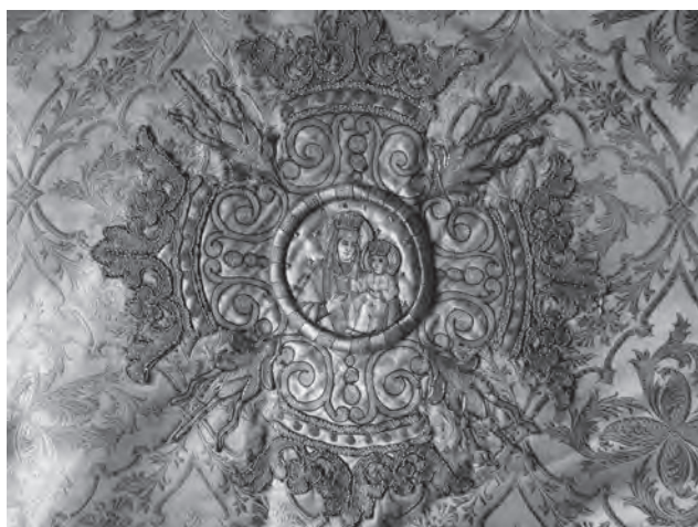
Хрест з фелону т-ва «Достава», поч. XX ст. (Рогатинщина, фонди ІФХМ-0-765)

ся, витончуються і, найосновніше, набирають нижніх нюансних барв.