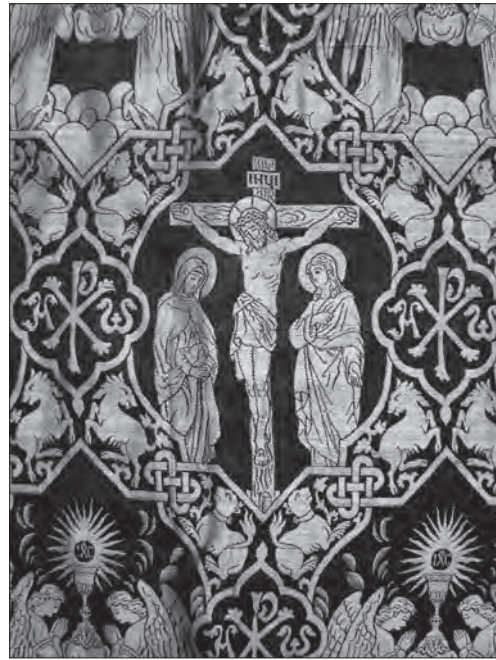
Тканина фелону т-ва «Ризниця», поч. ХХ ст., с. Старий Витків (Радехівський р-н, Львівська обл.), фонди ЛМІР, ТК-77/1

Для розрізнення аналогічних виробів різних фірм були введені обов'язкові при виробництві спеціальні охоронні марки. У Галичині, як і на всій території Австро-Угорської імперії, вони були узаконені царським указом від 1880 року. Охоронною маркою вважався так званий підпис підприємства у вигляді повної його назви, умовного скорочення, абрєвіатури чи графічного знака (як, наприклад, нашивки на священничих шатах «Товариства Ризниці в Самборі» чи «Достави»).