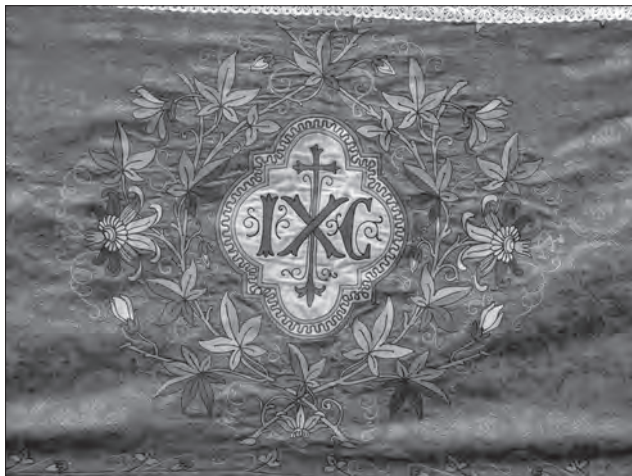
Шал для суплікації т-ва «Ризниця», 1910-ті рр., с. Княжпіль (Старосамбірський р-н, Львівська обл.)