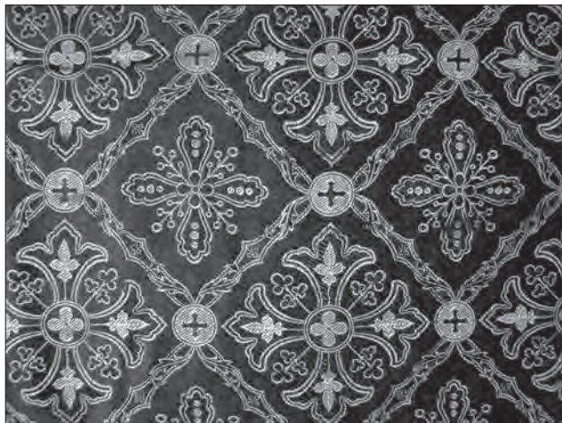
Тканина фелону поч. ХХ ст. зі с. Вислобоки (Кам'яно-Буський р-н, Львівська обл.), фонди ЛМІР, ТК-932

підпорядкований сітчастій ритмічній будові орнаменту. Крім того, гранат набирає інших морфологічних ознак і видозмінюється подібною формою — цвітом чортополоха або ріп'яха, екзотичним плодом, наприклад ананаса тощо.