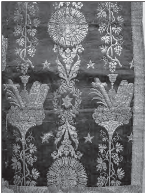
Воздух, ост. чв. XIX ст., с. Повергів (Миколаївський р-н, Львівська обл.), фонди ЛМІР, ТК-1132/5

В контексті заявленої проблеми поняття «галицька параментика» охоплює тканинні літургійно-обрядові атрибути, які затрималися в Українській Церкві (головно греко-католицького обряду) з середини XIX — до середини XX ст., а саме: облачення духовних осіб (головним чином священниче — стихар, фелон, епитрахиль, поручі, пояс), сакральні покрови (покрівці і воздухи, суконки на дарохранительниці, покрови Св. Престолу), церковно-обрядові вироби (процесійні — плащаниці, хоругви, фани, шалі, бурси; завіси — катапетасми, антипедіуми, покрови аналоя, тетраподу тощо). Більшість цих атрибутів шили та декорували місцеві ремісники — кравці та гаптярі, рідше в Галичину потрапляли вони у готовому вигляді. Промислові тканини та позументну фурнітуру часто стійно завозили з інших країн (переважно європейських центрів параментики) і вже на місці майстри виконували гапти та оздоблювальні роботи згідно з традиціями візантійського літургійного обряду. Більш організована форма праці була налагоджена наприкінці XIX — третині XX ст. у лаврських чернечих майстернях та робітнях українських священничих спілок («Ризниця» і «Достава»).