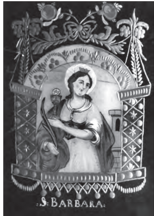
Іл. 1. Св. Варвара. Кін. XVIII — поч. XIX ст., скло, розпис, різьблення, позолота, 27,5 x 19,5 см. Північна Чехія. Музей Младоболеславска в Младе Болеславі (Чехія), № S 3445

За характером побудови твори, виконані в майстернях країн Центральної та Східної Європи, поділяються на два великі блоки — в картушах і з повноформатним сюжетним заповненням. Образи в картушах — це окремий тип, поширений у країнах з традицією гутного оздоблення листового скла [4, с. 54]. У кін. XVIII — сер. XIX ст. в Австрії, Баварії, Сілезії та Чехії при створенні картин на склі застосовували механічну та хімічну обробку площин 1 . З допомогою технік гравіювання, різьблення, матування, посріблення майстри вибудовували художнє обрамлення, що розмежовувало зображення і тло. Розрізняємо декілька видів картушів, один з яких — архітектурний (сцена обмежена колонами й аркою, іл. 1). Стафаж опрацьований декоративною сіткою, об'єднаний рослинними елементами та завершений вгорі мальованими квітками. В цілому він має вигляд пишної рами з невеликим вкрапленням мальованих елементів. Розповсюдженим був рамковий овальний або круглий картуш. У колі розміщували малюнок, довкола нього імпровізували віньєткову композицію, що обов'язково була симетричною відносно централь-