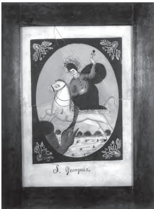
Іл. 4. Св. Юрій Змієборець. Друга пол. XIX ст., скло, розпис, позолота, 30 x 24 см. Габартов, Західна Чехія. Етнографічний відділ Народного музею в Празі, Чехія, № 1259/41

лі, а навколо нього фарбами (а не склярськими методами) відтворювали віньєтку.