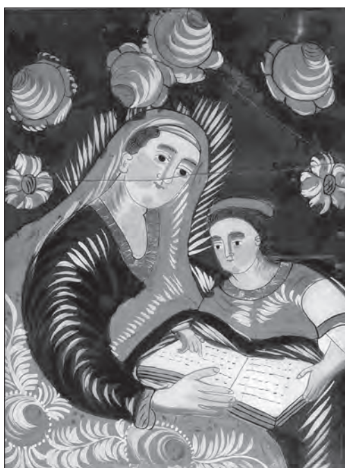
Іл. 16. Св. Анна навчає Марію. Др. пол. ХІХ ст., скло, розпис, 39 x 30 см. Польща (Східна Словаччина?), МЕХП, № 42675

225]. Маляр зацентрував увагу на декоративних елементах, надав їм домінуючий колір, а потім повторив це й же колір у мафорію Богородиці та накидках ангелів — таким чином весь твір пронизаний ритмічною однобарвною канвою, яка забезпечує єдність елементів. Зовсім інший структурно-