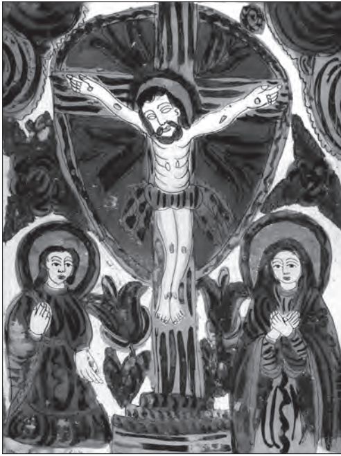
Іл. 19. Петро Німчик. Розп'яття з Пристоячими. Ост. трет. ХІХ ст., скло, розпис, позолота, 45,5 x 34 см. Івано-Франківська обл., Україна, Діацезійний музей у Тарнові, Польща, № 199/82