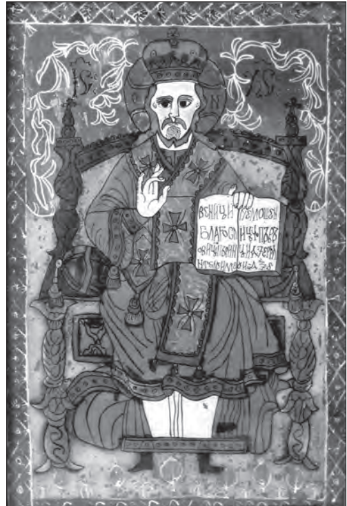
Іл. 9. Пантократор (Христос-Учитель). Поч. XIX ст., скло, розпис, позолота, 62,5 x 45 см. Ієрнуць, Румунія, прив. зб.

Найбільш численними є образи, на яких у повний зріст представлені патрони-охоронці. Знаковим для всіх осередків був св. Юрій Змієборець, якого малювали верхи на коні у двобой зі змієм. Цей сюжет порушує принципи статичності, оскільки вершника представляли в русі з динамічно розвіяною накидкою. Ретельно копіювали підклади у майстернях західного ареалу — у Чехії малярі дотримувались реальних