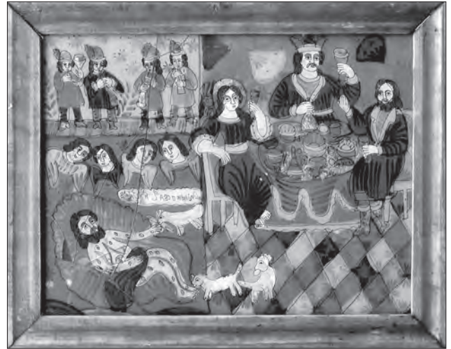
Іл. 21. Притча про багача і бідного Лазаря. Ост. чв. XIX ст., скло, розпис, позолота, 33,5 x 44 см. Івано-Франківська обл., Україна, прив. зб.

ISSN 1028-5091. Народознавчі зошити. № 4 (106), 2012