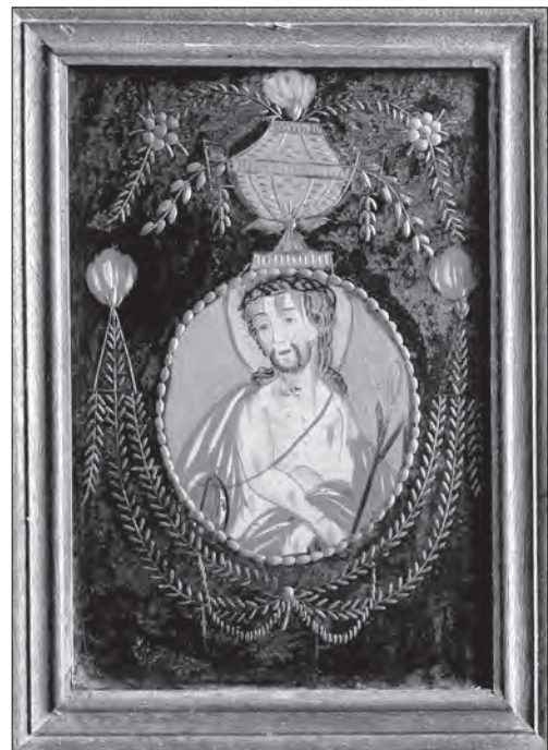
Іл. 2. Ессе Ното (Це Людина). Перша пол. XIX ст., скло, розпис, ритування, 28,5 x 19,5 см. Нижня Сілезія. НМЛ, інв. 49067, I-3464

ної вертикальної осі (іл. 2). Задля спрощення технологічного процесу інколи застосовували мальований (імітаційний) картуш. Зображення виконували в ова-