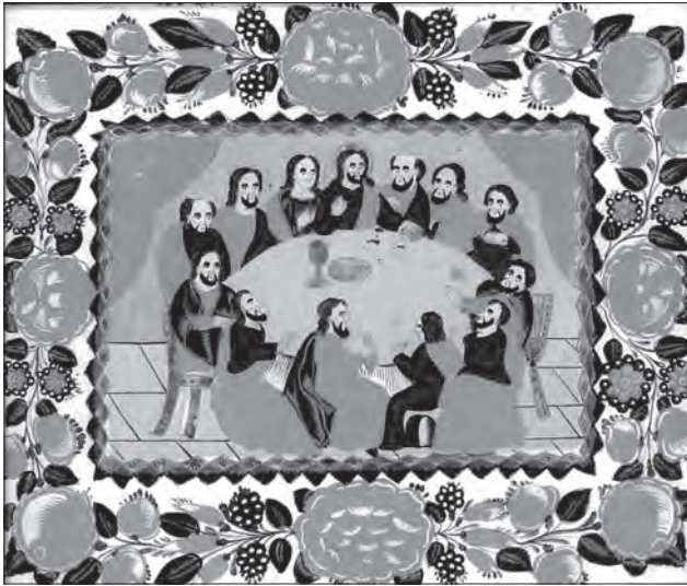
Іл. 23. Родина Туммаєр. Тайна Вечеря. 1830 р., скло, розпис, позолота, 44 x 50 см. Сандл, Австрія, прив. зб.

по всьому периметру скла. Теми, представлені у супроводі розписаних декоративних бордюрів, справляють цілісне враження, натомість в іконах із застосуванням склярських технік бракує композиційної єдності — на площині окремо співіснують сюжет, декоративне обрамлення і тло.