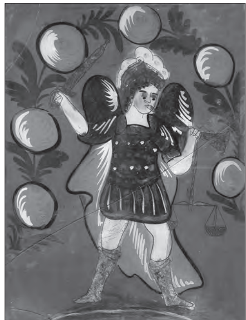
Іл. 14. Архангел Михаїл. Друга пол. XIX ст., скло, розпис, 43 x 32 см. Польща (Північна Словаччина?), МЄХП, № 42675

косими лініями), канатовидними, рослинними (неперервний фризний квітковий орнамент), геометричними (зигзагоподібний, ромбовидний тощо) мотивами. Деякі з образів несподівано лаконічні та неповторні — наприклад, Богородиця Одигтрія з Брашова, обрамлена бордюром з масивного червоного трилистника на білому тлі [7, с. 152, 154, 156,