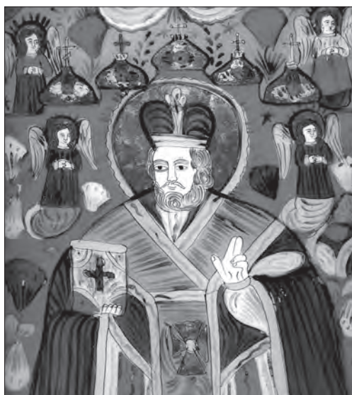
Іл. 8. Св. Миколай. Остання чв. XIX ст., скло, розпис, позолота, 50,5 x 54,5 см. Покуття, Україна; прив. зб.

У східному ареалі більшість святих охоронців відтворювали покоління. В Україні таким чином зображували Миколая, Варвару, Параскеву, Михаїла, Івана Непомука. У верхніх кутах твору малювали ангелів, або замість них — драперії, галузки квітів. Прикладом складного декоративного доповнення сюжету є образ, на якому св. Миколай оточений чотирма ангелами і церковними банями (іл. 8).