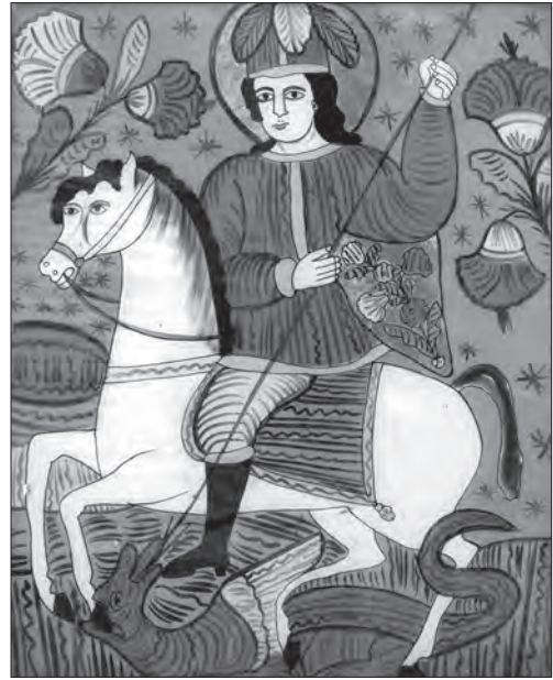
Іл. 13. Св. Юрій Змієборець. Кін. XIX — перша трет. XX ст., скло, розпис, позолота, 42 x 38 см. Чернівецька обл., Україна, прив. зб.

Румунські малярі, малюючи Богородицю за підкладом, також охоче видозмінювали орнаментальне наповнення. Вони часто декорували фон елементами геометричного або рослинного орнаменту. Важливим фактором були різні види рамок: овальні, волютоподібні, прямокутні чотиристоронні, трьохсторонні. Малярі розписували їх стрічковидними (наприклад, темна стрічка покреслена ритмічними