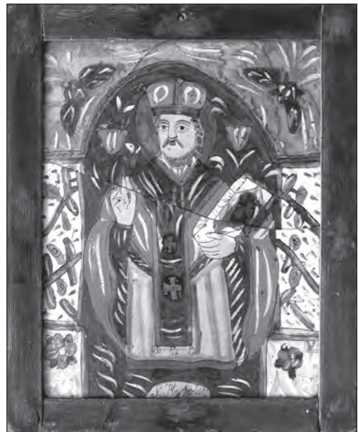
Іл. 10. Св. Миколай. Третя чв. XIX ст., скло, розпис, позолота, 46 x 36 см. Калуський р-н, Івано-Франківська обл., Україна, НМЛ, інв. 15420/1, І-578

співвідношень: вершник — кінь — змії та лінія горизонту (іл. 4). У Сандлі (Австрія) майстри частково переробляли шаблон, спрощуючи рисунок та додаючи декоративні елементи (дві масивні квіткові галузки) [9, с. 59]. Великий діапазон інтерпрета-