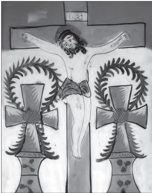
Іл. 12. Розп'яття. Друга пол. XIX ст., скло, розпис, позолота, 39 x 31 см. Східна Словаччина. МЕХП, № 42661