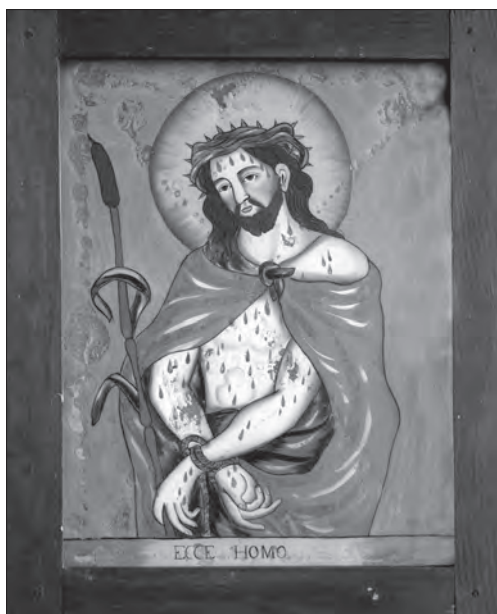
Іл. 7. Ессе Номо (Це Людина). Перша пол. XIX ст., скло, розпис, 36 x 26,5 см, НМЛ, інв. № 39680, І-275