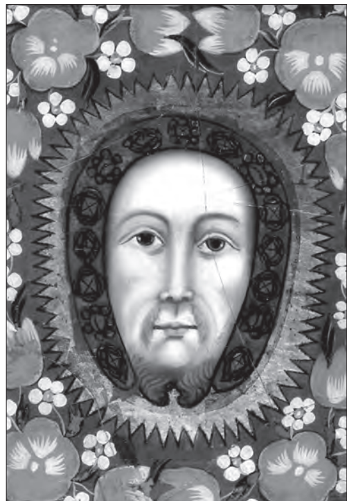
Іл. 6. «Veraikon» (Ісус Христос). Остання трет. XVIII ст., скло, розпис, позолота, 43,5 x 33 см. Чеська Сілезія; прив. зб.

гуцульськими квітами-розетками [2, с. 159]. Поряд з зазначеними темами у католицькій традиції побутувало погрудне зображення Ессе Ното ( Це Людина ), яке komponували в медальйоні (іл. 2), або на всьому склі [11, с. 154] (іл. 7).