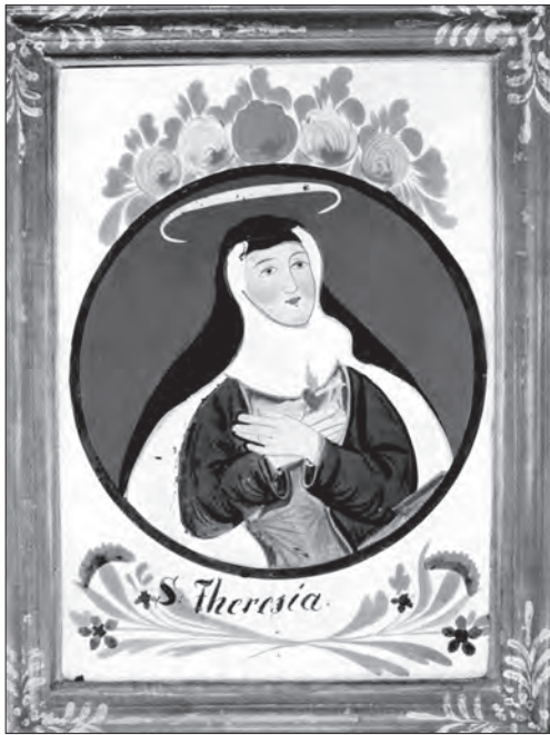
Іл. 3. Й. Мангольд. Св. Тереза. Сер. XIX ст., скло, розпис, позолота, 30 x 24 см. Обераммергау, Верхня Баварія; прив. зб.