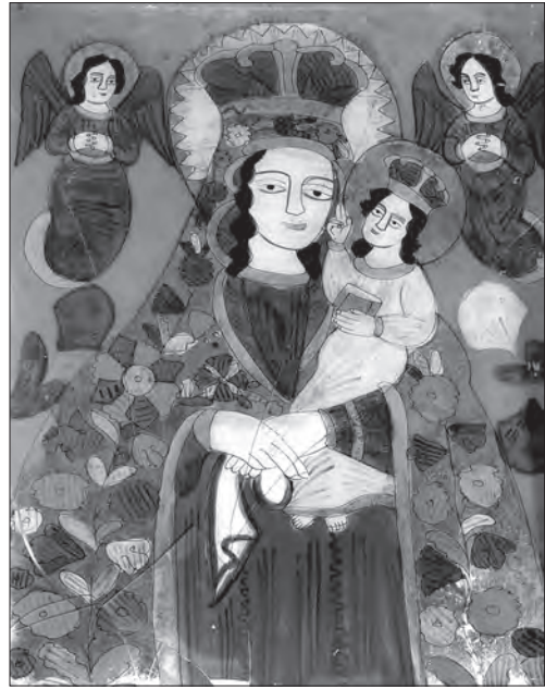
Іл. 17. Богородиця з Дитям Лежайська. Ост. чв. XIX ст., скло, розпис, позолота, 44 x 33 см. Покуття, Україна, прив. зб.

Широко розповсюдженою темою було Різдва Ісуса Христа , схематично-сюжетним центром якого повсюди було сповите Дитятко. Стафаж навколо