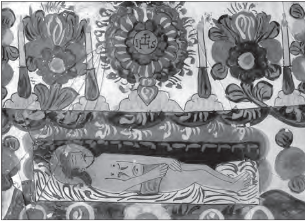
Іл. 11. Гріб Господній. Друга пол. XIX ст., скло, розпис, позолота, 44 x 35 см. Середня Словаччина, МЕХП, № 42637