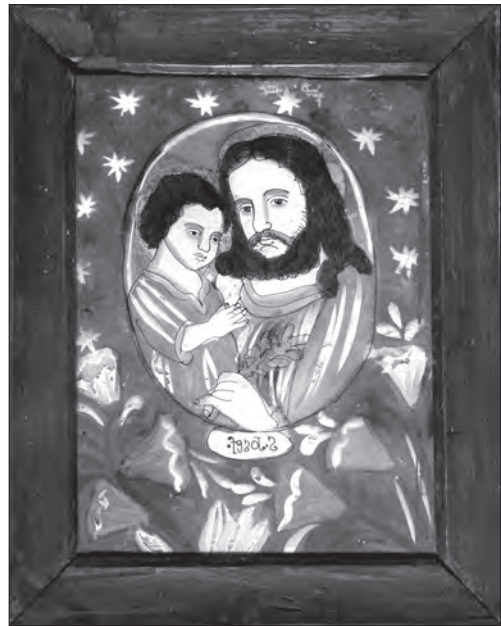
Іл. 5. Св. Йосип з Дитям. Третя чв. XIX ст., скло, розпис, позолота, 26 x 20 см. Покуття, Діацезійний музей в Тарнові, Польща

Наступний сюжет Ісус Христос та Іван Хреститель у дитячому віці , виконували за літографіями у двох варіантах: дитячі погруддя, завершені трояндовою гірляндою або символічними хмарками [2, с. 22]. Цю тему розглядаємо в категорії однофігурних, оскільки часто святих малювали поодиноч. Улюбленим мотивом був Ісус Христос, обрамлений трояндами. Інколи малярі видозмінювали контури, продовжуючи півфігуру одягом — особливо таку трансформацію любили українські майстри. На загал, вони значно вільніше поводитись з графічними підкладами і копіювали їх неохоче — на одному з покутських творів святі зображені не у дитячому, а в підлітковому віці, на іншому зразку півфігури обрамлені не трояндами, а