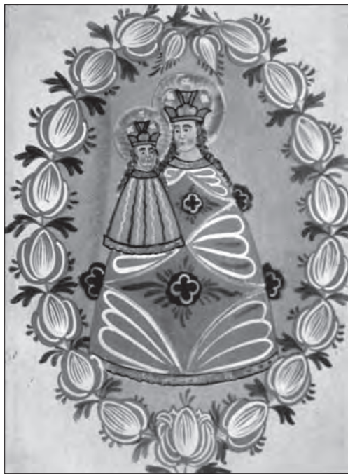
Іл. 15. Богородиця з Маріяццель. Др. пол. ХІХ ст., скло, розпис, 32 x 26 см. Сандл, Австрія, прив. зб.