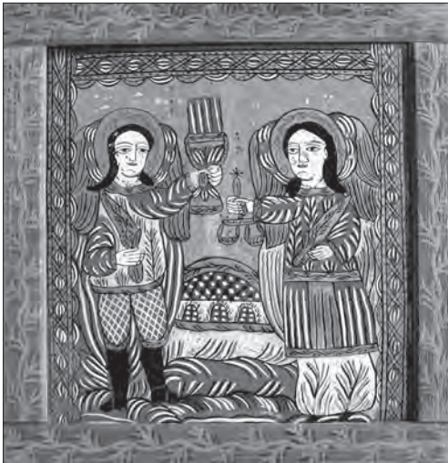
Іл. 20. Ана Дежі. Архангели Гавриїл і Михаїл. Початок ХІХ ст., скло, розпис, позолота, 54 x 48 см. Фегераш, Румунія. НМЛ, № 42078, І-2873

Приступаючи до розгляду багатофігурних ікон (відтворено більше трьох постатей), доречно зазначити, що в колекціях усіх країн (окрім Румунії) вони становлять меншість. Для кожного регіону знаковою була та чи інша тема — народні майстри засвоювали її зображення, після чого виконували різні варіанти. Так, для Моравії та Сілезії характерними були легендарні сюжети про Святих Геновеффу