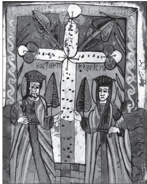
Іл. 18. Святі Константин та Олена. Др. пол. XIX ст., скло, розпис, позолота, 29 x 23 см. Румунія, прив. зб.

Ісуса вирішували: у вигляді міського пейзажу (Діва Марія та св. Йосип обабіч Дитятка на тлі шопки та інших будинків [9, с. 53]); як інтер'єрну сцену в картушево-архітектурному обрамленні [10, іл. 72]; на фоні сільського ландшафту, або в умовно-символічному просторі — на столі перед Марією та Йосипом лежить сповите Немовля, зворушливо огорнене двома галузками [7, с. 83—87].