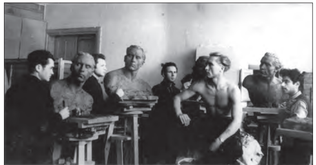
Робота студентів-скульпторів в матеріалі. Аудиторія в корпусі по вул. Дудаєва (колись Лермонтівка)

ся, що я до пояса в густому болоті броджу, і от-от берег» [8, с. 214].