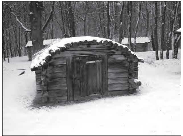
Суцільний накот. Київський національний музей народної архітектури

Окремої розмови заслуговують житлові споруди із так званою «горбатою» (чи аркуватою) стелею. За твердженням К. Мошинського подібний варіант стелі спорадично побутував на просторі північного Полісся від Дніпра аж до Прип'яті і Нарви [50, s. 127]. Дослідники вирізняють два (іноді три) типи такої стелі: трапецієподібну, трикутну [36, с. 20, 21; 45, s. 326, 327 (Рус. 17 с), 328] і п'ятикутну в перетині [32, с. 39]. Зокрема, трапецієподібну аркувату стелю зафіксував К. Мошинський у селах Турах та Вільшаній (Загориння) [50, s. 127], Велемчі під Давидгородком [51, s. 497]; З. Дмоховський — у Давидгородку [45, s. 327 (Рус. 17 d)], Овсемирові колишнього Столинського повіту [46, s. 198—199] (кожна з цих стель опиралася на п'ять сволоків). Стеля іншої хати, обстеженої останнім ученим у с. Хоромському, була трикутна у перекрої, з кутом при вершині 135^\circ (по трьох сволоках) [45, s. 327 (Рус. 17 с)]. Двосхилу (трикутну у перетині) форму (за К. Мошинським) мала стеля хати у с. Дружилевичах колишнього Дрогичинського повіту [51, s. 497]. Трапецієподібну стелю С. Таранушенко віднайшов у с. Седневі на Чернігівщині. Тут вона була настелена по чотирьох сво-