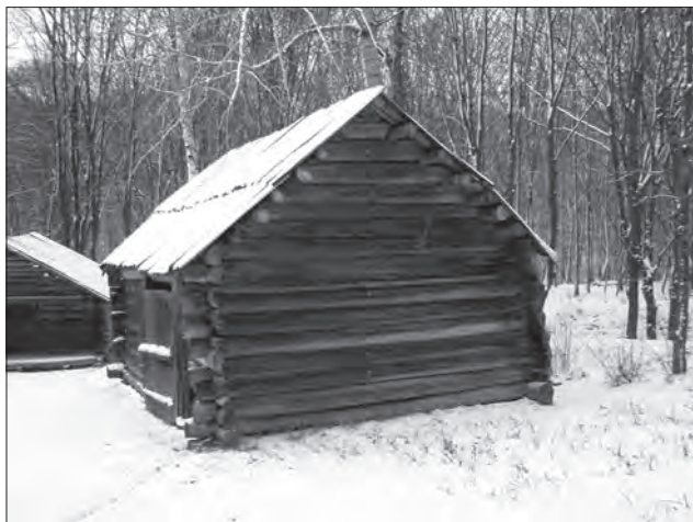
Розріджений накот. Київський національний музей народної архітектури