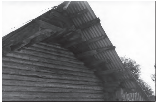
Розріджений накот комори (с. Левковичі Овруцького р-ну Житомирської обл.)

Повертаючись до житлових споруд, стеля яких суміщена з дахом, зазначимо, що при влаштуванні їх перекриття застосовували як і суцільний, так і розріджений накот. Використання останнього варіанту засвідчують житла, обстежені З. Дмоховським у селі Гродно [46, s. 193—197, 198 (Rys. 112); 45, s. 323, 324 (Rys. 15)]. Щодо перекриття жител суцільним накотом, то, на жаль, про його конструкцію на Поліссі маємо дуже скупі відомості. Описуючи курну хату, П. Чубинський зазначає, що «...стіни будують в зруб, вживають мохову прокладку... такий мох вживають і при спорудженні дахів, але тільки тоді, коли хата не має стелі» [41, с. 390]. Зважаючи на це повідомлення, С. Таранушенко дуже слушно уточнив, що «...імшать шпаруни і дерев'яного накота