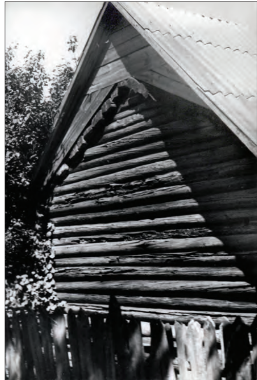
Суцільний накот комори (с. Левковичі Овруцького р-ну Житомирської обл.)

Зауважимо, що як і при трисхилому (хати Жовнерика і Мозоля зі с. Овсемирова), і двосхилому (хата Шелеста зі с. Гродна) перекритті, піднятий над останнім дах («кришу») могла підтримувати крокв'яна [45, с. 324 (Rys. 15 B); 47, с. 199 (Rys. 113), 200 (Rys. 114)], сошна [49, с. 320—329] чи напівсошна (подібно, як над поздовжньо-вінчатою коморою із с. Закусили Народицького р-ну [24, с. 94 (Рис. 9)]) конструкція. З. Дмоховський опублікував дещо відмінний спосіб вирішення конструкції покриття у трисхилому (хата Кузь-