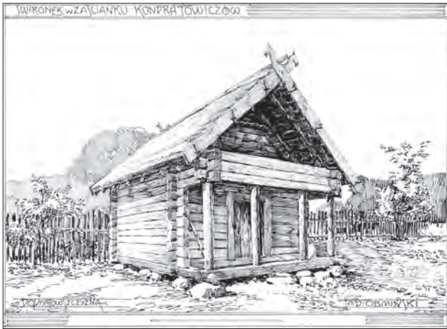
Свірон із трапецієподібною стелею (Білорусь). Малюнок Тадеуша Обмінського

спорудження трикутних вертикальних фронтонів і схилів між окремими поздовжніми вінцями останніх виникали щілини. Ілюстрацією найпростішого вирішення цієї проблеми є кліть із села Чудина [45, s. 326, 327 (Rys. 17 b)]: у кожен вінець щита врубували по два поздовжні елементи на кожному із схилів, що забезпечувало щільність накоту. Між собою усі поздовжні вінці припасовували за допомогою «драчки» (поздовжнього паза).