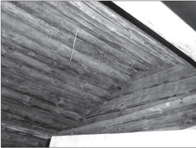
Суцільний накот (Білорусь)

шило теплоізоляційні властивості споруди за рахунок повітряної прокладки [45, с. 324] 13 .