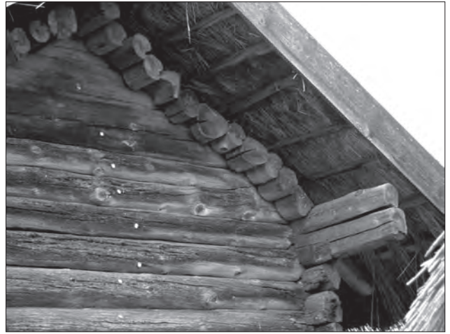
Суцільний накот (Білорусь)