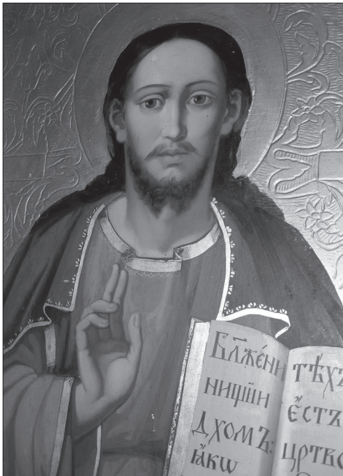
Іл. 4. Фрагмент намісної ікони Христа-Вчителя монастирського іконостаса з Рогатина, збереженого в с. Надрічне Бережанського р-ну Львівської обл. Фото 2012 р.

лаївського храму автор порушує питання двох іконографічних традицій: східної та західної. Над південними дияконськими вратами відображено іконографію Нерукотворного Спаса, яка за походженням сягає патристичних часів та знаходить певні джерельні потвердження відповідної давнини 2 [6, с. 59]. Над північними бачимо зображення Го-