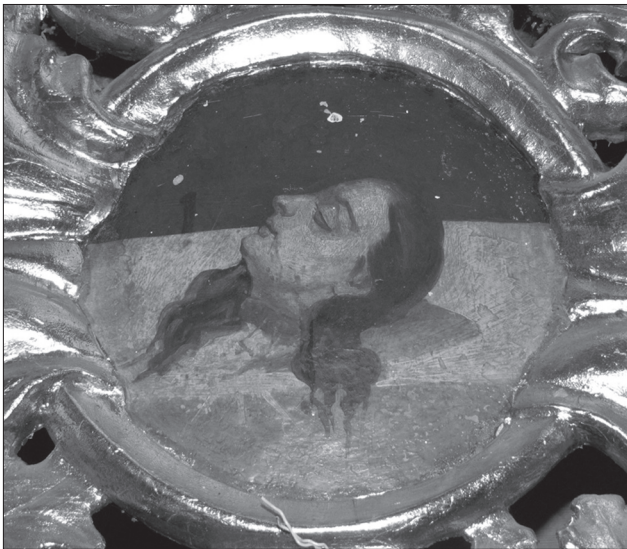
Іл. 8. Ікона «Голова невідомого Мученика-диякона» (Мучениці?) над південними дияконськими вратами монастирського іконостаса з Рогатина, збереженого в с. Надрічне Бережанського р-ну Львівської обл. Фото 2012 р.

Таку характерність особливо яскраво спостерігаємо у фігурах на дияконських вратах монастирського іконостаса в Надрічному.