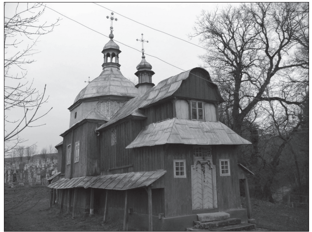
Іл. 1. Видяд монастирської церкви Переображення Господнього, збереженої в с. Надрічне Бережанського р-ну Львівської обл. Фото 2012 р.