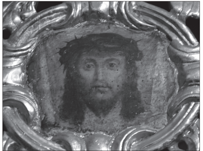
Іл. 6. Ікона «Плат Вероніки», або «Святий Лик» над південними дияконськими вратами церкви св. Миколая в м. Бучачі Тернопільської обл. Фото 2007 р.

лістичним трактуванням складок одягу, надаючи іконі надзвичайної життєвості і простоти. Характерним для маляра є жест при зображенні складених пальців долоні легко відводити вбік мізинний палець. Таку художню інтерпретацію руху руки спостерігаємо в ідентифікованому фрагменті зі зображенням св. Йоана Хрестителя. Таку ж характерність зустрічаємо в монастирському іконостасі: намісній Богородичній іконі, в зображенні Престолячої Богородиці, св. Єлени з предельного ряду, та дитяти, яке веде Ангел Хоронитель (розміщені на південних дияконських вратах). Не виключено, що таку інтерпретацію руху руки можна віднайти в зображеннях інших іконописців. Проте, натуралістичне прописування волосся широкими мазками є рідкістю в тогочасному українському іконописі.