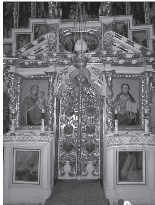
Іл. 2. Фрагмент монастирського іконостаса з Рогатина, збереженого в с. Надрічне Бережанського р-ну Львівської обл. Фото 2012 р.

бучацькі намісні ікони належать Василю Петрановичу (1680—1759) [14, с. 285], то порівнюючи їх живописний характер, слід визнати, що ікони над одвірками обох дияконських врат цієї ж церкви св. Миколая теж виконані ним (іл. 5, 6).