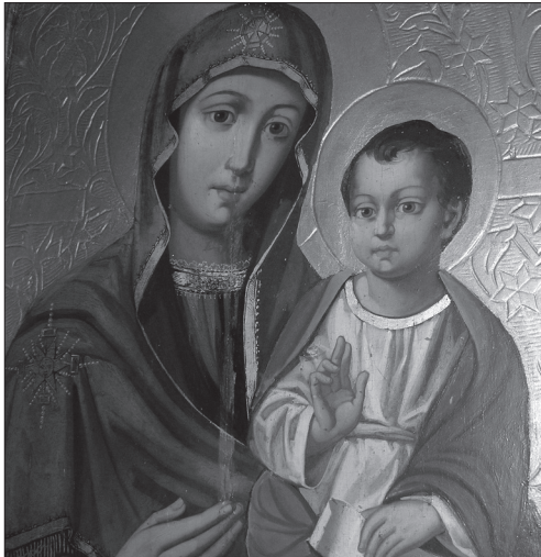
Іл. 3. Фрагмент намісної ікони Богородиці-Одигірії монастирського іконостаса з Рогатина, збереженого в с. Надрічне Бережанського р-ну Львівської обл. Фото 2012 р.