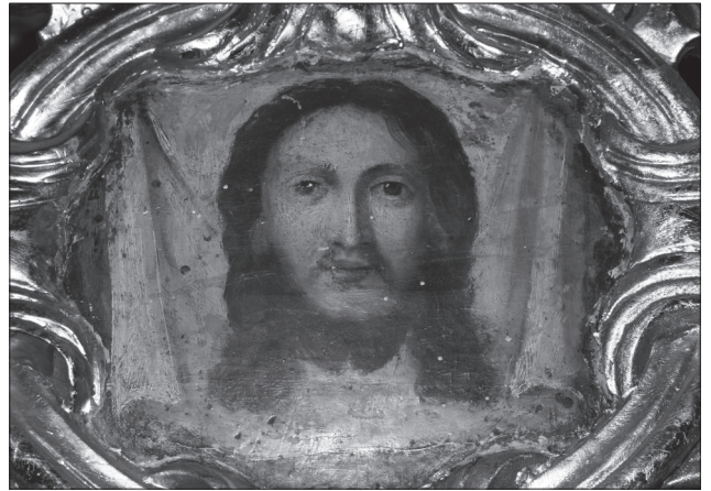
Іл. 5. Ікона «Спас Нерукотворний» над північними дияконськими вратами церкви св. Миколая в м. Бучачі Тернопільської обл. Фото 2007 р.

Цікавою є репродукована ікона Богородиці з Підгір'я Львівської обл. [10, с. 355]. Повні уста, великі і виразні очі зі синявою райдужної оболонки та трошки припіднятий вгору край верхніх повік, простота образу, досить масивні пропорції Дитяти Христа наводять на думку про ті ж особливості в перемальованій намісній іконі з Надричного. Простежити авторський почерк жовківського маляра можна і завдяки збереженим у Львівській картинній галереї двом фрагментам центральної ікони з ряду Моління неіснуючого відинського монастирського іконостаса [10, с. 356—357]. Надзвичайно м'яка світлотінь тілесних партій, круглі більші очі, тонкі підняті вгору брови яскраво контрастують з грубшим моделюванням волосся та натура-