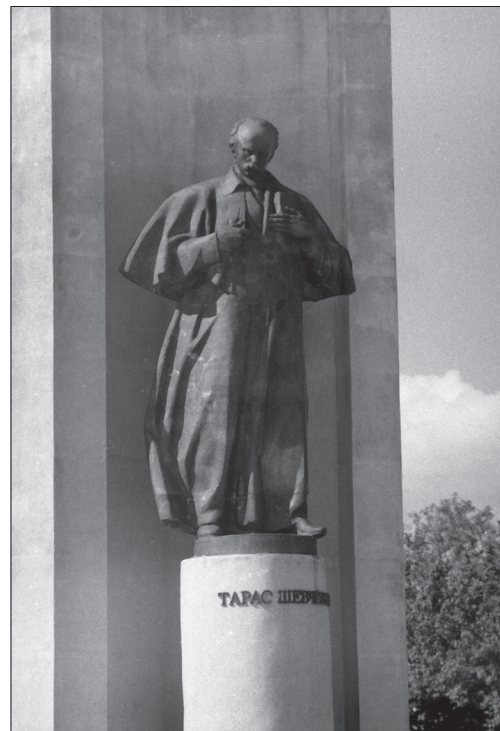
Іл. 3. Василь Одрехівський, Володимир Одрехівський, Тарас Шевченко (фрагмент монумента «Будителі»), бронза, камінь, м. Стрий, 1995

образ, в якому зберігає специфічну для портрета багатогранність характеристики, неоднозначність образу. Таким чином, від станковізму взяті не зовнішні прийоми, а його глибинні особливості, його здатність до багатостороннього, глибокого, психологічного розкриття образу.