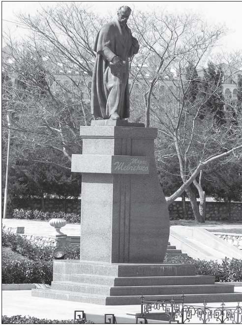
Іл. 6. Василь Одрехівський, Володимир Одрехівський, «Тарас Шевченко», бронза, граніт, м. Севастополь, Крим, 1994 (встановлено 2003 р.)