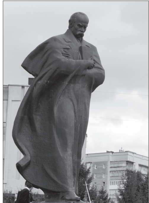
Іл. 8. Василь Одрехівський, Володимир Одрехівський, «Тарас Шевченко», бронза, граніт, м. Новий Розділ, 1997

Постать Тараса Шевченка передано в складному динамічному стані (іл. 8), коли фігура, на перший погляд, перебуває, немов у стані спокою, хоча насправді це є початок руху. Тут поєднані і статика, і динаміка. Авторам вдалося уникнути як застигlosti, так і надмірного вияву зовнішнього руху. Виразний порив фігури стримується станом внутрішньої зосередженості, в якому перебуває поет. Його обличчя сповнено роздумів, внутрішньо зосереджене. Контрастом до цільної монолітної фігури є складки плаща-накидки,