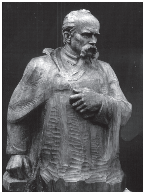
Іл. 10. Василь Одрехівський, «Тарас Шевченко», дерево, 1990-ті рр.

Створюючи пам'ятники діячам української культури, В. Одрехівський майстерно вибудовує конструктивну, змістовну пластичну форму, знаходить