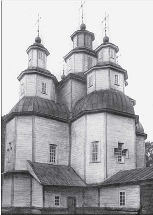
Чернігівська школа. Церква Св. Трійці. Пакуль. 1710 р. (За С.Таранушенком)

ють знаковий національно-стильовий характер і «майбутніми поколіннями будуть сприйматися вже як своє рідне..., а здобувши визнання свого народу і досягнувши вищої довершеності, набуває визнання інших народів» [88, с. 41]. Наприкінці XVII ст. з'являються в Надпоріжжі ротондальні та полігональні типи церков, які поширилися до кінця XVIII ст. на землях донських козаків та Кубані.