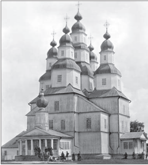
Наддніпрянська школа. Собор св. Миколи Медведівського монастиря. 1785–1795 рр.

ц. св. Онуфрія в Тереховля (XIII ст.), і закріплюється в кінці XV — на початку XVI ст., коли вони будуються на всій території України.