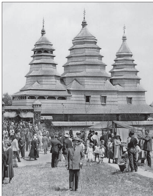
Бойківська школа. Церква св. Миколи. Кривка. XVIII ст. Пренесена в 1930-х рр. до Львова