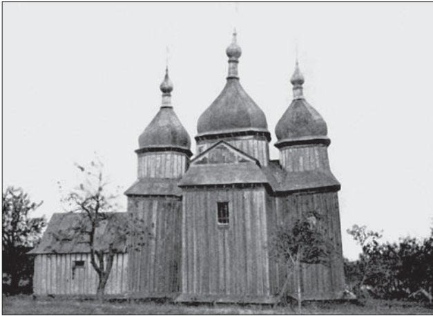
Подільська школа. Церква св. Миколи. Паланка. 1675 р.

стантин Острозький очолили національний рух XVI—XVII ст., що проходив під релігійним гаслом відродження українсько-білоруської православної церкви [74, с. 410—411]. Цей рух сприяв не тільки духовній єдності у вірі, спротиву католицьким візирцям, а й вплинув на збереження національного образу української святині.