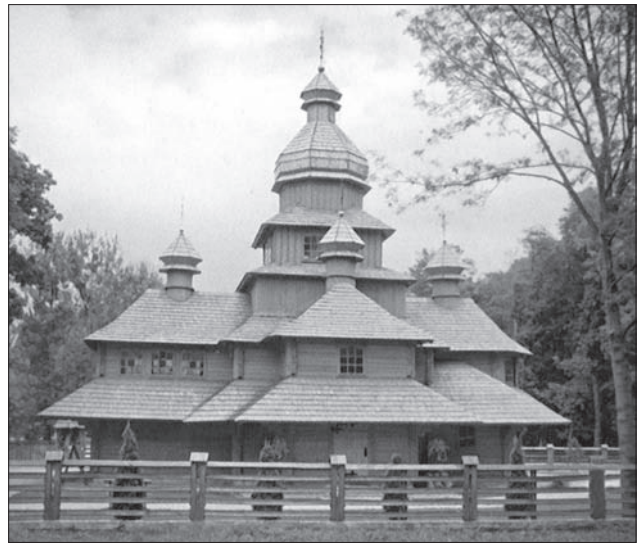
Церква Блажених Мучеників УГКЦ. Львів. 2009 р. Архітектор Р. Сулик

Десятки церков у Едмонтоні будувалися і перебудовувалися під наглядом архітектора о. Филипа Ру, який вивчив українську мову і архітектуру (ц. св. Онуфрія — Барич, 1907 р.; ц. св. Параскеви — Ельдоріна, 1913 р.; ц. св. Параскеви — Козак, 1913 р.; ц. Успіння Пр. Богородиці — Редвей, 1914 р.; ц. Пр. Трійці — Ледук 1900, 1918 р.) [14,