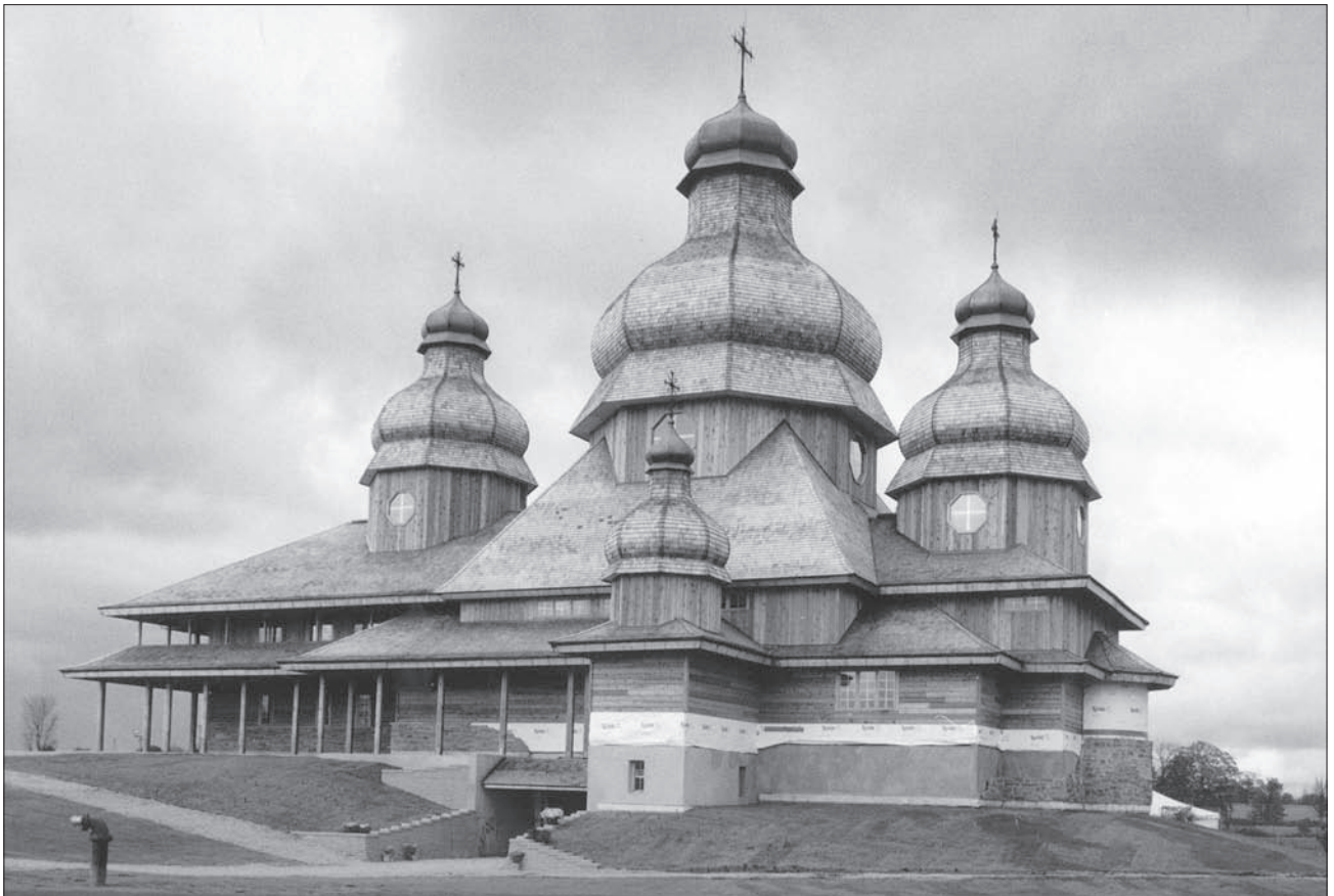
Церква св. Пророка Іллі. 1992 р. Брамптон, Канада

брано надзвичайно мальовничу трьохбанну церкву Вознесіння на Кудрявці, яку збудовано було 1718 року і також трьохбанну церкву Івана Златоустого на Старому Києві. В 80-х рр. знищено Введенську церкву на Оболоні... і Іорданську... вже в початку XX віку надзвичайно струнку, красиву п'ятибанну церкву Петра і Павла на Курнівці замінило сучасне чудовисько в «русском вкусе» [22, с. 75].