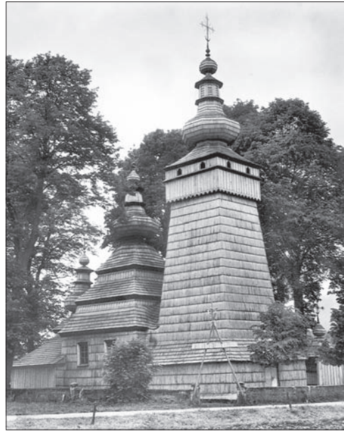
Лемківська школа. Церква св. Параскеви. Квятонь (Польща). 1815 р.

Національний рух XVI—XVII ст. відіграв важливу роль під час боротьби за національну церкву. Соціальні й релігійні конфлікти, які спалахнули 1640 рр. від Холмщини аж до Задніпров'я, відвоювання Чернігівщини і Сіверщини повернули ідейну гідність українського етнографічного простору, значною мірою розірваного в другій половині XIV століття. Рух національно-віросповідної боротьби ще міцніше запліднили образ руської святині, яка стає одним із маркерів означення і об'єднання української етнічної території. «Люблінська унія — попри всі її негативні наслідки — дала принаймні одну користь, що всі українські землі були об'єднані в одну цілість, скасовані були кордони, які відокремлювали Західну Україну від Східної» [30, с. 94]. Ця ситуація не тільки вирівнювала провінціальні різниці, виробила спільну національну політику, утвер-