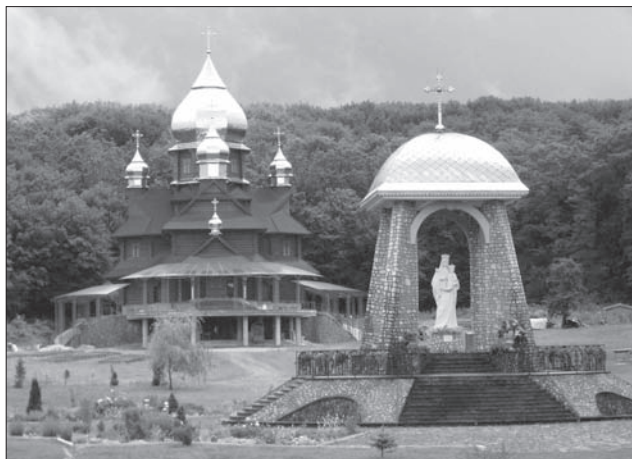
Собор Погінської Богородиці, с. Погоня, Тисменицький р-н, Івано-Франківська обл. 2013 р. Архітектори І. Пилипів, Р. Кость

цтві, збільшенням площі і висоти церков, утвердженням української народної стилістики та увагою професійних архітекторів до проектування хрещатого типу церкви, який дає змогу досягти гармонійної композиції об'ємів і максимального розміру головної бані.