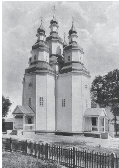
Слобожанська школа. Церква Покрови Пр. Богородиці. Ромни. 1764 р. За Г. Логвином та С. Таранушенком

За дослідженнями П. Юрченка, ці типи церков «були відомі на Волині і Подніпров'ї, бо характерні форми їх восьмериків і бань мали вплив на формування тут архітектури кам'яних церков кінця XVII століття». В цей період на Подніпров'ї ще було в зародку будівництво п'ятизрубних церков, які «у XVIII ст. набудуть високого розвитку і стануть новим напрямом українського дерев'яного будівни-