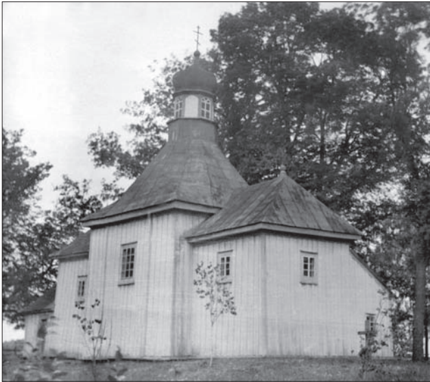
Волинська школа. Церква Різдва Пр. Богородиці. Михлин. 1755 р.