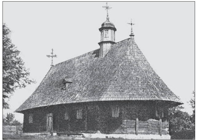
Буковинська школа. Церква в Нових Мамаєвцях. 1773 р. (За Д. Щербаківським)

Впродовж XIV—XVI ст. в Галичині, Волині, де густота населення була більш високою, ведеться активне сакральне будівництво, архітектура отримує риси репрезентативності. Цей період представляє ар-