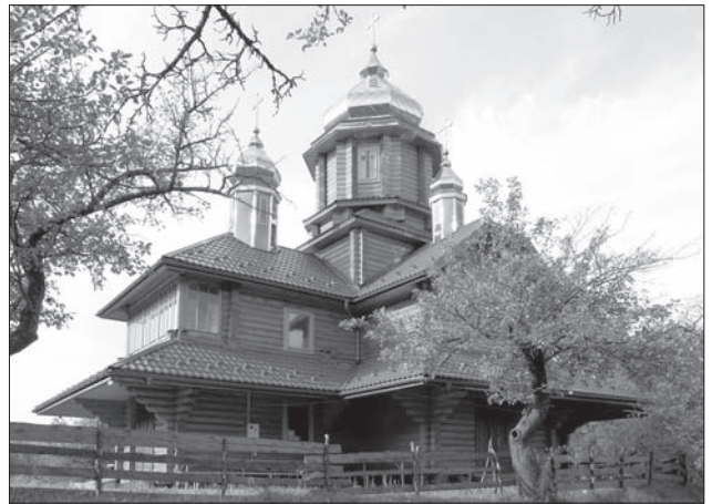
Трапезна церква, с. Погоня, Тисменицький р-н, Івано-Франківська обл. 2008 р. Архітектори І. Пилипів, Р. Кость

На українській етнічній території, яка після Першої світової війни опинилася у складі Польщі, Словаччині, Чехії, Румунії, сакральна дерев'яна архітектура у міжвоєнний період дістає у кожній із цих країн своє забарвлення під впливом зовнішніх та внутрішніх чинників. У Польщі будуються хрещаті