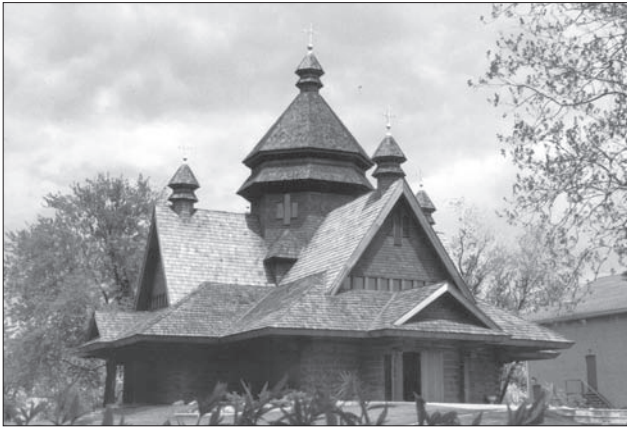
Церква Різдва Пречистої Богородиці. 1988 р. Ніагара Фалс, Канада

ження по горизонталі і по вертикалі з коефіцієнтом зменшення відносно центра дало можливість створити прецедент до формування великої кількості різних за об'ємно-планувальним вирішенням церков та досягти того, що «зовнішній вигляд завжди підпорядкований внутрішнім формам будови... навіть форма накриття даху і бань на зовні точно відповідають внутрішнім формам» [56, т. 1, с. 43].