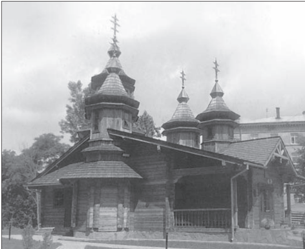
Церква св. Олексія. Львів. 2009 р. Архітектор Р. Сулик

Політична ситуація в Галичині у міжвоєнний період також сприяла будівництву дерев'яних римокатолицьких костелів та каплиць (у сс. Берлін, 1934 р.; Ільник, 1924—1925 р.; Пикуловичі, 1921 р.; Рудно, 1935 р.; Чижевичі, 1936—1937 р.; Язлівчик, 1933 р., всі у Львівській обл.) [38; 6]. Вони будуються професійними архітекторами в стилі історизму або модерну. На Холмщині і Підляшші польська влада знищила понад 150 православних церков [9, с. 18].