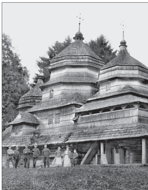
Бойківська школа. Церква св. Миколи. Тур'є. 1690 р. 1910 р.

ється на галицько-волинських землях [78, с. 91]. У цей період починають споруджувати тринавні трьох-апсидні з чотирма стовпами храми, їх будують рідко (церква Богоявлення в Острозі, XV ст. та церква св. Трійці у с. Межиріччі, XV—XVII ст. обидві у Рівненській обл.) [34, с. 171—176, 395—396].