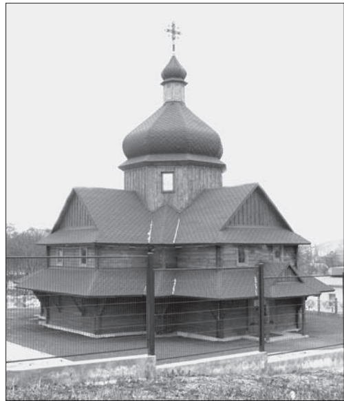
Церква Блаженного Миколая Чарнецького. Львів. 2011 р. Архітектор Ю. Дубик

На початку 1990-х рр. і пізніше громади на місці згорілих дерев'яних церков будують нові на зразок втрачених святинь (ц. Різдва Пресвятої Богородиці, с. Тишиниця, Сколівський р-н, 2010 р.; ц. Богоявлення Господнього, с. Головецько, Сколівський р-н, 2008—2010 рр.; ц. Перенесення Мощів св. Миколи, с. Войславичі, Сокальський р-н, 1993 р.). Під керівництвом архітекторів здійснюється відтворення кращих втрачених взірців української дерев'яної архітектури (ц. Преображення Господнього, Крехів, Жовківський р-н, 2002 р.); церква Покровина о. Хортиця, 2007 р., науково-історичний комплекс «Запорізька Січ»; Хресто-Воздвиженський собор, Скит Манявський, 1998 р.; храм Миколи Чудотворця, с. Мазепинці, 2009 р., Меморіальний комплекс українського козацтва [4, с. 153, 211].