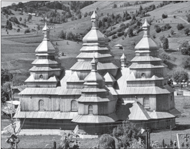
Церква. Волосянка. 1990-ті рр. Архітектор І. Подоляк

Архітектори А. Осадца та І. Жуковський споруджують дерев'яну церкву в Глен Спен, М. Німців — дерев'яну церкву в Філадельфії, І. Жуковський — гуцульську церкву з дзвіницею в Гентері. Необхідно відзначити, що розвиток сакральної архітектури на Американському континенті пішов у напрямку пошуку української стилістики в мурованих церквах. Юрій Козак збудував модерну церкву в стилі козацького бароко — в Бавнд-Бруку, М. Німців струнку бароко-модерністичну церкву у Вашингтоні, Р. Жук — низку церков у модерністичному стилі — у Вінніпегу, Торонто, Керкгонсон та церкву недалеко від курортного містечка Гантер в штаті Нью-Йорк.