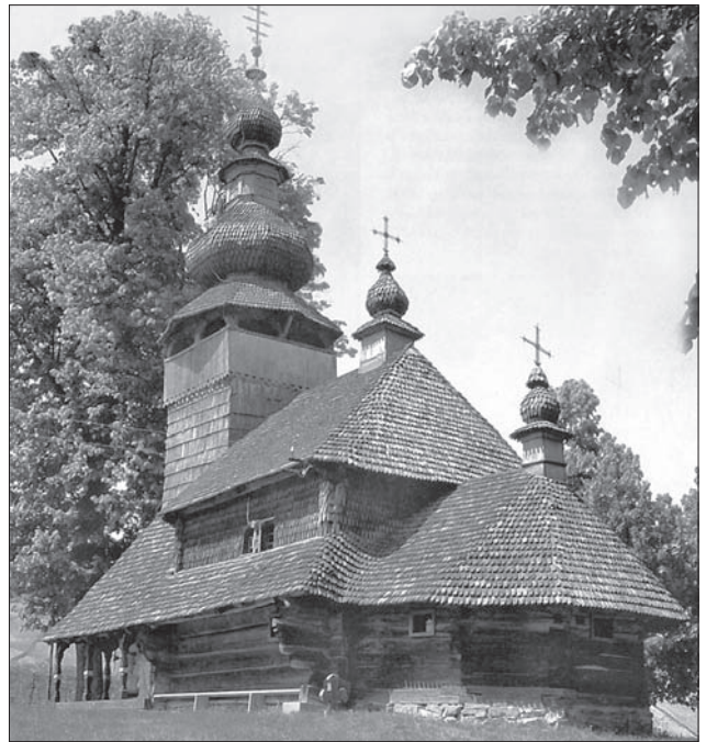
Закарпатська школа. Церква св. Миколи Чудотворця. Свалява-Бистрий. 1588 р., 1759 р.

В часи готики монастирями закладалися основи невеликої тридільної церкви, про це свідчать муровані церкви з XIV—XV ст. в Рогатині, Белзі, Фельштині (Скелівка), Дрогобичі, Сяноку, Нижанковичах, Калуші, Чесниках, Росохах [26, с. 137—147; 78, с. 86—96]. Тип малої святині, складеної з трьох частин (першу частину творить дзвіниця, до неї приставлена в плані квадратна або прямокутна, середня частина церкви, до якої додають вівтарну апсиду), було перейнято від німецької готики. Середня частина будівлі є найбільшою, нижча ніж дзвіниця, вівтарна частина значно нижча і набагато менша в плані, ніж середня. Від них дерев'яні церкви одержують план, який складається з трьох квадратних (прямокутних) зрубів, витягнутих на одній лінії; західний служить бабинцем, над ним споруджується дзвіниця, середній, більший — навою, східний — вівтарем. Всі три об'єми є самостійними і