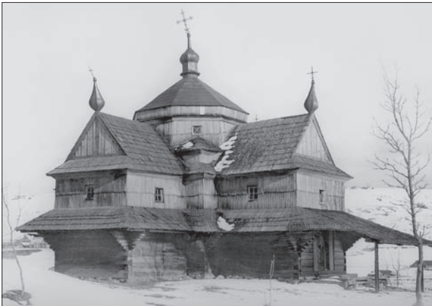
Гудузька школа. Церква Вознесіння Господнього. Ясіня. 1824 р.

Важливим чинником, який позначився на архітектурі церков в Україні в XIV — I пол. XV ст., була міжцерковна боротьба, суперечності, які існували між Литвою і Московією, Римом і Константинополем, які призвели до розчленування Руської церкви в складі різних держав, що ще більше надало руському православ'ю етнічного забарвлення і статусу. За відсутності української державності посилюється процес трансформації православ'я із вселенського в національне.