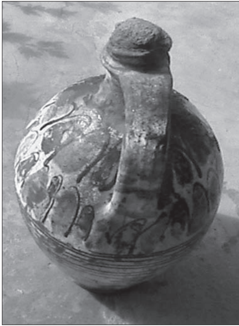
Іл. 2. Банька, м. Бар (Вінницька область), перша третина ХХ століття. Польові матеріали Анатолія Щербаня

ню вологи. Діаметр вінець був таким, щоб в отвір могла вільно потрапляти рука під час миття посудини і її було зручно наповняти різнорозмірними твердими інгредієнтами. Але не дуже широким, аби рідина швидко не викіпала й страва умлівала. Для цього горщик часто закривали глиняною покриткою (іл. 1:2), для розміщення якої пристосовані вінця. Кулястий тулуб посудини забезпечував добре прогрівання вмістилища в печі.