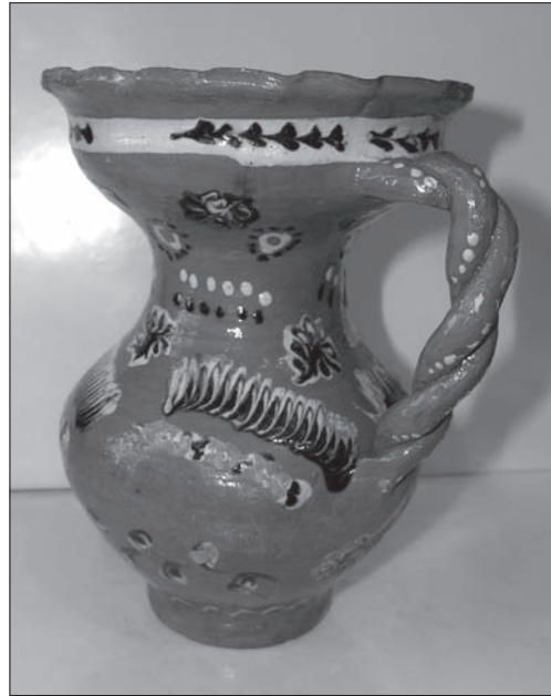
Іл. 3. «Перепієць», с. Постав-Мука (Полтавська область), 1923. Польові матеріали Олени Щербань

Горло і вінця посудин для води («тиква» (іл. 1:8), «барильце» (іл. 1:9)), алкогольних напоїв («тиква»,