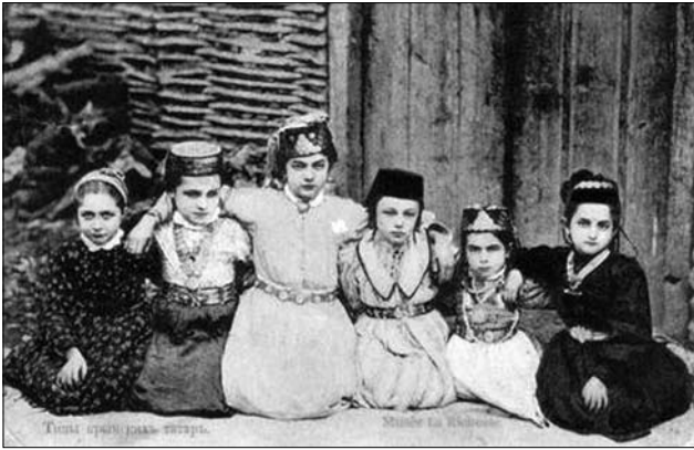
Іл. 8. Листівка поч. XX ст. «Типи кримських татар». Дівчатка в традиційно прикрашених фесках