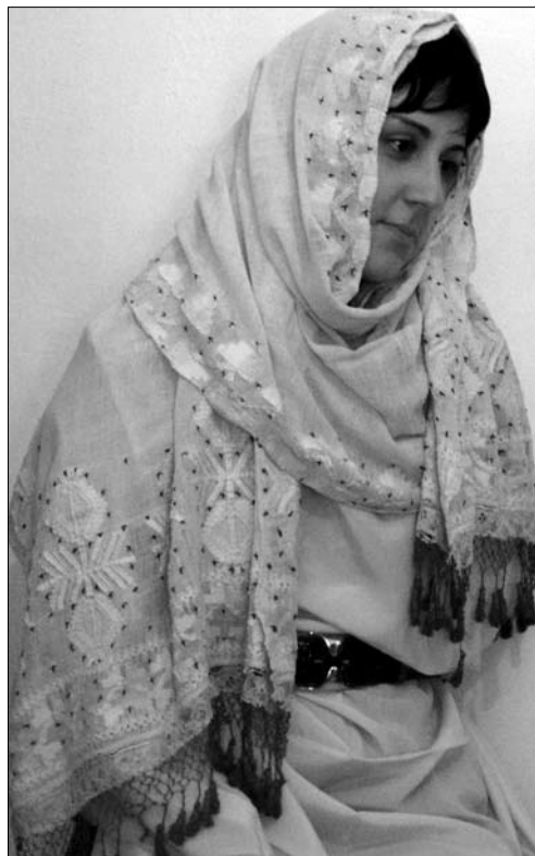
Іл. 1. Узорно виткана головна шаль марама середини ХІХ ст. з мідними золоченими китицями. Власність автора

Численні діалектні варіанти хусток: шал / шалчих / дорт-коше / чевре / чїре / чембер / шембер / хане /