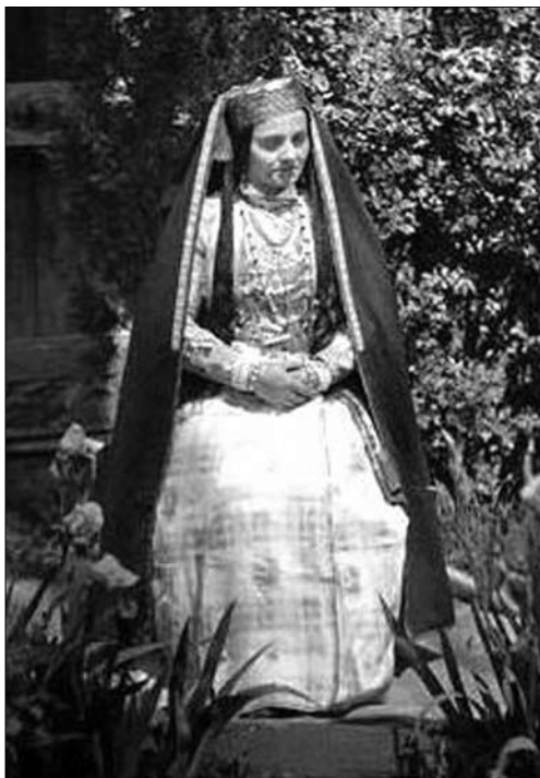
Іл. 2. Листівка початку ХХ ст. із зображенням кримської татарки в національному костюмі. На голові фес, зверху фередже

підборіддям хустки, складеної трикутником чи цільно, з вільно розпущеною частиною на спині, не характерне для кримських татарок. Перший спосіб носіння хусток традиційний для російських жінок, другий — для казанських татарок.