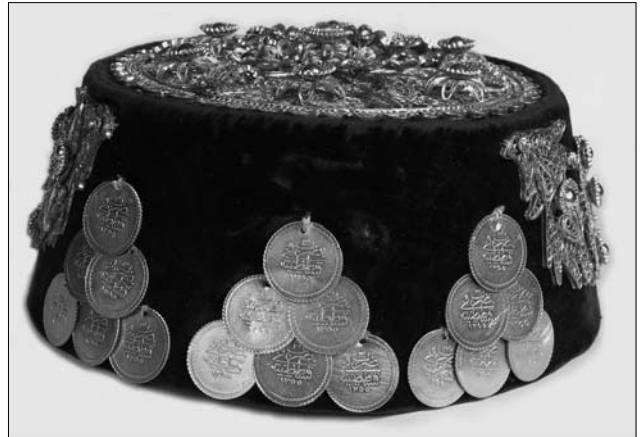
Іл. 3. Традиційна феска алтын фес. З фондів Музею історичних коштовностей України