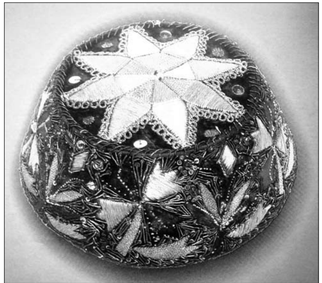
Іл. 4. Традиційна феска михламали фес. З фонду Кримськотатарського Музею мистецтв. Крим. Сімферополь