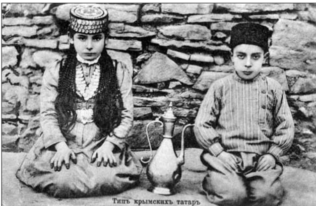
Іл. 9. Листівка початку XX ст. «Типи кримських татар». Діти в традиційних головних уборах. На дівчинці — алтин фес, на хлопчику — татар халпах

фес, тобто феска, прикрашена галуном, означала дитячий головний убір.