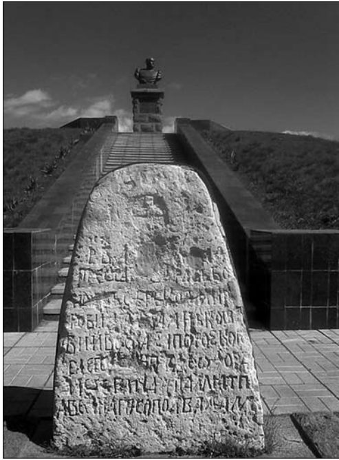
Іл. 4. Сучасний вигляд могили Івана Сірка.

славетного отамана. Цю вимогу довелося виконати. Одночасно представники влади пообіцяли знайти вихід із непростой ситуації з черепом. Передбачалось, що згодом його помістять в каплиці, що її збирались збудувати поблизу нової могили отамана, якій в 1999 р. за Наказом Міністерства культури України (№ 579 від 21 вересня ц. р.) було надано статус пам'ятника національного значення. Цей проект, як і попередні, так і не був реалізований. В 1997 р. череп потрапив до фондів Дніпропетровського історичного музею ім. Д.І. Яворницького.