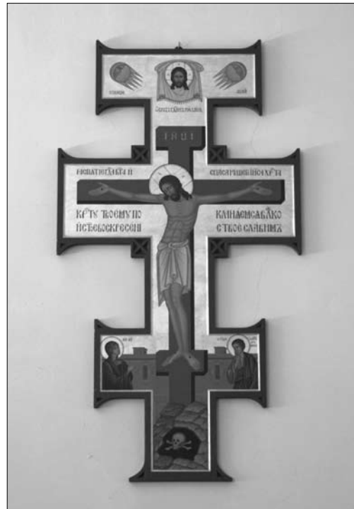
Іл. 3. о. Ювеналій Мокрицький. Хрест з Розп'яттям. Український католицький університет імені святого Климента в Римі, Італія. 1968 р. Дерево, темпера, золочення; 101,5 x 66,7 x 2,3 см

Паралельно з роботою у соборі Святої Софії Ювеналій Мокрицький працював для Конгрегації Схід-