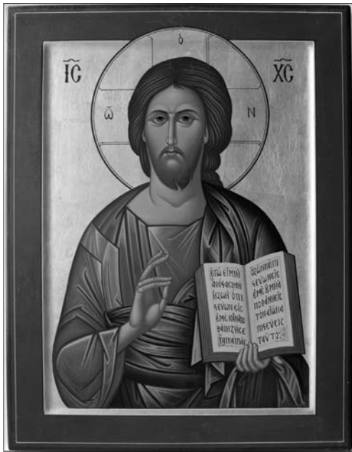
Іл. 4. о. Ювеналій Мокрицький. Христос Пантократор (Вчитель). 1969 р. Дерево (ковчег), левкас, темпера, золочення; 45,5 x 35,4 x 1,7 см. Храм Успіння Пресвятої Богородиці, Унівська Лавра

решту ікон до іконостаса виконав іконописець дякон Христофор Куць.