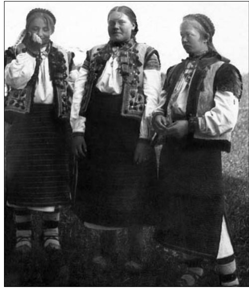
Іл. 4. Гуцулки у святкових запасах, с. Ясіня Рахівського району. 1921 рік.

Поверх спідниці одягали фартух («катран»), пошитий у складки з однієї або двох піл. По низу фартухи оздоблювали фабричними стрічками («пантликками»), машинними швами, мереживом («чіпка-