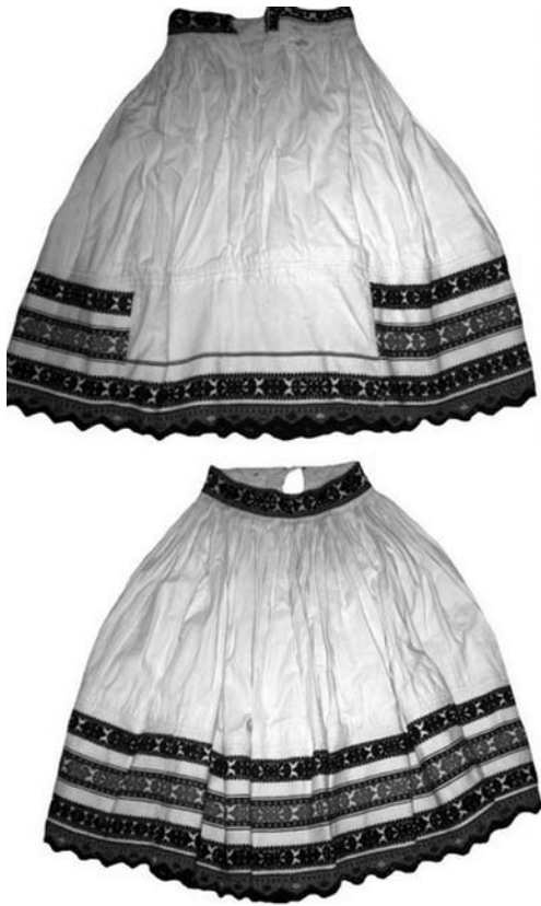
Іл. 3. Спідниці («подолки»), с. Хижа Вінградівського району. Домоткане полотно, вишивка, низина, мережка. 20-ті рр. ХХ ст.

ниця, Ганичі, Калини, Вишивате Тячівського району весільному поясу («ременю») надавали оберегового значення. Його часто використовували у обрядах, пов'язаних із худобою («скотом»). Так, напередодні першого вигону худоби у поле, з пояса витягували три нитки. З них плели поясок, довжина якого мала охопити стан жінки (господарки худоби). Господарка підперезувалась поясом на ніч. Ранком цей пояс закопували на порозі хліва, щоб через нього пройшла корова. Слова, які промовлялись під час плетіння поясу, розкривали суть обряду: «Як пояс плівся, так і скотинка приходила б на свій двір — із сліду в слід». У с. Дубове пояс також клали на корову при доїнні після першого отелення, щоб корова не злягла [2, с. 7—8; 47, с. 24].