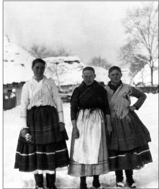
Іл. 1. Дівчата у традиційному народному вбранні, с. Кам'яниця Ужгородського району. 1921 р.

У XIX ст. спідниці підперезували поясами, довжина яких могла сягати двох метрів. Пояси плели із вовняних ниток, пофарбованих у бордовий, червоний, рожевий, жовтий кольори. Плетіння терблеріцьких поясів проходило наступним чином. На дві рівні дерев'яні палички висотою 15—20 см, вмонтовані у лавицю на відстані двох метрів одна від одної, намотували різнокольорові нитки, які натягувались і набирали вигляду струн. Плести починали від середини натягнутих ниток із поступовим відтяганням виплетених частинок то вправо до краю, то влі-