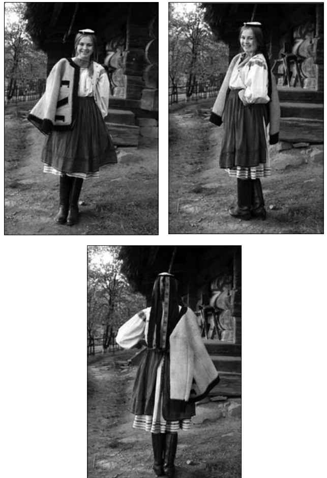
Іл. 7. Дівчина у традиційному бойківському вбранні, с. Рєкїті Міжгірського району. Реконструкція, 2014 р.

Наприкінці XIX ст. у Рахові та навколишніх селах поширились вузькі (2—3 см) ткані пояси довжиною 150—160 см. Їх краї перетикались жовтими чи білими ламаними лініями («кривулями»), а посередині — різнокольоровими ромбовидними рядками. У їх кольоровій гамі переважали жовті барви із вкрапленням бордових, білих та голубих. На