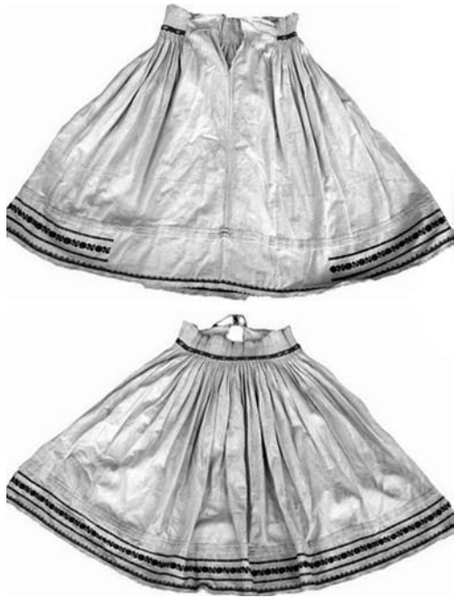
Іл. 8. Спідниця («фартух», «біленик»), с. Верхній Бистрий Міжгірського району. Домоткане полотно, вишивка, хрестик. 20-ті рр. ХХ ст.

льорів. Але домінуючим був червоний колір, якому надавалась оберегова функція [36, с. 68].