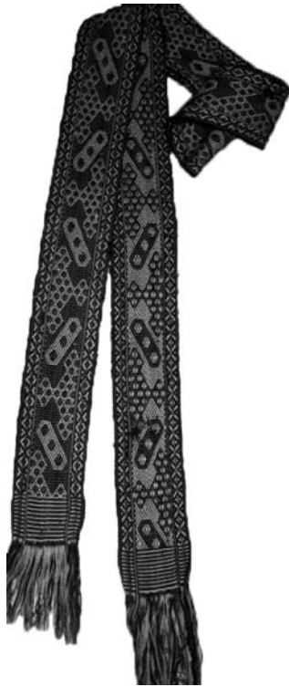
Іл. 6. Тканий пояс («окрайка»), с. Лазещина Рахівського району. Вовняні нитки, тканиня. 20—40-ві рр. ХХ ст.

лії і зав'язували на вузол спереду. Так само загинали передню запаску («передницю») і зав'язували ззаду. Щоб зберегти виткані запаски, жінки одягали поверх них трапецієподібні фартухи, зшиті з чорної грубої тканини («глота»). Крім того, у будні та коло дому одягали тільки задню запаску, а спереду — фартушок [26, с. 84].