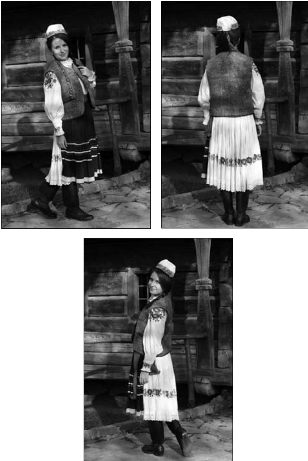
Іл. 10. Дівчина у традиційному лемківському вбранні, с. Гусний Великоберезнянського району. Реконструкція, 2014 р.

Поверх спідниці бойкині одягали фартух («пілку», «півку») з конопляного чи лляного домотканого полотна. У бойків Закарпаття побутували і фарбовані («фарблені») фартухи. Святкові фартухи оздоблювали вишивкою стилізованих рослинних орнаментів, а низ прикрашали гачкованою мережкою із конопляних або лляних ниток. Домоткані фартухи побутували до кінця 20-х — початку 30-х рр. ХХ ст.