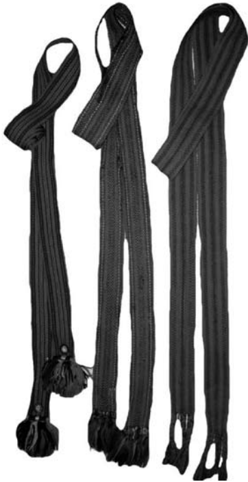
Іл. 2. Пояси («пасини»), с. Довге Іршавського району. Різнокольорові вовняні нитки, ткания. 20-ті рр. ХХ ст.

стрічками («пандликами») та білими мережками («чіпками») по низу, а літні жінки та бабусі — більш темні із простим орнаментом. Плати у поясній частині (завширшки 60—65 см) збирались у складки і пришивались до поясу. Пояси були довгими (120—130 см) із прямими та із гострими кінцями. До кутків поясу пришивали шнурочки («мотузи»), які зав'язували спереду в бантик. Пояси оздоблювали машинними швами («строчками», «штетками») у вигляді прямих та хвилястих ліній («кривуль»), які часто доповнювали різнокольоровими атласними смужками та дрібними крапками («цятками»). Найпоширенішими були червоні, рожеві, чорні, сині чи зелені пояси. «Плати» оздоблювали поперечними загинками («гайташами»), між якими пришивали різнокольорові смужки («пандлики») [5; 20; 21].