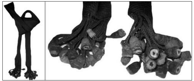
Іл. 12. Довгий жіночий пояс, с. Стужиця Великоберезнянського району. Вовняні нитки, в'язання. 20-ті рр. XX ст.

Отже, жіночий поясний одяг українців Закарпаття протягом XIX — першої половини XX ст. зазнав певних змін. Насамперед це проявилось у конструктивних елементах крою, матеріалах для виготовлення, способах одягання. У XIX — на початку XX ст. долинянки одягали спідниці, які з початком XX ст. поступово витіснялись фартухами. Свої особливості мало поєднання спідниць та фартухів з поясами. Етноідентифікуючими ознаками терреблеріцьких фартухів були кінці поясів, фабричні стрічки («пантлики на коцку»), кругла фабрична мережка («чічка»). Оригінальністю виділялись чорні фартухи жінок старшого віку у боржавських долинянок, а також ткани боржавські пояси. Характерною ознакою тересвянських фартухів була різнокольорова фабрична матерія, вузькі фабричні стрічки («пантлики»), різноманітні мережки та декоративні шви. Наприкінці XIX — на початку XX ст. з витісненням «руської» сорочки «волоською» пояси поступово виходять з ужитку. Етноідентифікуючою ознакою спідниць королівських долинян була вишивка, яка гармонійно поєднувалась з мережками та різнокольоровим обмітуванням. Фартухи долинянок з сіл Хижа, Черна, Новоселиця Виноградівського району подібні до тересвянських. Відмінність полягала лише у більшій яскравості та насиченості колориту. Спідниці турянських, свалівських, ужгородських і мукачівських долинянок за кроєм та оздобленням подібні до спідниць лемків Закарпаття. У колориті вишивки місцевих спідниць переважали зелені і червоні барви, у ту-