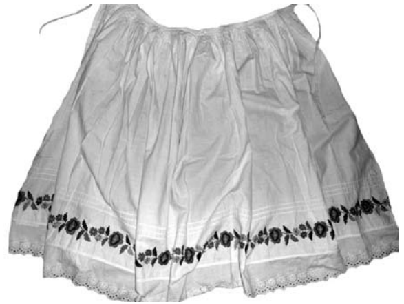
Іл. 9. Весільний фартух, смт. Воловець. Фабрична матерія, вишивка, гладь, фабрична мережка. 30—40-ві рр. XX ст.

Протягом 20—40-х рр. XX ст. у бойків Закарпаття загального поширення набули спідниці («сукні», «вігани», «катрани», «свити»). У молодих жінок вони були рожевого, червоного, зеленого, блакитного кольорів, у старших жінок та бабусь — чорного кольору. Спідниці («сукні») воловецьких бойків плісировали («рясили»). У верхній частині, поверх «рям-