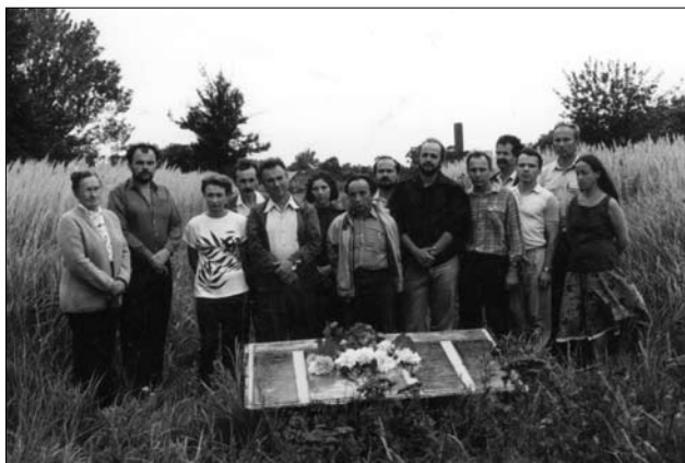
Учасники експедиції на братській могилі розстріляних під Базаром бійців 2-го зимового походу під проводом генерала Ю. Тютюнника.

Овруцького районів (1994—1995 рр.), де частково збереглося автентичне середовище та залишились незруйновані пам'ятки матеріальної культури, бо відселення мешканців відбувалося тут найпізніше — в 1991—1992 рр., а в деяких селах ще проживали носії поліської культури.