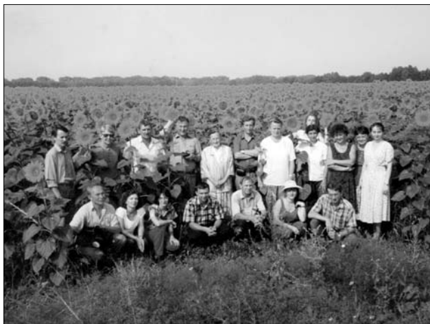
Учасники експедиції Баришівка — Переяслав-Хмельницький -99

Експедиційні дослідження розпочалися з 2-ї та 3-ї зон радіоактивного забруднення з Поліського та