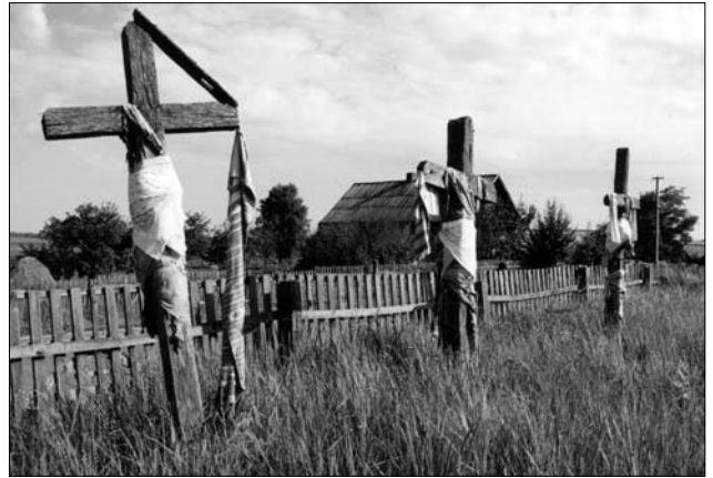
Цвинтарі Полісся.

ISSN 1028-5091. Народознавчі зошити. № 2 (128), 2016