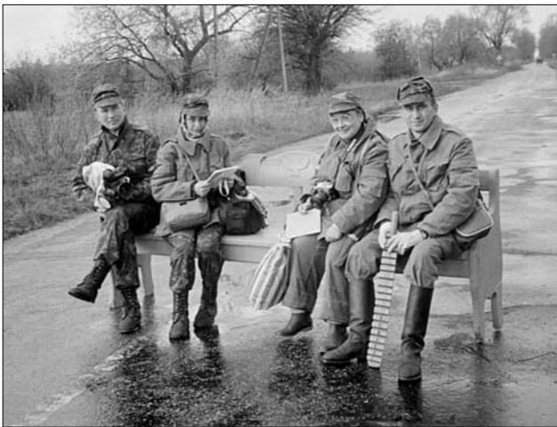
Учасники експедиції на перепочинку на бамбетлі, який вивезли на дорогу для транспортування

Після 14—16 експедиційних днів настає фізична та психологічна втома. Фізична — від перебування на радіоактивно забрудненій території, психологічна — від суцільного негативу — побаченого і почутого, також відсутності зв'язку зі своїми рідними і близькими, від яких ти надовго відірваний (в той час мобільного зв'язку ще не було).