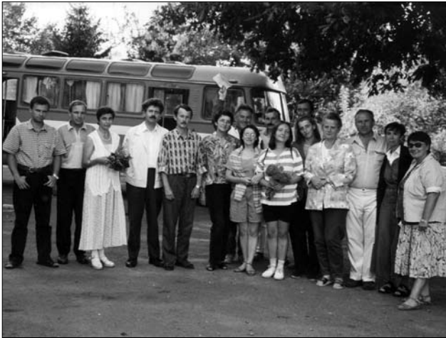
Учасники експедиції до переселенців відвідують могилу Тараса Шевченка у Каневі