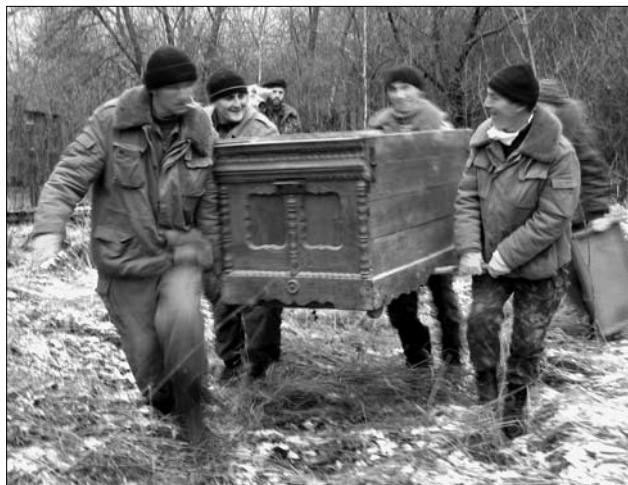
Перенесення скрині з плоским рельєфним профільним різьбленням до автобуса

ражеям після втручання Президента Віктора Ющенко провели нову електричну лінію, бо стару разом з трансформатором украли мародери.