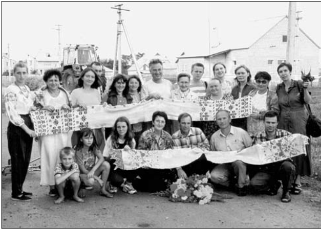
Учасники експедиції в Переяслав-Хмельницькому р-ні. Зустріч з переселенцями з с.Пухове Поліського р-ну.

чи ні? Для тих, хто там постійно мешкав, ці гасла не мали жодного значення. Своє життя в зоні поліщуки характеризували так: «Не можна дійти до пам'яті, що це робиться, що сталося, чому таке запустіння» 1 ; «Жили, горевали, стало краще, Чорнобиль все поламав. Горевали добре, мішок пшениці на зиму, а на старість робити мусили, щоб з голоду не вмерли. Як чоботи купиш, то не буде що їсти» 2 ; «У селі немає ні однієї лампочки (електричного освітлення. — Я. Т.). Скору визвать нельзя. Хліб два рази в неділю возять. Жити не можна» 3 .