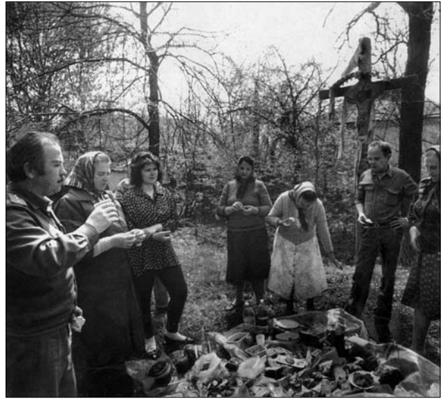
Поминальні дні в зоні відчуження. с. Крива Гора.

сильніша. Перебуваючи в зоні 16—20 днів, розумієш, яка це благодать — не боятися невидимого ворога, який тебе оточує, змушує постійно стояти на ногах, не дозволяє піти в туалет на природі. По-іншому сприймаєш землю, на яку ти можеш сісти, лягти, вирощувати екологічно чисті продукти, скупатися у водоймищі.