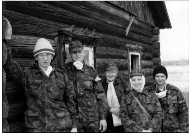
Учасники експедиції в с.Новосілки Чорнобильського р-ну. Зона відчуження. 1999 р.

ISSN 1028-5091. Народознавчі зошити. № 2 (128), 2016