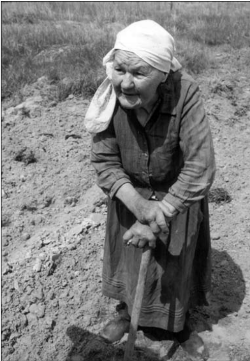
«Все життя трудилася, а на старість мушу ще більше працювати».