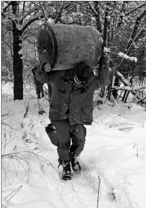
Важка, але цінна ноша до експедиційного автобуса

Весь провіант, включаючи мішки з картоплею, буряком, морквою, капустою ми везли зі Львова в населений пункт, де базувалися. Наш експедиційний