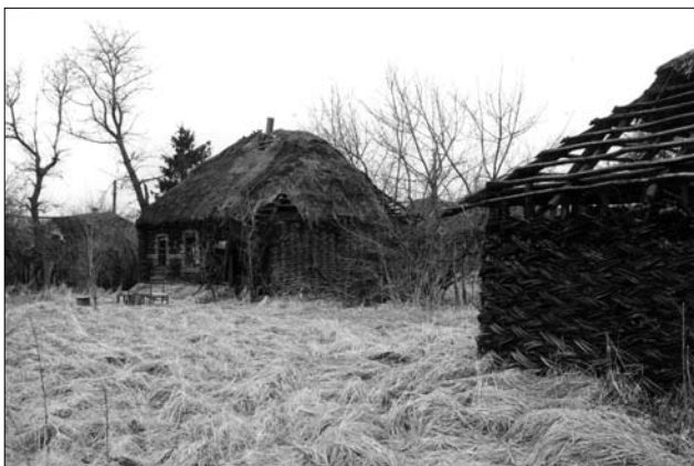
Картини, які не міг побачити Сальвадор Далі.

єднати насправді неможливо. Бабуся за вісімдесят і молодий чоловік-алкоголік, любов та ненависть, нестерпні умови життя та бажання вижити і вмерти на рідній землі.