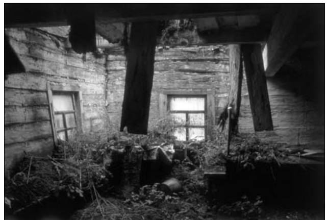
Інтер'єр покинутої хати після 16 років. Світл. Я. Тараса

ки Народицького району: «Все життя трудилася, а на старість мушу ще більше працювати».