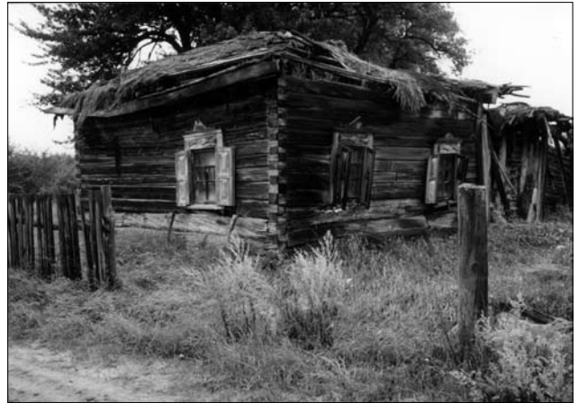
Стан покинутої хати після 16 років.