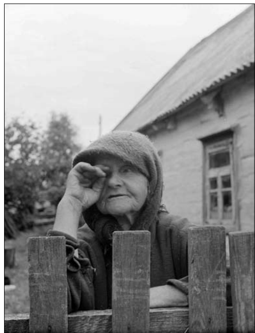
Вони пережили голодомори, війни, були вдовиді, виховали дітей, а тепер живуть в радіоактивному пеклі.