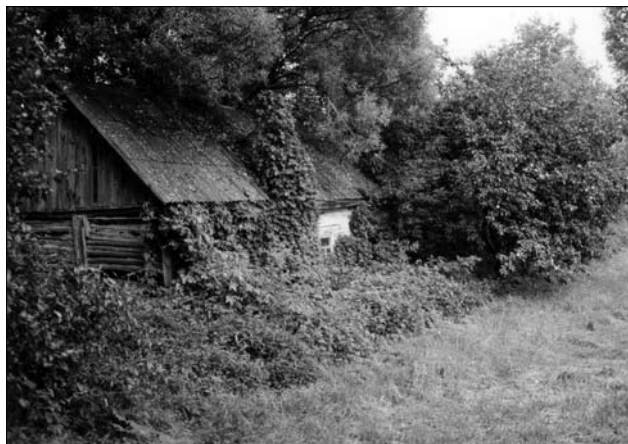
Природа працює, знищує те, що було зроблено руками поліщуків.

дер грибів. Спокуса у цьому випадку також взяла гору.