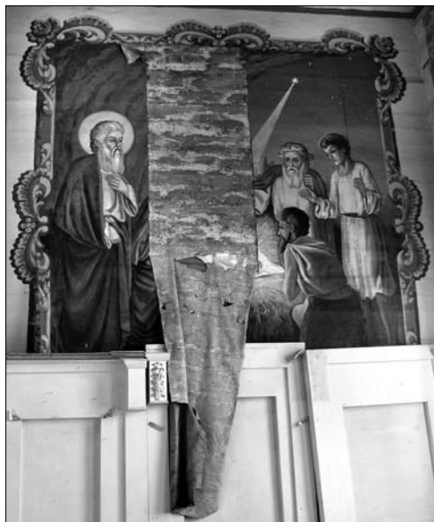
Пограбована церква в с.Красне.