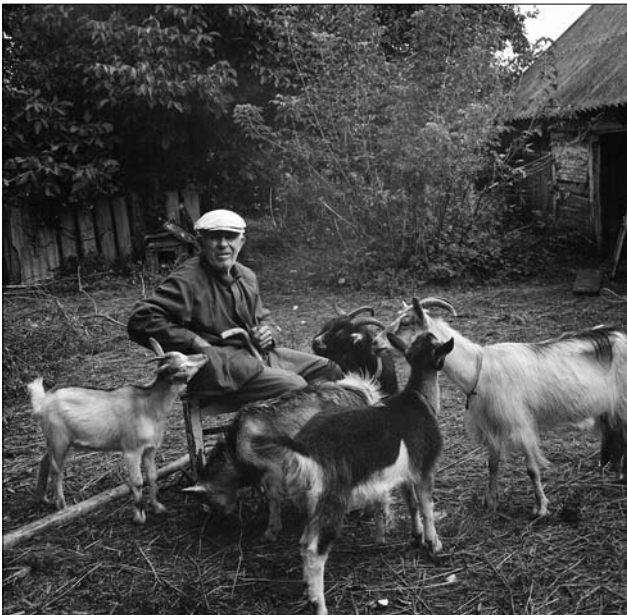
«Зараз я у приймах у Наташки».

бою. Такий психологічний феномен мені вдалося зафіксувати двічі. Образа один на одного не дає їм можливості помиритися. Чоловік признався, що він повисив перед хатою жінки газовий балон, якщо в неї буде якась біда, то нехай б'є в нього і він прийде.