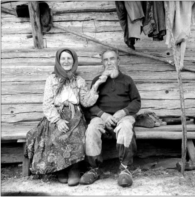
Поліський красень зі своєю молодою жінкою.