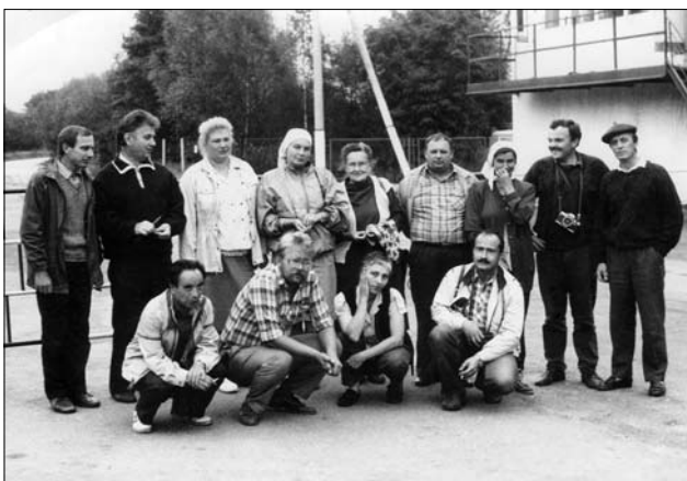
Перші комплексні історико-етнографічні експедиції в радіоактивно-забруднені зони Українського Полісся

жирі, повернутися 1992 р. в Україну й оселитися у Львові. Якби не Чорнобиль в моєму житті, то я, можливо б, і не повернувся в Україну. Отож, коли Інститут народознавства НАН України ініціював наукові експедиції в зону, я тут же погодився.