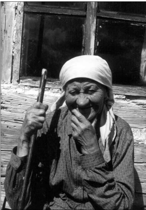
«Моліться, щоб швидше Бог нас забрав». Світл. Я. Тараса могою якої можна створити пожежу відразу на великій площі. Тоді у вогні була знищена єдина в регіоні Воскресенська барокова дерев'яна церква XVIII століття. Треба сказати, що знищення виселених сіл вогнем є одним із ефективних засобів боротьби влади зі старожилами, які повернулися до-

дому. Влада притримувалась правила: немає людей, немає проблеми.