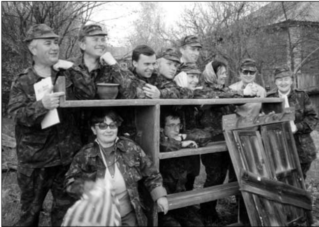
Пам'ятна світлина учасників експедиції із знайденими експонатами — мисником і віконницею.