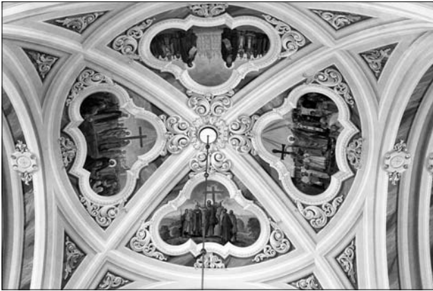
Іл. 1. Поліхромія склепіння храму св. ап. Андрія Первозваного (вул. Шевченка, 66), 1998—2000 рр. Худ. Б. Балицький