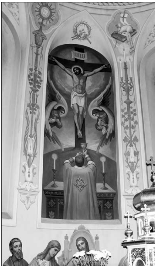
Іл. 5. Розп'яття. Поліхромія храму св. ап. Петра і Павла у Рясне 1 (вул. Лукасевича, 15), 2004 р. Худ. С. Булко, І. Леськів, І. Орищак та Є. Хруник (ДАХ)

лав Мудрий, Ігор, Олег Брянський, Костянтин Острозький, княгиня Юліанія Ольшанська, Єфросинія Полоцька, гетьман Петро Сагайдачний, отаман Петро Калнишевський (іл. 4). Також бачимо зображення українських чудотворних ікон Богородиці.