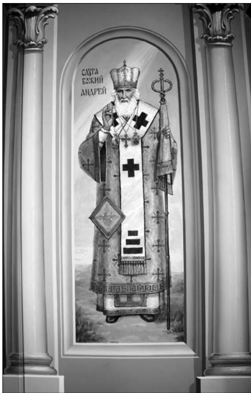
Іл. 2. Митрополит Андрей Шептицький. Поліхромія храму св. безсрібників Козьми і Дем'яна (вул. Лисенка, 45), 2002—2014 рр. Худ. Б. Балицький

державний інститут прикладного та декоративного мистецтва (тепер Львівська національна академія мистецтв), Львівський поліграфічний інститут (тепер Українська академія друкарства — далі УАД) або інші мистецькі школи України, в той час, коли ще не існувало кафедри сакрального мистецтва. Варто зазначити, що реалістична манера живопису та іконопису є нехарактерною для львівської мистецької школи, яка з давніх часів славиться своєю декоративністю. Найбільш відомим представником