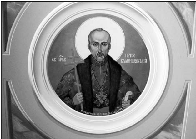
Іл. 4. Св. прав. отаман Петро Калнишевський. Поліхромія храму св. архангела Михаїла (вул. Каховська, 32), 2012—2014 рр. Худ. Б. Балицький