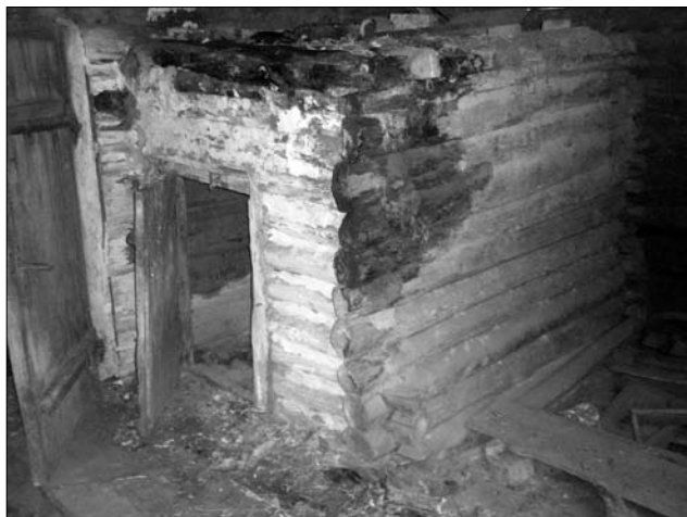
Стебка у сінях хати кін. ХІХ ст. у с. Луб'янка Поліського р-ну Київської обл. (зона відчуження)

внаслідок трансформації холодної комори, розміщеної через сіни від хати, у друге житлове приміщення (спершу — холодне, а згодом обладнане опалювальним пристроєм), на Поліссі у цьому процесі брала участь як холодна «кліть», так і тепла «стебка» 12 . Причому у деяких районах (наприклад, Західне Полісся Білорусі), де планування «хата + сенцы + вариўня» було найбільш поширеним (варивня мала значні розміри), власливо, це приміщення найчастіше пристосовували під помешкання [8, с. 78]. Слід нагадати, що за даними О. Харузіна, така стебка, об'єднана з житловою камерою сіньми, давніше у житлі білорусів часто могла бути обладнана опалювальним пристроєм типу відкритого вогнища [51, с. 181, 185, 194]. Стосовно перетворення у другу «мешкальну кімнату» на теренах Білорусі, передовсім, стебки, наголошує К. Мошинський [63, с. 552—553]. З. Дмоховський як приклад такої трансформації наводить будівлю зі с. Мочуль (Стол. Брест.), яка у первісному вигляді мала планування хата + сіни + стебка. З часом стебку переоблаштували у друге житлове приміщення (спорудили піч тощо), і кожна з хат використовувалась як окреме житло для двох жонатих братів [58, с. 320—321].