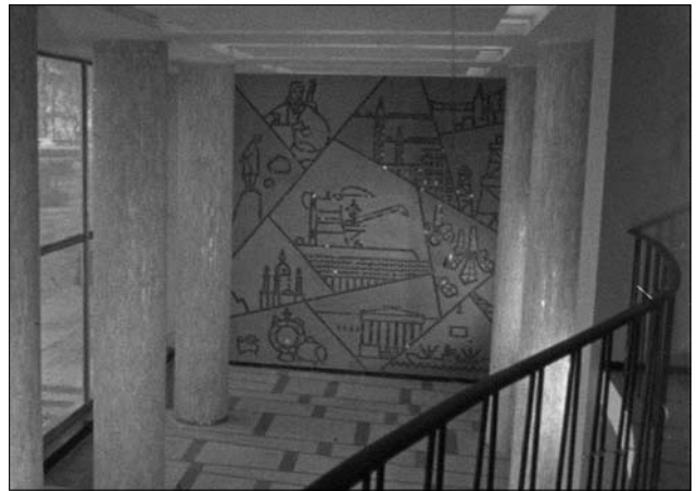
Іл. 1. Панно «Пам'ятки Києва» — художники Г. Зубченко і С. Отрощенко, м. Київ, готель «Дніпро», 1964 р.

З подальшим розвитком створення нових інтер'єрів готелів Києва хочеться приємно описати композицію «Слава на світі най сонцю буде, а мир на Землі, вам, добрії люди» в банкетному залі «Братина», що в готелі «Либідь», яка пропагує щирість та добробут в