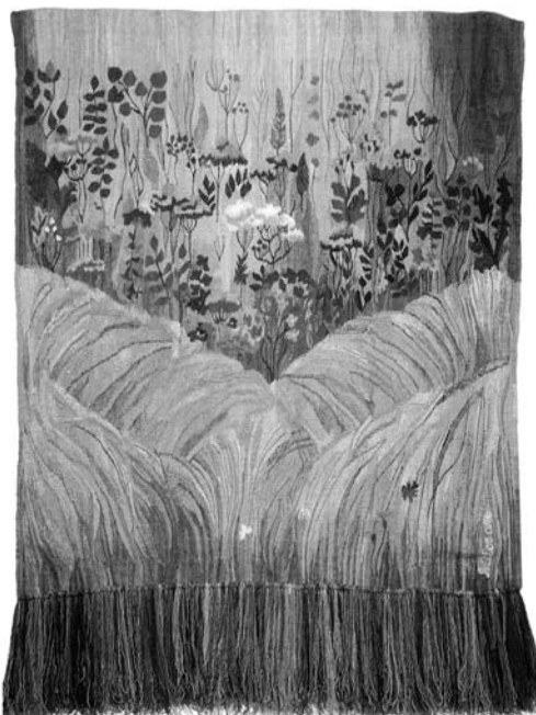
Іл. 4. Гобелен «Золота нива» — художниця Л. Жоголь, м. Київ, готель «Жовтневий» (зараз «Національний»), 1983 р.

гостродемократичний ракурсний погляд на явища й події сучасного вітчизняного життя з його прагненнями до перебудови на широкій основі республіканізації та розвою духовності й розкнутості» [3, с. 3].