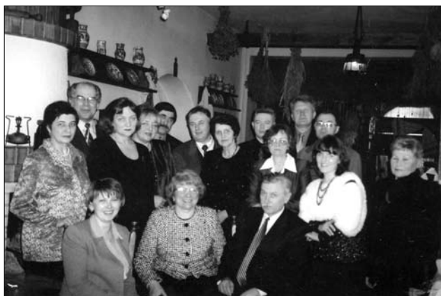
Співробітники Інституту народознавства та члени відділу етнології сучасності на святкуванні 60-річчя проф. Антоніни Колодій (січень, 2003)

нокультурних процесів в Україні, проблем і перспектив розвитку традиційної культури українців в системі етнокультурного простору давньої і сучасної України. Зазначена концепція лягла в основу останніх п'ятирічних планових тем відділу: «Сучасні етнокультурні процеси в Україні: проблеми і перспективи» (2001—2005); «Традиційна культура українців в умовах новочасних соціокультурних трансформацій» (2006—2010); «Традиційна культура в системі етнокультурного простору давньої і сучасної України» (2011—2015); «Трансформаційні процеси традиційної культури українців: сучасна дискусія глобального та національного» (2016—2020).