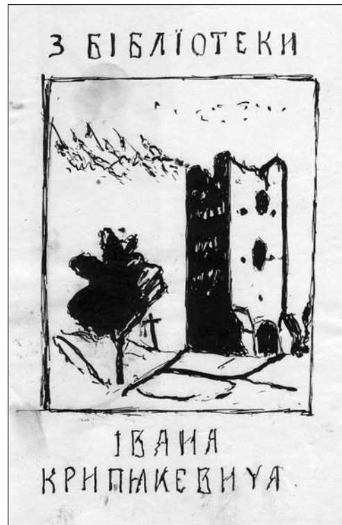
Іл. 2. О. Кульчицька. Ескіз екслібриса І. Крип'якевича. Туш, перо (Збірка екслібрисів. Архів родини І. Крип'якевича)

З ескізів видно, що Іван Крип'якевич хоче бачити на своєму екслібрисі передовсім вежу, але йому не подобається оточення. Мисткиня залишає без змін зображення вежі, як візуального центру малю-